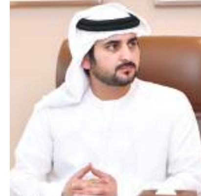
مكتوم بن محمد

رفع سمو الشيخ الدكتور سلطان بن خليفة آل نهيان مستشار صاحب السمو رئيس الدولة أسمى آيات التهاني والتبريكات إلى مقام صاحب السمو الشيخ خليفة بن زايد آل نهيان رئيس الدولة «حفظه الله» وصاحب السمو الشيخ محمد بن راشد آل مكتوم نائب رئيس الدولة