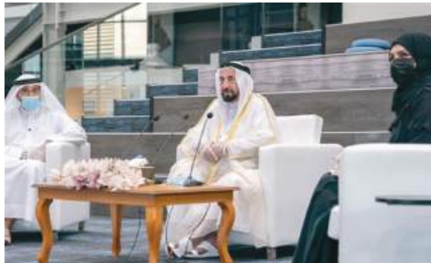
سلطان القاسمي خلال زيارته هيئة الشارقة للتعليم الخاص

المدرسين موضحاً أن مهنة التدريس يستشعر من خلالها المدرس تأثيره وتنشئته للأجيال ليعطي طلبته كل ما لديه من فكر وعلم ويواكب التطور المستمر في هذا المجال. وقال سموه: «نشأنا أكاديمية الشارقة للتعليم لإعطاء المدرس العلم والمعرفة وأساليب التدريس وطرقه وقد بدأ العمل فيها وانتسبت لبرامجها مجاميع كثيرة من المدرسين، والأكاديمية تعطي درجة علمية تقدر بماجستير ومع الاستمرار تصل إلى درجة الدكتوراه المتخصصة في برامج التعليم.» وحول دور الآباء والأمهات، قال سموه: نحتاج إلى تكاتف الأهالي من آباء وأمهات فالمسؤولية كبيرة لتهيئة الأبناء من خلال البيئة المناسبة والتشجيع وإعطائهم القدر الكافي للعب وللراحة أيضاً وذلك ليقبل الطالب أو الطالبة على المدرسة بارتياح واستعداد لتلقي العلم والمشاركة في ما تقدمه.» واختتم سموه كلمته بتوجيه الشكر الجزيل للمعلمين في هيئة الشارقة للتعليم الخاص والمدرسين والمرسات أملاً الالتقاء بهم مجدداً في نهاية العام الدراسي للاطلاع على نتائج التطور المستمر. وأطلع صاحب السمو حاكم الشارقة خلال زيارته لمقر الهيئة على عرض حول مبادرة «أينأؤكم في مأمن» والمعنية بمتابعة الأبناء منذ صعودهم لحافلة المدرسة وحتى عودتهم للمنزل.