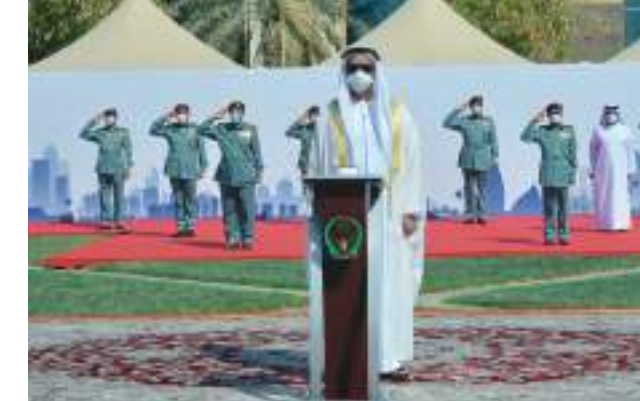
ثم عزفت موسيقى الشرطة السلام الوطني.