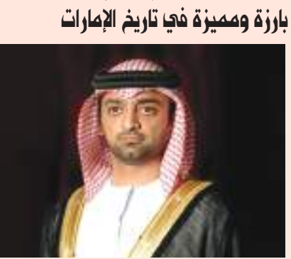
ولي عهد عجمان: عجمان-وام:

أكد سمو الشيخ عمار بن حميد النعيمي ولي عهد عجمان أن «يوم العلم» يجسد التكاتف والتناصر والتعاقد من أجل دولتنا واتحادنا ويرسخ المكانة الرائدة للإمارات والتي تكفلت برفع علم دولتنا عالياً بوصول أول رائد فضاء إماراتي وعربي إلى محطة الفضاء الدولية وانطلاق رحلة مسبار الأمل» للمريخ والتي تمثل علامة بارزة ومميزة في تاريخ دولة الإمارات العربية المتحدة بتحقيق أكبر إنجاز علمي عربي في العصر الحديث ومشروع محطات بركة للطاقة النووية السلمية الذي جعل الإمارات الأولى عربياً في إنتاج الكهرباء من تكنولوجيا الطاقة النووية. قال سموه بمناسبة الاحتفال «بيوم العلم» إن «يوم العلم» مناسبة وطنية غالية على قلوبنا جميعاً تزيد من ثقافة تقدير العلم باعتباره رمزاً للانتماء لهذه الأرض ولهذا الوطن وفيها نجد عزماً على مواصلة مسيرة العمل والعطاء وتوحيد الطاقات من أجل رفعة الوطن وتقديمه لتبقى راية دولة الإمارات عالية خفاقة بين الأمم.