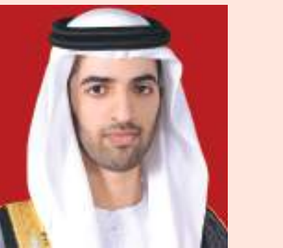
ولي عهد رأس الخيمة: رأس الخيمة-وام:

أكد سمو الشيخ محمد بن سعود بن صقر القاسمي ولي عهد رأس الخيمة أن يوم العلم مناسبة وطنية استثنائية يحتفل فيها شعب دولة الإمارات العربية المتحدة حيث تتجلى فيها قيم الولاء والانتماء والإحساس العميق بقيمة الوطن وعابته. وأشار سموه إلى أن يوم العلم هو يوم الوطن، هو يوم العزة والياء والفخر الوطني، الذي يعكسه هذا العلم، الذي نعمل جميعاً على التودد عنه في ميادين العز وساحات البطولة والحق والواجب والفخر الوطني. وقال سمو ولي عهد رأس الخيمة في كلمته أن «يوم العلم» الذي يصادف ٣ نوفمبر من كل عام يأتي ابتهاجاً بيوم التلاحم الوطني، يوم حب الوطن واحترافاً بذكرى تولى قائد مسيرة الخير والبناء صاحب السمو الشيخ خليفة بن زايد آل نهيان رئيس الدولة «حفظه الله» مقاليد الحكم في البلاد لتحقيق في عهده المزيد من الإنجازات على مختلف الصعد لتبقى دولتنا عنواناً للأمن، ونموذجاً حضارياً للتقدم والأزدهار.