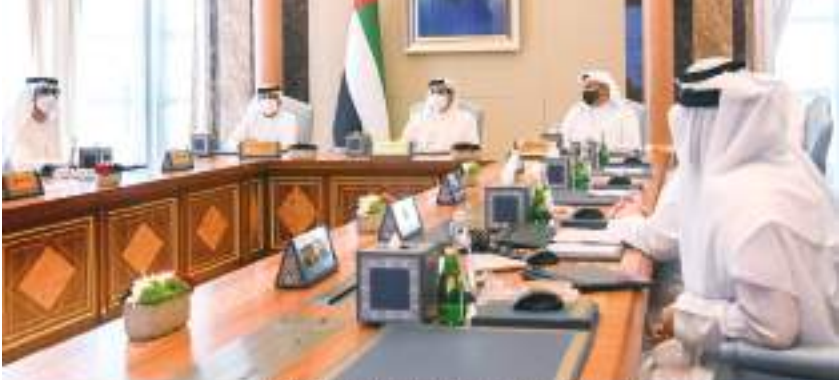
منصور بن زايد خلال ترؤسه الاجتماع