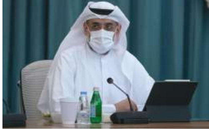
ولي عهد الشارقة خلال ترؤسه الاجتماع

خلال الفترة المنصرمة مؤكدا استمرار دعمه لبرامجها وأنشطتها، ووجه الدوائر بضرورة المساهمة في توفير الدعم اللازم لهم.