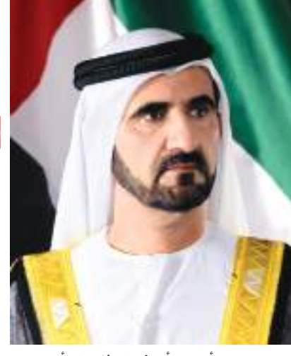
كل شي وكل أحد.. وأن فكرة الاتحاد أقوى من كل شيء ومن كل أحد ..

أكد صاحب السمو الشيخ محمد بن راشد آل مكتوم، نائب رئيس الدولة رئيس مجلس الوزراء حاكم دبي، رعاه الله، أن عام ٢٠٢٠ عام تحديات وإنجازات أخذت فيها الإمارات علامة النجاح الكاملة.