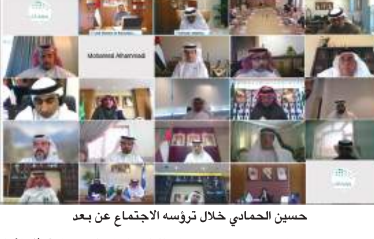
حسين الحمادي خلال ترؤسه الاجتماع عن بعد

يونيو: - الإمارات الأولى إقليمياً والتاسعة عالمياً في التنافسية العالمية لعام ٢٠٢٠.