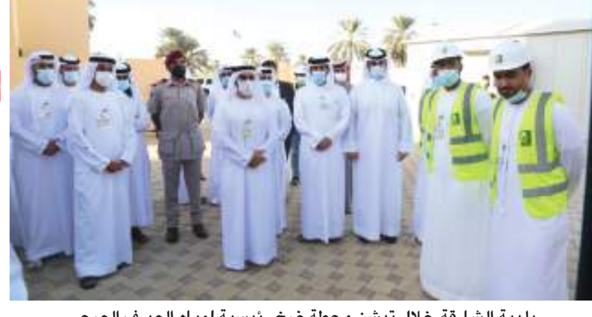
بلدية الشارقة خلال تدشين محطة ضخ رئيسية لمياه الصرف الصحي