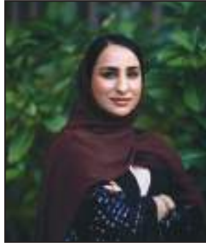
حور - علي داوود:

الكثير. وأخيرا سيقام أسبوع الوجهة البحرية من ٢١ وحتى ٢٣ يناير الحالي، ليشهد الجولة النهائية من سباق قوارب دراغون في خور دبي. ويشمل مهرجان دبي للتسوق الكثير من العروض الترفيهية التي تجري في مختلف أنحاء المدينة بهدف إدخال السعادة إلى قلوب سكان دبي وزوارها طوال فترة المهرجان. وتقدم تجربة نافورة دبي المائية للسكان والزوار فرصة ركوب قوارب الكاياك أو الدراجات المائية أو قوارب البجع في بحيرة نافورة دبي.