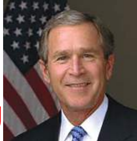
لبعض القادة السياسيين منذ الانتخابات وقلة الاحترام التي تظهر اليوم لمؤسساتنا وتقاليدنا وانفاذ القانون لدينا.