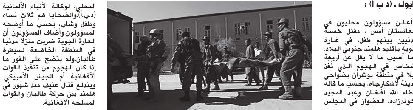
كابول