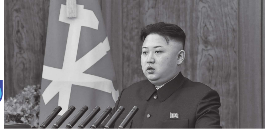
سول - (د ب أ) :

أعرب زعيم كوريا الشمالية كيم جونج أون عن رغبته في توسيع القدرات العسكرية لبلاده رغم العقوبات الدولية والمشاكل الاقتصادية الهائلة. وكان كيم قد استعرض الأهداف والسياسات الاستراتيجية والتكتيكية التي سوف يتم تنفيذها في إطار خطة تطوير جديدة تستمر خمس سنوات أول أمس وهو اليوم الثاني من اجتماع حزب العمال الحاكم. وذكرت وسائل الإعلام التي تسيطر عليها الدولة أمس أن كيم شدد في تقريره الخاص بالإدارة على "أهمية الإرادة في حماية موثوق بها لأمن البلاد والشعب والبيئة السلمية للبناء الاشتراكي بوضع قرارات الدفاع للبلاد على مستوى أعلى بكثير. ومن غير الواضح من التقارير ما إذا كيم قد نكر الأسلحة النووية للبلاد. وكان كيم قال في اجتماع للجنة المركزية للحزب في نهاية 2019، إن بيونغ يانج لم تعد ملتزمة بمذكرة تفاهم بشأن تجارب القنابل الذرية والصواريخ الباليستية العابرة للقارات. وما زالت كوريا الشمالية معزولة دوليا بسبب برنامجها الخاص بالأسلحة النووية.