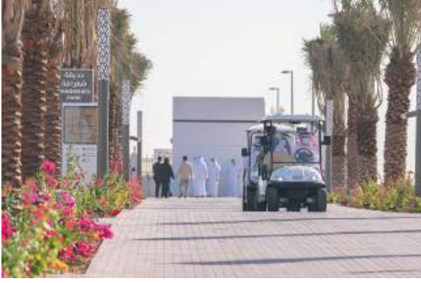
حاكم الشارقة خلال تفقده حديقتي كشيشة وشغرافة