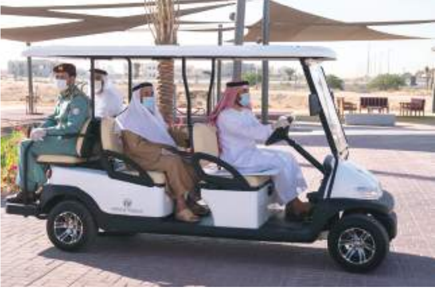
حاكم الشارقة خلال تفقده حديقتي كشيشة وشغرافة