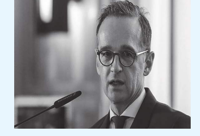
برلين / موسكو (د ب أ) :

موسكو: ما يحدث في واشنطن شأن داخلي برلين تحذر من إمكانية وقوع اضطرابات جديدة في الولايات المتحدة