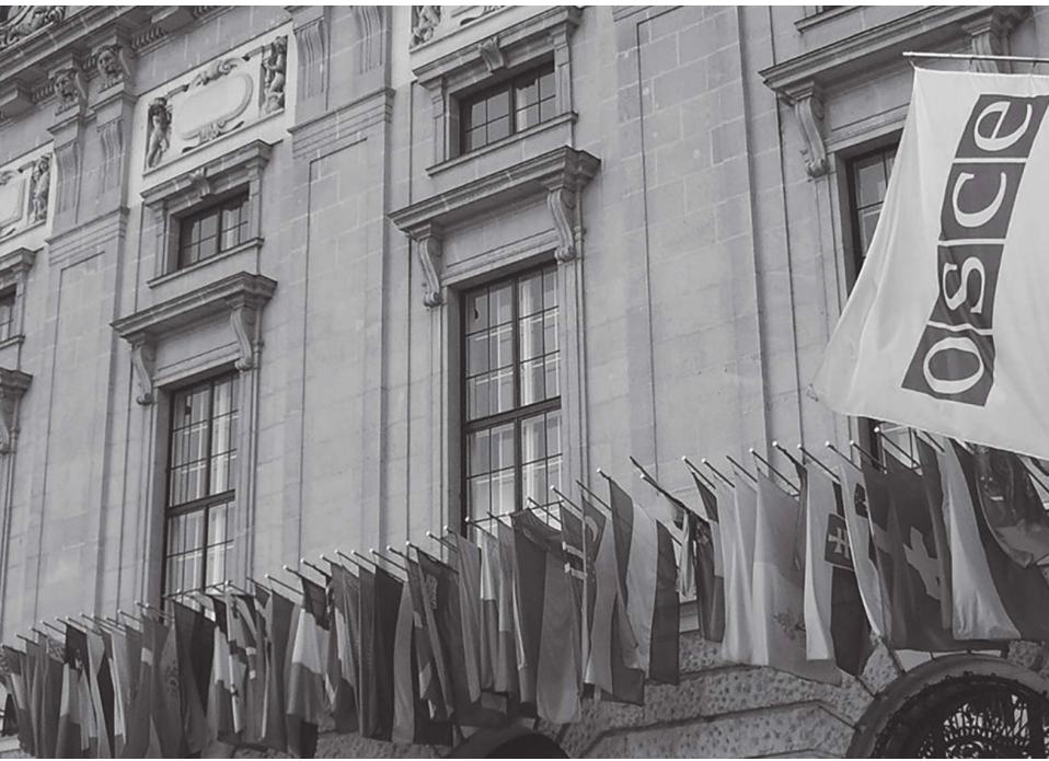
وارسو - (د ب أ) :

دعت منظمة الأمن والتعاون في أوروبا إلى ضبط النفس والحفاظ على مبادئ الديمقراطية، في أعقاب اقتحام المئات من أنصار الرئيس الأمريكي المنتهية ولايته، دونالد ترامب، لمبنى الكونغرس (الكابيتول) بواشنطن في وقت سابق من مساء أول أمس، في محاولة لإلغاء نتيجة الانتخابات. وفي بيان نشر أمس، أعرب مكتب المؤسسات الديمقراطية وحقوق الإنسان التابع لمنظمة الأمن والتعاون في أوروبا، "عن قلقه بشأن نزاهة العملية الديمقراطية"، وقال إن الولايات المتحدة، بوصفها عضوا في منظمة الأمن والتعاون في أوروبا، يجب أن تضمن تعيين المرشحين الذين يحصلون على الأصوات اللازمة، في منصبهم، على النحو الواجب. وقالت منظمة الأمن والتعاون في أوروبا إنه "ليس هناك