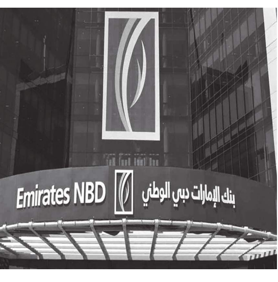
بنك الإمارات دبي الوطني Emirates NBD

دبي - (الوحد): أعلن بنك الإمارات دبي الوطني، يوم الخميس، عن إصدار سندات ممتازة تستحق بعد خمس سنوات بمبلغ 750 مليون دولار (2,752 مليار درهم). وقال البنك في إفصاح أرسله لسوق دبي المالي، إنه تم إصدار السندات بتاريخ 6 يناير الجاري، فيما سيتم إدراج هذه السندات بتاريخ 13 يناير وتستحق بتاريخ 13 يناير 2026. وأظهرت وثيقة أن بنك الإمارات دبي الوطني، كلف بنوكاً لترتيب مكالمات مع مستثمرين قبيل إصدار سندات مقومة بالدولار بقيمة لا تقل عن 500 مليون دولار. وبحسب الوثيقة، التي