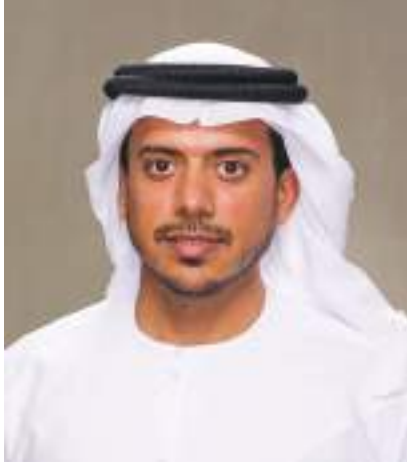
سلطان بن طحنون

ونكر معاليه: "أنه عادة ما نتاح لنا الفرصة خلال أصعب الأوقات لمعرفة ما الذي يجعلنا مجتمعاً متماسكاً ومتحداً. لقد رأينا أفعالاً تعكس طيبة مجتمع دولة الإمارات وأوقانا تضامناً فيها الأصدقاء والجيران والعملاء، لدعم ومساعدة بعضنا بعضاً ولا يمكن لأي مكان آخر أن يشهد هذا القدر من المرونة والالتزام والشجاعة التي أحسن في تقديمها أكثر من ٩٠٠٠٠ من المتخصصين والمتطوعين في خط دفاعنا الأول. عملوا بجِد وعرضوا أنفسهم للمخاطر في سبيل حمايتنا وضمان حياة أفضل ومستقبل أكثر إشراقاً لجميع أفراد مجتمعنا". وقال معاليه: "بفضل إنجازات هؤلاء الأبطال الوطنيين، نحن مستعدون لدخول عام ٢٠٢١، والاحتفال باليوبيل الذهبي لتأسيس دولة الإمارات العربية المتحدة بتفاؤل كبير بالمستقبل، وبالعامل الجاد والإرادة القوية، نحن على استعداد لتحقيق الرؤية الطموحة التي وضعتها القيادة الرشيدة في دولة الإمارات للسنوات الخمسين القادمة لهذه الدولة العظيمة".