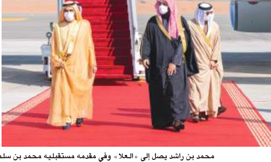
محمد بن راشد يصل إلى «العا» وفي مقدمه مستقبليه محمد بن سلمان آل سعود للمشاركة في القمة الأولى لقادة مجلس التعاون الخليجي