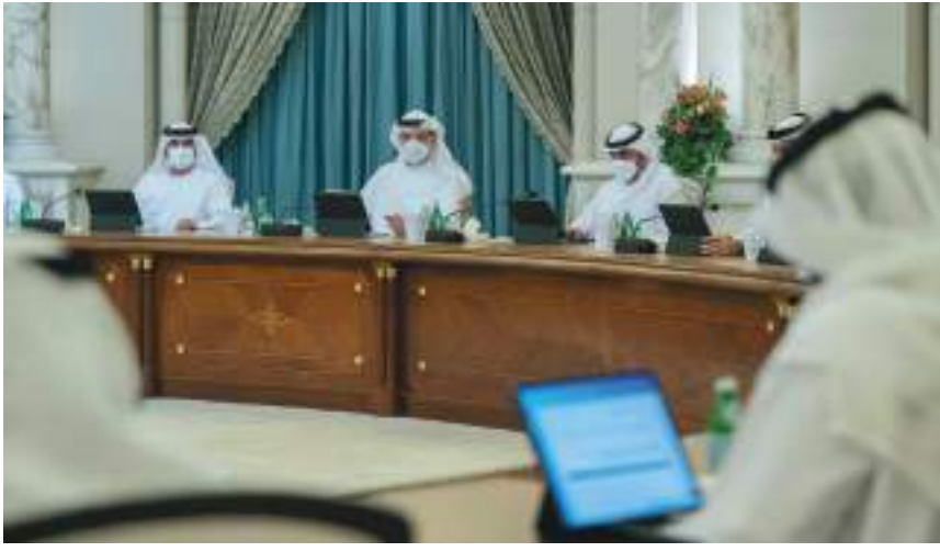
ولي عهد الشارقة خلال ترؤسه الاجتماع «وام»

وأطلع المجلس على تقرير دائرة التنمية الاقتصادية حول المؤشرات الاقتصادية في مؤسسة الشارقة لدعم المشاريع الريادية «رواد»، مطلعاً على الآلية التي تتبعها المؤسسة والأنشطة التي تحظى بالأولوية، وما تقدمه من