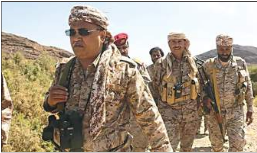
صنعاء- (د ب أ):

من إيران، في جبهات القتال شرق مدينة الحزم.. وأضاف البيان، أن المعارك التي خاضها الجيش والمقاومة خلال الساعات الماضية، أسفرت عن مقتل ما لا يقل عن ٢٦ عنصرًا من المليشيا الحوثية إلى جانب عشرات الجرحى، فيما استعاد الجيش سيارتي دورية بعثادهما، إضافة إلى أسلحة أخرى متوسطة وخفيفة وكميات من الذخائر المتنوعة.»