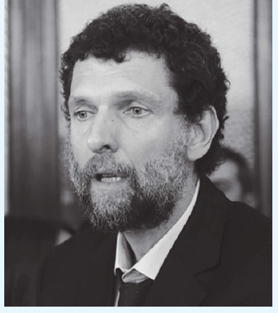
استطنبول

أكدت تركيا أمس رفضها طلب أمريكي للإفراج عن رجل الأعمال والناشط البارز عثمان كافالا، ووصفت الأمر بأنه يتناقض مع مبدأ سيادة القانون.