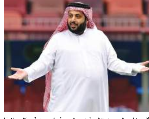
مولاي خادم الحرمين الشريفين وسمو سيدي ولي العهد السعودي وكلاهما من بلادنا العربية تحياتي .

رد تركي آل الشيخ، رئيس هيئة الترفيه بالمملكة العربية السعودية، على الأنباء التي تردت حول شراء أسهم شركة ستادات المصرية، بعد تولي سيف الوزيري مهمة رئاسة الشركة. وقال آل الشيخ عبر صفحته الرسمية بموقع فيس بوك: "ألزمت أوكر، لا علاقة لي بالاستثمار في الرياضة بمصر من قريب أو بعيد، ولم أتمك أي شركة في هذا الخصوص". وأضاف: "علاقتي بالأخ سيف الوزيري العملية منتهية منذ فترة. لا نية لي بالاستثمار الرياضي في مصر الآن ولا مستقبلا. أرجو تحري الدقة وعدم الالتفات للشائعات المغرضة". وتابع: "تركي آل الشيخ إذا عمل شيئا يصرح فيه ولا يوجد لدي ما أخفيه. حفظ الله