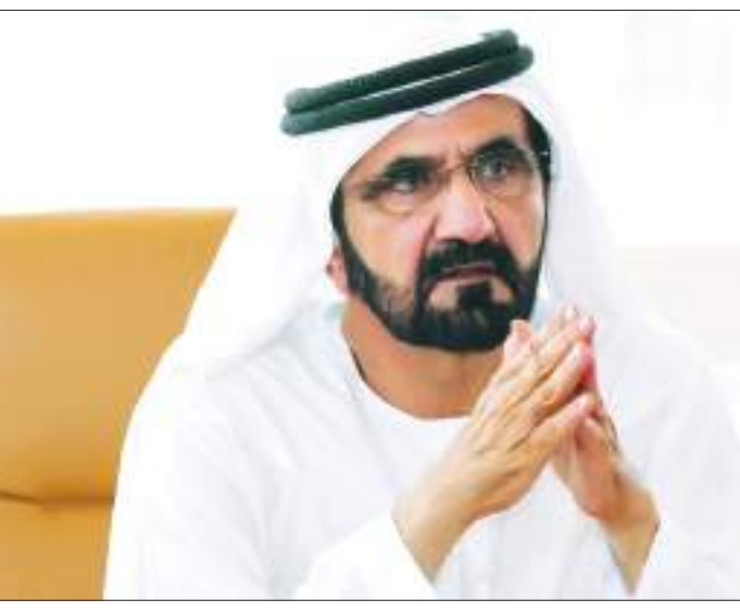
طالع ص ٣

أمر صاحب السمو الشيخ محمد بن راشد آل مكتوم نائب رئيس الدولة رئيس مجلس الوزراء حاكم دبي رعاه الله، بتمديد المهلة المحددة للبناء على قطع الأراضي الممنوحة للمواطنين من حكومة دبي لأغراض السكن الخاص، وذلك لمدة ثلاث سنوات إضافية تبدأ من اليوم التالي لتاريخ انتهاء المهلة السابقة. وتعد هذه المهلة الثانية التي يأمر بها صاحب السمو الشيخ محمد بن راشد آل مكتوم، لتمديد فترة السماح للمواطنين لبناء الأراضي الممنوحة لهم لأغراض السكن الخاص، حيث كان سموه قد أمر في العام ٢٠١٨ بتمديد مهلة البناء لمدة ثلاث سنوات.