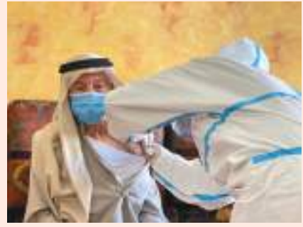
الشارقة - وام:

تتعامل دائرة الخدمات الاجتماعية في الشارقة مع ٤٨٣٦ بلاغاً للتعطيم المنزلي للقاح كوفيد ١٩، لكبار المواطنين والمعاقين والمرضى النفسيين وذويهم في المنازل على مستوى إمارة الشارقة. وتعمل دائرة الخدمات الاجتماعية على توفير خدمة تقديم اللقاح عبر مركز خدمات كبار السن، من خلال الزيارات المنزلية اليومية التي يقوم بها الفريق الطبي عبر ٣٥ وحدة متنقلة تجوب مدن الشارقة، وخورفكان، ودبا الحصن، ولباء، والحميرة، والذيد، والمدام، والبطائح، ومليحة، بواقع حوالي ١٠٠ زيارة يوميا.