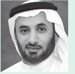
دبيجا - وام:

«أراضي دبي» تنجز 1.4 مليون خدمة رقمية خلال 2020