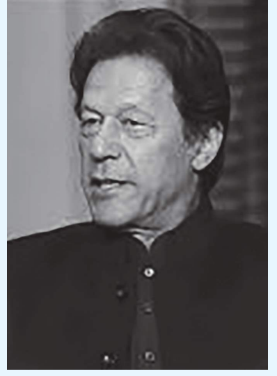
كولومبو - (د ب أ) :

دعا رئيس وزراء باكستان عمران خان، الذي يزور سريلانكا حاليا، لتحسين علاقات التجارة بين دول جنوب آسيا بهدف تقليص معدلات الفقر في المنطقة. وقال خان في خطاب مشترك أمام منتدى الاستثمار الباكستاني-السريلانكي في كولومبو أنا متفائل بأن يسود هذا الشعور، إن أن الوسيلة الوحيدة في شبه القارة الهندية لإخراج المواطنين من الفقر هي تحسين العلاقات التجارية. وأجرى خان خلال زيارته لسريلانكا، التي تستغرق يومين، لقاءات بالرئيس جوتابايا راجاباكسا وشقيقه رئيس الوزراء ماهيندا راجاباكسا. والتقى مجموعة من الساسة المسلمين بخان، وطلب منه دعوة حكومة سريلانكا للسماح بدفن المسلمين الذين توفوا بغيروس كورونا. وكانت الحكومة في سريلانكا قد أقرت تشريعا مثيرا للجدل يحظر دفن ضحايا فيروس كورونا، بسبب مخاوف تتعلق بالعدوى.