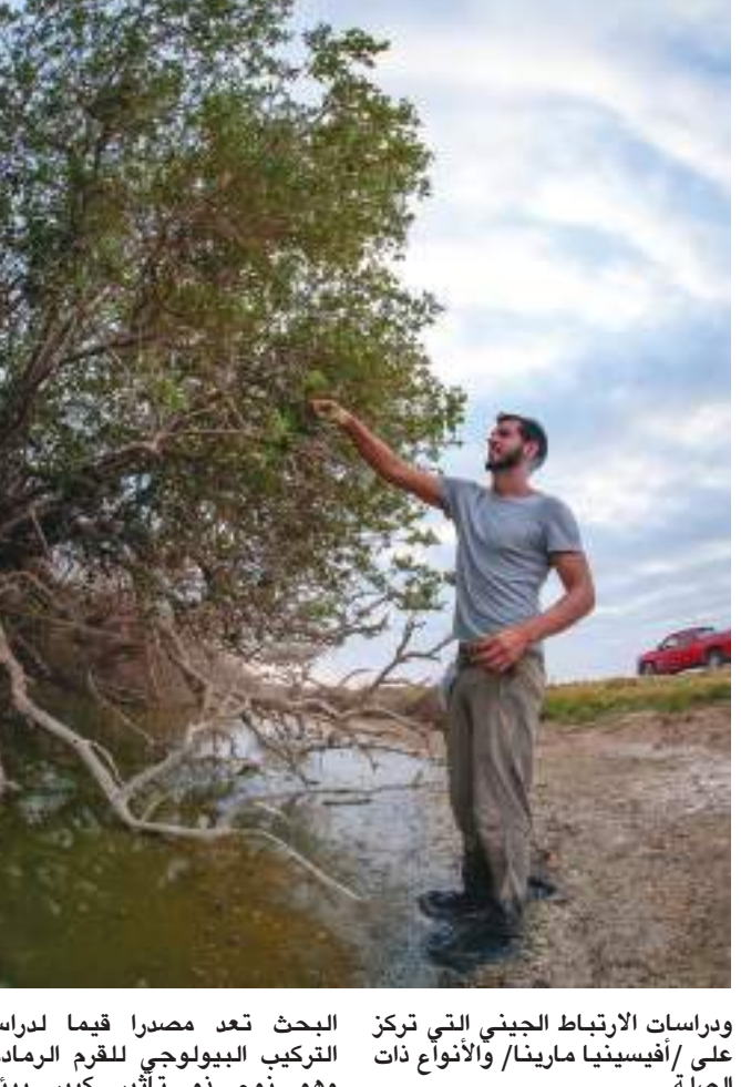
دراسات الارتباط الجيني التي ركّز على /أفيسينا ماريئا/ والأنواع ذات الصلة. وأشار إلى أن البيانات المرجحة في