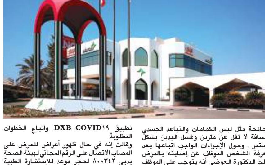
تطبيق 1٩ COVID - DXB واتباع الخطوات المطلوبة.

وذكرت أن تطبيق العزل المنزلي يتم في حال توفّر شروط ومتطلبات هذا العزل للأشخاص الذين لا تظهر عليهم أي من أعراض المرض أو تكون الأعراض بسيطة مع توافق المنزل لإشراطات العزل ومنها توفير غرفة منفصلة مع حمام خاص واستقرار الحالة الصحية للمريض ولا يكون أي من المقيمين في المنزل من الفئات الأكثر عرضة للمخاطر وتوفر وسائل إتصال مثل وجود هاتف فعال والتمّيز المريض والمتواجدين معه بالإجراءات الاحترازية الموصى بها في حالات العزل المنزلي وتوفر عدة الإسعافات الأولية التي تحتوي على جهاز قياس درجة الحرارة، ولبقت إلى الفئات الأكثر عرضة للمرض مرض «كوفيد-١٩» وهم الفئة العمرية فوق ٦٠ سنة والأشخاص الذين يعانون من مشاكل صحية مثل مرضى السكري وأمراض القلب الخطيرة مثل نقص التروية القلبية وإرتفاع ضغط الدم غير المنتظم وأمراض الرئة وأمراض الجهاز التنفسي المزمنة بما في ذلك الربو المعتدل إلى الشديداً وأمراض الكلى المزمنة والشلل الكلوي ومرض الكبد المزمن ومرضى السرطان الذين ما زالوا يخضعون للعلاج والمرضى الذين يستخدمون الأدوية البيولوجية أو الأدوية المثبطة للمناعة والمرضى الذين لديهم تاريخ زراعة أعضاء والأشخاص من أي فئة عمرية ممن يعانون من السمنة المفرطة أو الأشخاص الذين يعانون من بعض الحالات الطبية الأساسية خاصة إذا لم يتم التحكم فيها جيداً وأية حالة صحية قد تضعف المناعة وأصحاب الهمم والأشخاص الذين يقيمون في مراكز الرعاية طويلة الأجل.