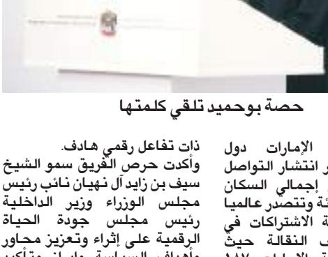
حصة بوحديد تلقي كلمتها

أبوظبي- وام: أكدت معالي حصة بنت عيسى بوحميد وزيرة تنمية المجتمع نائبة رئيس مجلس جودة الحياة الرقمية أن السياسة الوطنية لجودة الحياة الرقمية إطار عمل دائم ضمن مميزات الوصول إلى الريادة المجتمعية في التعليم والعمل عن بعد خصوصاً واستثمار لرؤية القيادة المحفزة نحو تحقيق أفضل جودة حياة لجميع سكان دولة الإمارات من مواطنين ومقيمين وزائرين توافقاً مع توجهات الإستراتيجية الوطنية لجودة الحياة ٢٠٢١ في بناء مجتمعات رقمية آمنة وهادفة وإيجابية وانسجاماً مع مئوية الإمارات ٢٠٧١ من خلال العمل على تحقيق أهدافها التنموية نحو المستقبل خاصة في مجالات تهيئة المجتمع بالمهارات والمعارف والسلوكيات التي تستجيب للمتغيرات المتسارعة، منسيرة إلى أن المجتمع الإماراتي من المجتمعات المتقدمة في مؤشرات الحياة الرقمية بسبب انتشار ثقافة استخدام الإنترنت وتوفر ورواج استعمال وسائل التواصل الاجتماعي على نطاق واسع. وكشفت معاليها خلال الإطاعة الإعلامية التي نظمتها الوزارة لإعلان عن تفاصيل السياسة الوطنية لجودة الحياة الرقمية التي اعتمدها صاحب السمو الشيخ محمد بن راشد آل مكتوم نائب رئيس الدولة رئيس مجلس الوزراء حاكم دبي رعاه الله حين قال: "مخاطي من يظن أن العالم بعد كوفيد ١٩ كالعالم قبله" وصاحب السمو الشيخ محمد بن زايد آل نهيان ولي عهد أبوظبي نائب القائد الأعلى للقوات المسلحة حين قال: "القيم والأخلاق لها دور جوهري في المجتمع.. والإمارات قادرة على تجاوز الأزمة... لا تشلون هم، مشيرة إلى أن هدف السياسة الأسى هو خلق مجتمع رقمي آمن في دولة الإمارات وتعزيز هوية إيجابية