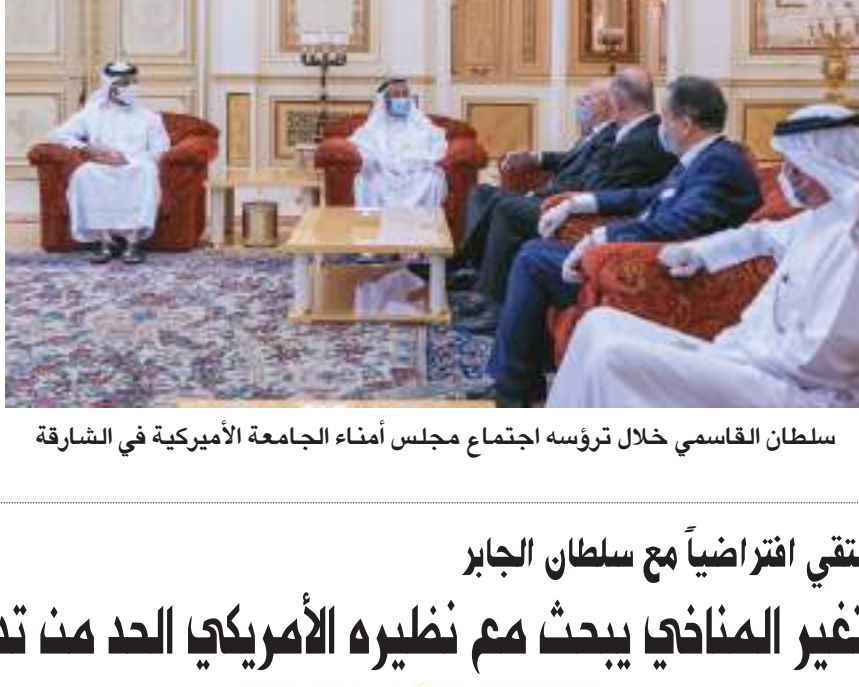
سلطان القاسمي خلال ترؤسه اجتماع مجلس أمناء الجامعة الأميركية في الشارقة