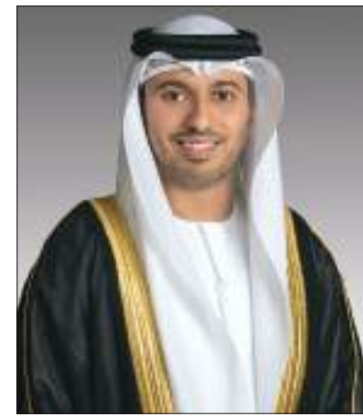
أبو ظبي- وام :

الإنجازات الرياضية، برعاية ومتابعة كريمة من سمو الشيخ منصور بن زايد آل نهيان نائب رئيس مجلس الوزراء وزير شؤون الرئاسة، لتكون موعداً لتكريم كل من رفع علم بلاده في المحافل الدولية، ودليلاً على تقدير الدولة للمبدعين في المجال الرياضي، وتجسيداً لتوجيهات القيادة الرشيدة بالاستثمار في أبناء الوطن وتمكينهم في كافة المجالات. وقال سموه : نحتج رياضة الإمارات في تحقيق الكثير من الإنجازات خلال المرحلة الأخيرة، ونقف حالياً على أعتاب مرحلة جديدة تتطلب تضامناً من الجميع من كافة الكوادر العاملة بقطاع الرياضة، سواء كانوا لاعبين أو مدربين أو حكام أو إداريين، لتعزيز المكتسبات،