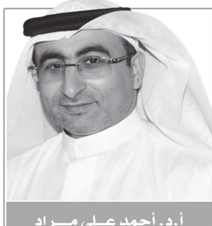
أ.د. أحمد علي مراد

كما عملت على إيجاد مصادر مياه بديلة عن طريق معالجة مياه الصرف الصحي، وبنيت السدود التي بدورها غدت الخزانات الجوفية، كما اعتمدت على التقنيات الحديثة في الزراعة المستلهمة من استراتيجية الأمن المائي ٢٠٣٦، بالإضافة إلى تجربتها الرائدة في برنامج الاستمطار. وأكد البروفيسور مراد أن المجتمعات دور مهم في الحفاظ على المياه كثروة وطنية، من منطلق أن المياه جزء من المجتمع، وهو ما يتطلب من أفراد المجتمع أن يساهموا في تحقيق الحلول لقضية المياه من خلال تجنبهم للهدر واستخدام تقنيات حديثة في الزراعة والالتزام بالإرشادات والقوانين المقننة لاستعمال المياه وتقليل الضغط على الخزان الجوفي لضمان ادخار هذه الثروة للأجيال القادمة.