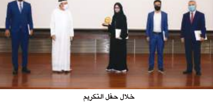
خلال حفل التكريم

على المساهمة الفعالة في بناء اقتصاد معرفي لدولة الإمارات من خلال مشاريع ابتكارية قابلة للتطبيق الاقتصادي مع ضمان الوصول للجميع إلى فرص الإبداع والابتكار من خلال بيئة ملائمة وداعمة