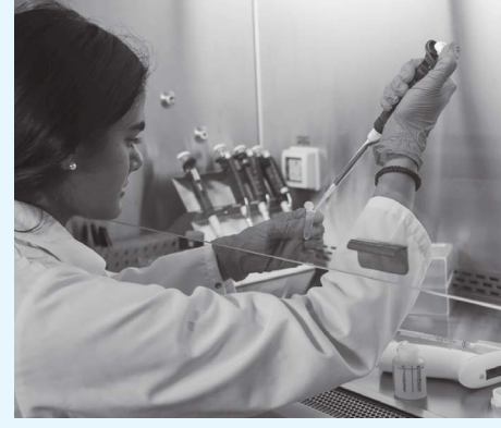
أبوظبي - الوحدة:

«نيويورك أبوظبي» تفتتح باب التسجيل في برنامج الأبحاث للطلاب الجامعيين الزوار