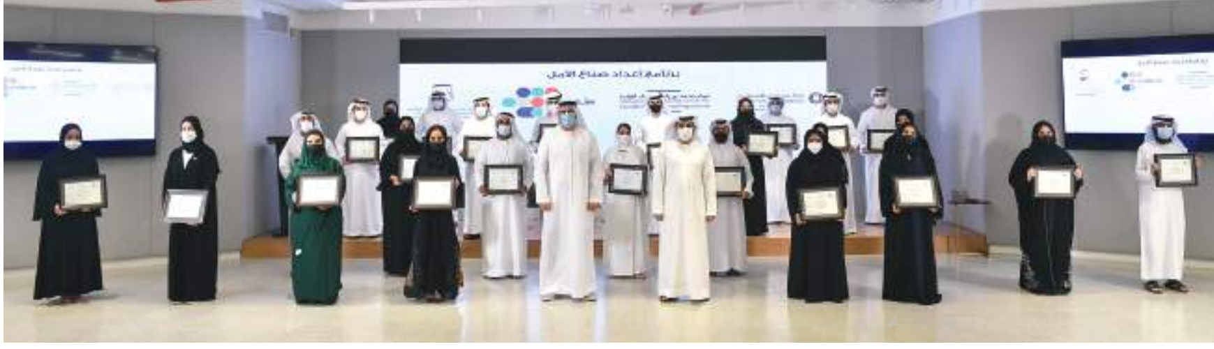
صورة جماعية خلال حفل التخريج

■ 28 خريجاً قدموا 5 مشاريع نوعية لتطوير العمل الإنساني واستشراف مستقبله والابتكار فيه