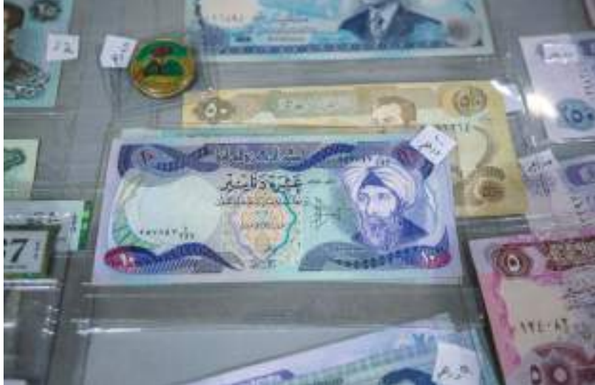
الشارقة - وام:

مجموعة كبيرة من العملات تعرضها الوائلي أمام زوار الجناح العراقي، فمئذ عقد وهي مشغولة بجمعها هوائية ورتتها عن والدها الذي صرف عمراً فيها حيث تشير إلى أن أحدثها يعود إلى فترة الثمانينيات بينما أقدمها يعود إلى الثلاثينيات وتبين أن ما تمتلكه من العملات القديمة لا يقتصر فقط على العملة العراقية وإنما تتسع عبايتها لتشمل أيضاً عملات من مختلف الدول العربية والغربية.