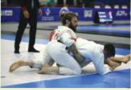
أبوظبي - وام:

قررت رابطة أبوظبي لمحترفي الجوجيتسو تمديد فترة التسجيل في بطولة أبوظبي جراند سلام - التي ستقام في صالة جوجيتسو أرينا بمدينة زايد الرياضية يومي ٢ و ٣ أبريل المقبلين، ضمن سلسلة بطولات أبوظبي - حتى ٢٨ مارس الجاري وذلك على ضوء الأقبال الكبير على التسجيل ورغبة لاستيعاب الأعداد المتقدمة للمشاركة.