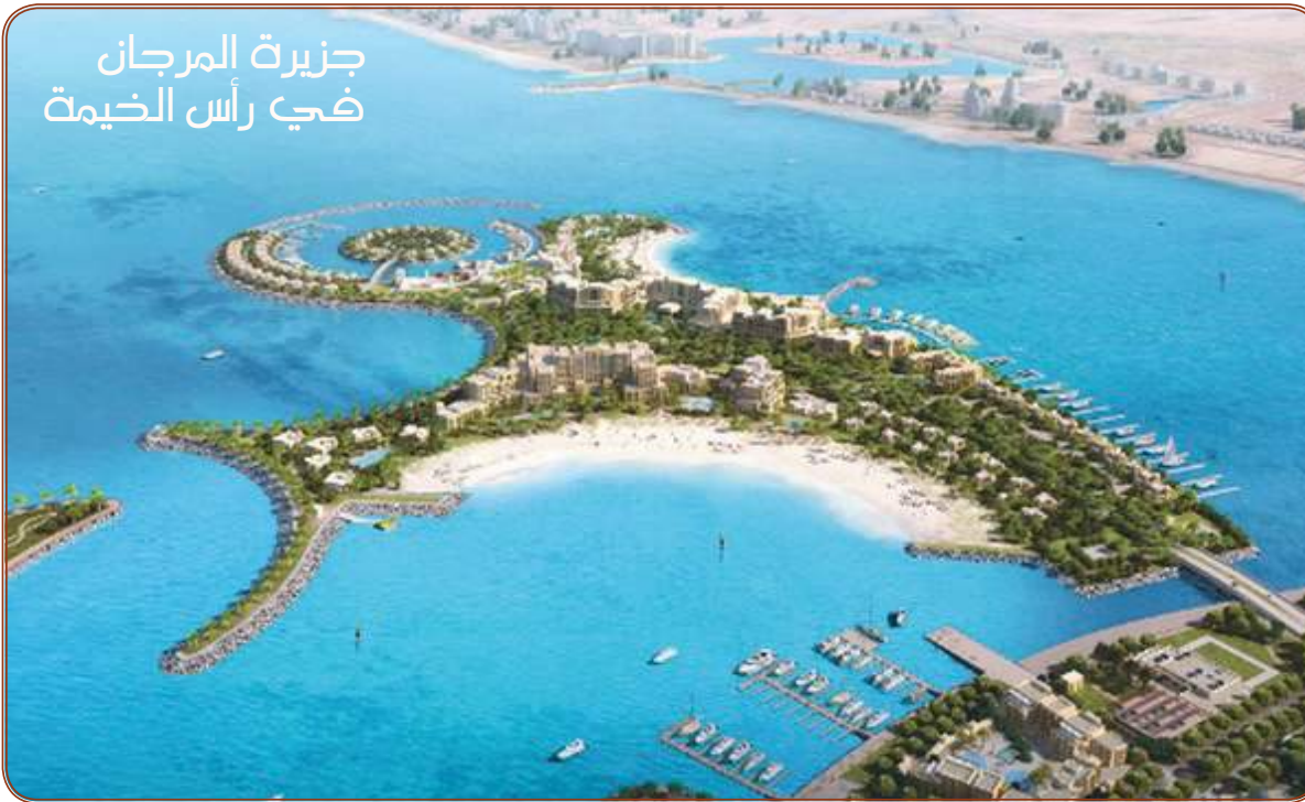
جزيرة المرجان في رأس الخيمة

الجمعة ١٢ شعبان ١٤٤٢ هـ الموافق ٢٦ مارس ٢٠٢١ - العدد ١٤٧٠٤ ٢٠ صفحة/درهم واحد 20 pages\one Dirham السنة الثامنة والأربعون FRIDAY 26 MARCH 2021 - Issue NO. 14704 AL WAHDA