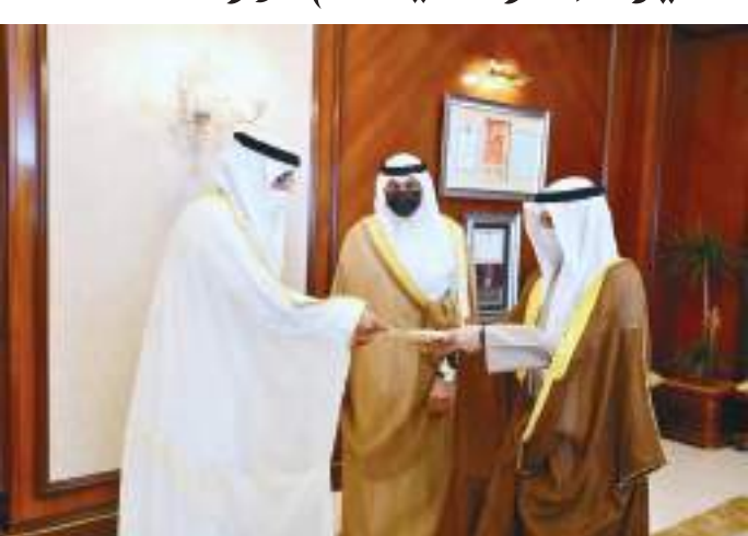
سفير الإمارات خلال تقديم أوراق اعتماده إلى وزير خارجية الكويت