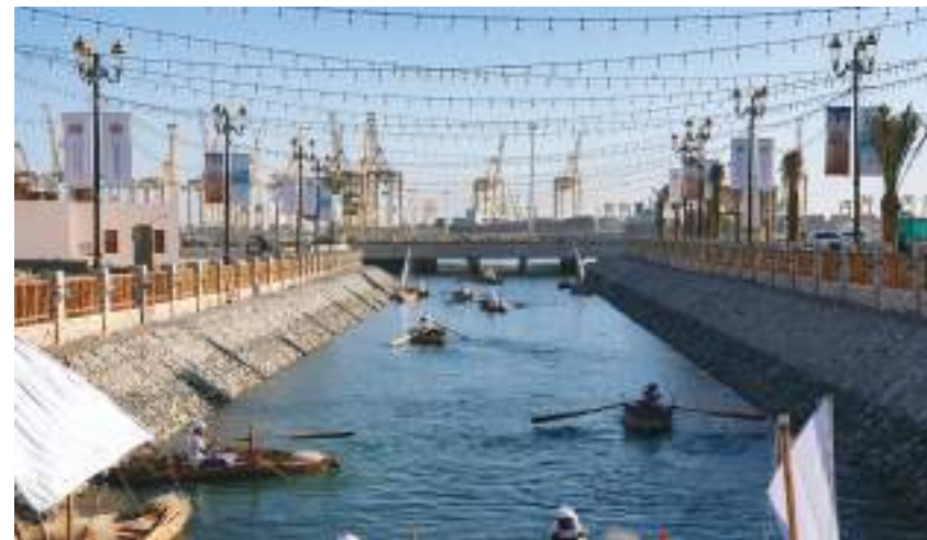
الشارقة - وام:

تجاه حماية واحياء التراث المحلي والإنساني ولكن الظروف الاستثنائية الذي فرضته جائحة كورونا جعل فعاليات الأيام تقام هذا العام في قلب الشارقة ومدينة خورفكان . وأضاف : لقد كانت توجيهات صاحب السمو الشيخ الدكتور سلطان بن محمد القاسمي عضو المجلس الأعلى حاكم الشارقة منذ البداية تؤكد ضرورة أن تقام فعاليات الأيام في مختلف مدن الإمارة ليتاح أمام الجمهور الفرصة للاستمتاع بالحدث والمشاركة فيما يقدمه من ورش وأنشطة ومحاضرات وتعميم فائدته خاصة لدى الأجيال الجديدة الذين تحرص سنويا على أن نخصهم بسلسلة فعاليات وأنشطة نوعية تعمق وعيهم بأهمية التراث .