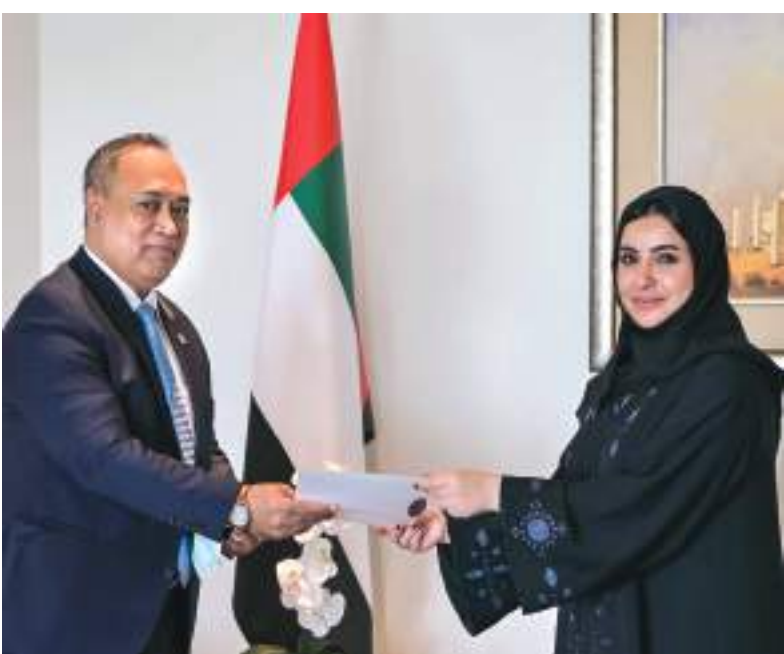
«الخارجية» خلال تسلمها نسخة من أوراق اعتماد سفير دولة توفالو