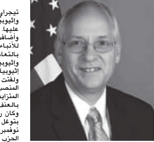
الذي من المتوقع تعيينه في الأسابيع المقبلة، سيركز على الصراع في منطقة

وكان رئيس الوزراء الإثيوبي أبي أحمد أمر بتوغل قواته في تججراي في تشرين ثان/نوفمبر بعدما هاجم جنود متحالفون مع الحزب الحاكم سابقا في المنطقة معسكرا للجيش الاتحادي. وكشف أحمد الثلاثاء أن القتال المستمر منذ أربعة أشهر في تججراي تسبب في أضرار للبنية التحتية بقيمة مليار دولار.