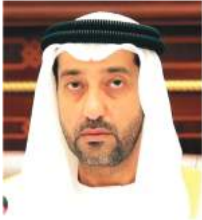
صقر بن محمد بن خالد القاسمي

البلاد وجزءاً منها كما ساهم بموقعه وزيراً للمالية في انتعاش اقتصادها بشكل فعال ومؤثر في الريادة التي تحققت للإمارات.