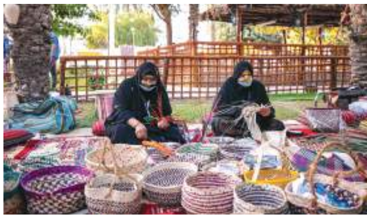
وفي حصيلة البيئة الزراعية التراثية في دولة الإمارات العديد من الأدوات والملامح لها في متحف تاريخ كفاح

هكذا تشكلت بيئة زراعية صار لها تراث يروي وحرف يدوية وطرق لحفظ الغذاء ونظام ري لتوزيع المياه اعتبره الباحثون الأجانب فخرا لأهل هذه البلاد فمن البساطة يولد العمق ومن الشدة والضييق يظهر الفرج ويشمر التعب تورا وعسلا وسعادة. كانت اليازرة أو مضخة الثور وسيلة لاستخراج المياه من الآبار العميقة ودرجة تليها نجد ما يسمى بالمنزقة وكان الابتكار عنوانا للحاجة. وفي بيئة جافة يغلب عليها امتداد الصحراء والسواحل التي تقترح البحر وجهة للرزق لمعت الواحات والمزارع بالقرب من مصادر المياه كما في العجول وليوا والزيد وكلباء أو في أعالي الجبال حيث الانتظار والأمل بهطول المطر كما في رأس الخيمة والفجيرة.