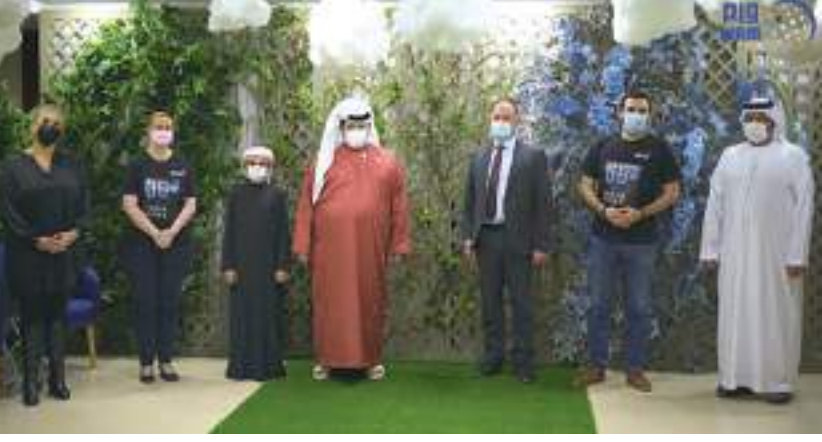
سعید بن طحنون خلال مشاركته بفعالية ساعة الأرض