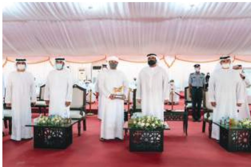
محمد بن حمدان بن زايد خلال حضوره ختام بطولة الظفرة لجمال الخيل العربية