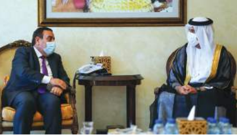
حاكم رأس الخيمة خلال استقباله محافظ الأنبار بالعراق