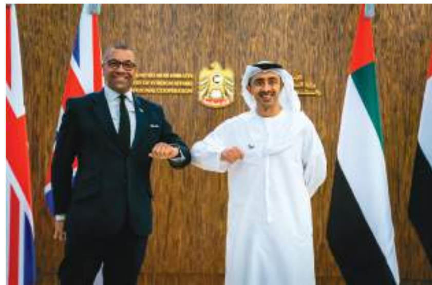
عبدالله بن زايد خلال استقباله جيمس كليفرلي