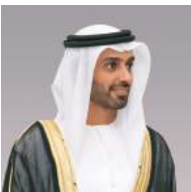
أحمد بن حميد النعيمي

قال الشيخ أحمد بن حميد النعيمي رئيس منطقة عجمان الحرة إن يوم المرأة العالمي يمثل مناسبة للاحتفاء بالدور المحوري للمرأة وتسلط الضوء على إسهاماتها وما وصلت إليه اليوم من تقدم.