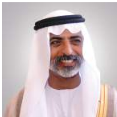
نهيان بن مبارك

قال معالي الشيخ نهيان بن مبارك آل نهيان وزير التسامح والتعايش إن الاحتفال باليوم العالمي للمرأة له طبيعة خاصة في الإمارات، التي قدمت للمرأة خلال نصف قرن من الزمان كافة الفرص وكل سبل الدعم المتواصل لتفعيل جهودها التي أدت إلى تمكينها وتعزيز قدراتها، وهو ما نعتبره تجربة مثالية تمثل نموذجا مرموقا أمام العالم كله، ولم يكن ذلك ليتحقق لولا الجهود المخلصة لسمو الشيخة فاطمة بنت مبارك رئيسة الاتحاد النسائي العام رئيسة المجلس الأعلى للأمومة والطفولة الرئيسة الأعلى لمؤسسة التنمية الأسرية أم الإمارات التي نفتخر بحكمتها وريزتها الثاقبة للتنمية البشرية في كافة أبعادها.