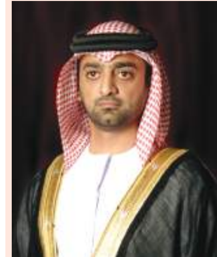
ولي عهد عجمان

عجمان تحقق إنجازات أفضل فيما عدد من المؤشرات التنافسية العالمية