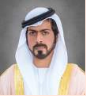
خليفة بن طحنون