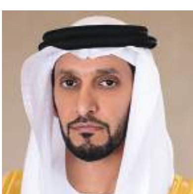
عبدالله آل حامد

أكد معالي الشيخ عبدالله بن محمد آل حامد رئيس دائرة الصحة في أبوظبي أن المرأة الإماراتية استطاعت منذ بزوغ فجر الاتحاد أن ترسخ دورها المحوري في مسيرة التنمية التي كانت تغف الإمارات على أعتابها وقال في تصريح بمناسبة اليوم العالمي للمرأة "على مدى خمسين عاما مضت واصلت كاماراتيات جهودهن من أجل رفعة وعزة وطنك وتواصل الآن كونك عنصرا أساسيا للروى الطموحة التي وضعتها