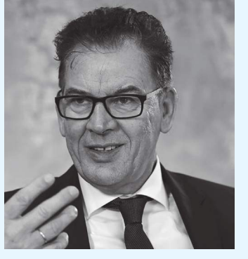
بولينا - (د ب أ) :

دعا وزير التنمية جيرد مولر إلى زيادة الجهود لإغلاق أسواق الحيوانات البرية كإجراء ناتج عن جائحة كورونا. وجاءت دعوة الوزير أمس كرد فعل على دراسة نشرت أول أمس بتكليف من منظمة الصحة العالمية، حيث يفترض الباحثون أن الينجول وكذلك الخفافيش كانت نقطة انطلاق محتملة للعدوى.