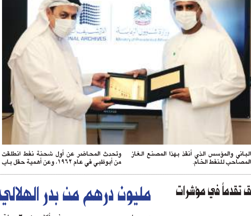
البنائي والمؤسس الذي أنقذ بهذا المصنع الغاز المصاحب للنفط الخام. وحدث المحاضر عن أول شحنة نفط انطلقت من أبوظبي في عام ١٩٦٢، وعن أهمية حقل باب

انطلاقاً من أهمية النفط كنقطة تحول في تاريخ الإمارات الاقتصادي، نظم الأرشيف الوطني محاضرة (عن بعد) بعنوان: «تاريخ النفط قديمها الإعلامي والمؤرخ خليل عيلبوني، مدير مكتب معالي الدكتور مانع سعيد العنتبية وزير البترول الأسبق- استعرض فيها محطات في تاريخ النفط، والدور الذي قام به البنائي والمؤسس الشيخ زايد بن سلطان آل نهيان -طيب الله ثراه- بشأن هذه الثروة التي سخرها لإسعاد شعبه، فعمد إلى تنفيذ خطط طموحة لتنمية الدولة حتى بلغت مصاف الدول المتقدمة، وعلى نهجه سارت قيادتنا الحكيمة التي أدارت هذه الثروة الوطنية بأبكر قدر من الحكمة، والحرص على مصلحة الوطن والأجيال. أكدت المحاضرة أن المسيرة البترولية في الإمارات كانت حافلة بالقرارات المستنيرة، فمنذ تسلم الشيخ زايد بن سلطان آل نهيان المنفذ في أبوظبي عام ١٩٦٦ عمد إلى تعديل الاتفاقية النفطية التي كانت في عام ١٩٣٩ فأنهى نقاط الضعف والإجحاف التي كانت فيها، ثم تحولت المحاضرة إلى بناء مصنع تسهيل الغاز في جزيرة داس، والذي كان بإلهام من فكر