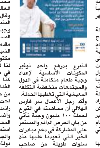
رئيس مجلس الوزراء حاكم دبي «رعاه الله» والتي يطلقها لمد يد العون والمساعدة لكل محتاج في كافة الدول حول العالم.

في شهر رمضان المبارك، فما كنا سنتمكن من الوصول إلى الفئات التي تدعمها الحملة إلا من خلال هذه المبادرة المباركة تحت مظلة مبادرات محمد بن راشد آل مكتوم العالمية... وأضاف أن هذا النهج في دعم المحتاجين ومساندتهم ما هو إلا استمرار لمسيرة العطاء والبذل والوجود والكرم التي أتصلت في دولة الإمارات بقيادة حكومة وشعباً دون تمييز بين عرق أو لون أو ديانة، موجهاً الشكر إلى