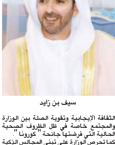
سيف بن زايد

تحت رعاية الفريق سمو الشيخ سيف بن زايد آل نهيان نائب رئيس مجلس الوزراء وزير الداخلية، تنطلق مساء اليوم الثلاثاء مجالس وزارة الداخلية الرمضانية في دورتها العاشرة للعام ٢٠٢١، التي تنظمها وزارة الداخلية عبر تقنيات الاتصال المرئي عن بعد، التزاماً بالإجراءات الاحترازية والوقائية للحد من انتشار فيروس «كوفيد ١٩».