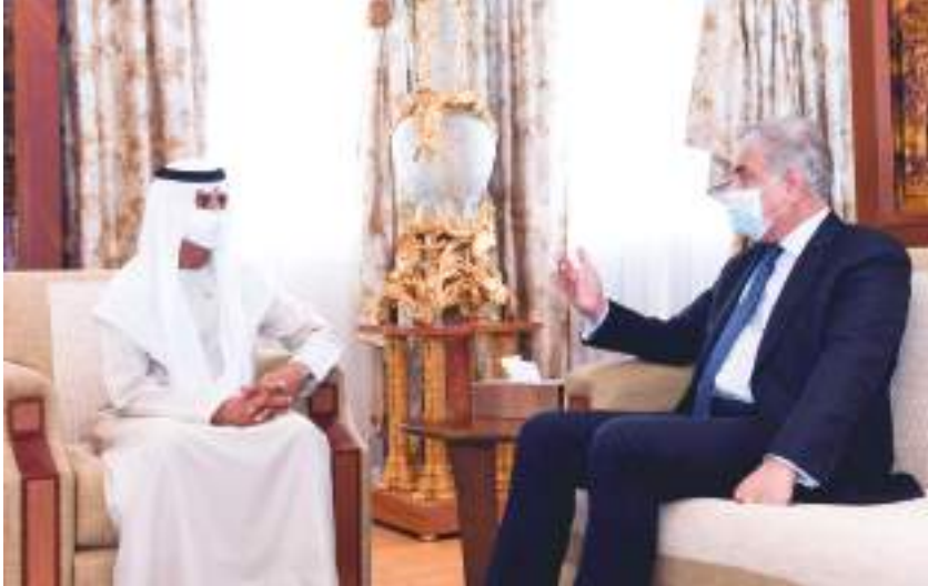
نهيان بن مبارك خلال مباحثاته مع وزير خارجية باكستان