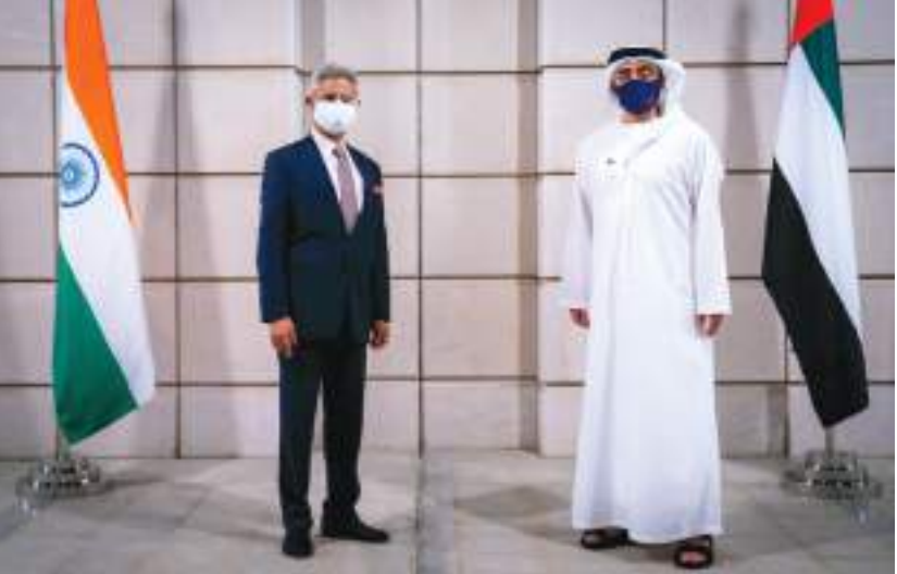
عبدالله بن زايد خلال استقباله وزير خارجية الهند