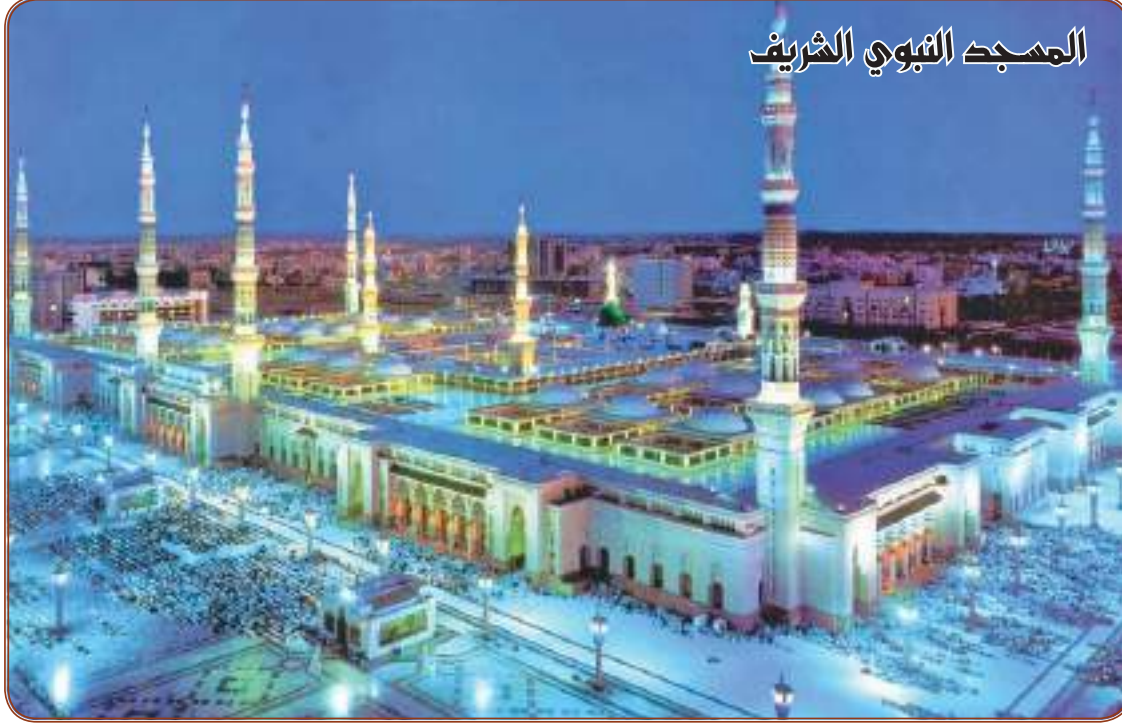
المسجد النبوي الشريف

خلصت دراسة، تشارك في إعدادها باحثون أمريكيون وصينيون، إلى أن الهجمات الإلكترونية على الأنظمة النووية يمكن أن تؤدي لنشوب حرب يستخدم فيها السلاح النووي. الدراسة التي استمرت ٣ سنوات، أجرتها معاهد «شانغهاي للدراسات الدولية ومؤسسة «كارثيقي» ، وحذرت من أن الهجمات الإلكترونية على الأنظمة النووية يمكن أن تؤدي لنشوب حرب يستخدم فيها السلاح النووي. وخلص البحث إلى أن القوى الكبرى لا تقتصر فقط إلى آلية التعامل مع خطر الهجوم على الأنظمة النووية وتحوله إلى حرب، بل إنها لا تدرك التهديد الكامل لذلك. ونبهت إلى أن الخطر قائم حتى لو كانت نية التجسس الإلكتروني على دولة ما دفاعية، ذلك أنه من المحتمل أن تُرد الدولة الضحية للتجسس بانزعاج شديد وقد تستخدم أسلحتها النووية قبل اختراقها، محذرة كلاً من واشنطن وبكين من الانجرار إلى الخيار النووي، خاصة مع وجود تفاوت في القدرات النووية بينهما. ففي الوقت الذي تمتلك فيه الولايات المتحدة حوالي ٥٨٠٠ رأس نووي، يوجد في الصين فقط ٢٠٠. في المقابل اتهمت «مايكروسوفت» الصين باختراق برنامج البريد الإلكتروني لسرقة البيانات من باحثين ومؤسسات أمريكية.