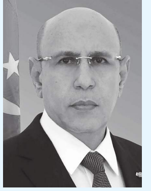
نواكشوط (د أ)-

الرئيس الموريتاني يشيد بإسهام إدريس ديبي في أمن واستقرار منطقة الساحل