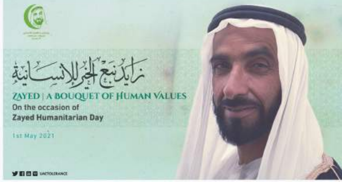
زايد نبع الخير للإنسانية ZAYED | A BOUQUET OF HUMAN VALUES On the occasion of Zayed Humanitarian Day 1st May 2021

وأعلنت وزارة التسامح والتعايش عن دعوتها لكافة فئات المجتمع لمتابعة فعاليات الملتقى الذي يستمر لمدة يوم واحد /افتراضيا/ عبر الموقع