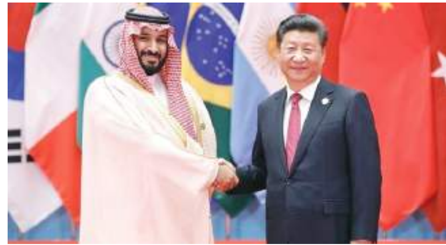
واشنطن (د ب أ) -

منذ وصول إدارة الرئيس الأمريكي جو بايدن إلى البيت الأبيض، والحديث عن الصين يتعدد في كثير من التصريحات، وهو ما يمثل استمراراً لسياسة الإدارة السابقة التي فتحت جبهة صريحة للحرب الاقتصادية مع بكين، في ما اعتبره البعض معركة تكسير عظام بين القوتين الأكبر في العالم. وفي ظل تلك المنافسة الشديدة تضغط كل قوة لفرض نفوذها على جيهايات عدة لتحقيق أكبر قدر من النقاط، ويتجلى ذلك في منطقة الشرق الأوسط بشكل خاص.