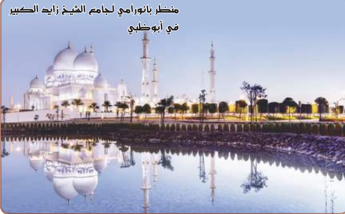
منظر بانورامي لجامع الشيخ زايد الكبير في أبوظبي