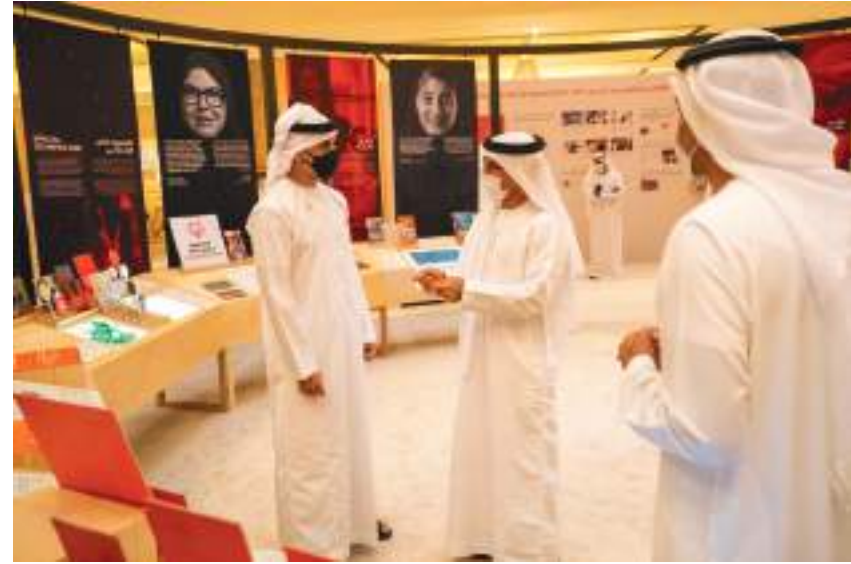
خالد بن محمد بن زايد خلال تفقده المعرض