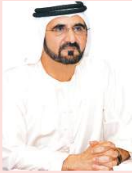
بمرسوم أصدره محمد بن راشد ..

الله" وصاحب السمو الشيخ محمد بن زايد آل نهيان ولي عهد أبوظبي نائب القائد الأعلى للقوات المسلحة برفقة تهنئة مماثلتين إلى الرئيس ماريو عبده بينت.