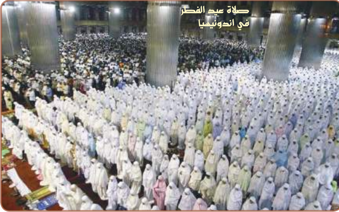
صلاة عيد الفطر في اندونيميا

يومية .. سياسية .. مستقلة أسسها راشد بن عويضة سنة ١٩٧٣م