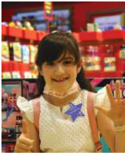
مساهمتها في تحقيق أمنيات 4 أطفال، مؤكدة أن أرض الإمارات، أرض زايد