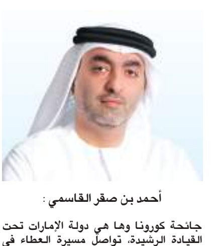
أحمد بن صقر القاسمي :

جانحة كورونا وما هي دولة الإمارات تحت القيادة الرشيدة، تواصل مسيرة العطاء في شتى الظروف لتمتد أياها البيضاء إلى القاصي والداني من خلال مبادرات الخير داخل الدولة وأرسالها لمساعدات إنسانية للدول الأخرى للتخفيف من معاناة شعوبها في مواجهة كوفيد-١٩، لتنتقل رسالة للعالم أجمع مفادها أن الإمارات في رمز العطاء والتسامح دون تمييز وستستمر في مسيرة العطاء لإعلاء القيم الإنسانية القائمة على مد يد العون والمساعدة لشعوب العالم كافة.