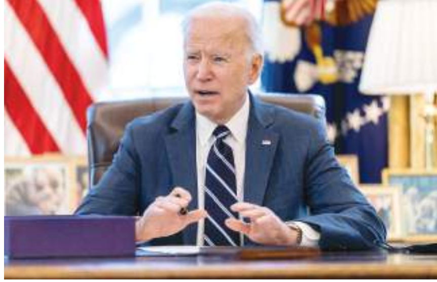
واشنطن/ القاهرة (د ب أ)-

تركز الولايات المتحدة جهودها في الوقت الحالي على الانسحاب من أفغانستان وإحياء اتفاقية خطة العمل الشاملة المشتركة مع إيران، وينطوي ذلك على آثار جانبية ضارة. ويرى الخبير الاستراتيجي أنتوني كوردسمان أن أحد هذه الآثار الجانبية هو أنه يبدو أن علاقات الولايات المتحدة مع العراق تحظى باهتمام عابر في أفضل الأحوال، وفي واقع الأمر، قد تكون علاقات الولايات المتحدة مع العراق، وتطويرها كدولة مستقرة آمنة، والتأكد من أنها يمكن أن تصبح مستقلة عن النفوذ الإيراني، أهم بكثير من الانسحاب من أفغانستان وإحياء خطة العمل الشاملة المشتركة، المعروفة بالاتفاق النووي الإيراني. وقال كوردسمان الذي يترأس كرسي أرليه بورك في الشؤون الاستراتيجية بمركز الدراسات الاستراتيجية والدولية في تقرير مطول نشره المركز إنه من المهم مثل التعاملات مع إيران وغيرها من القضايا ذات العلاقة بالاستقرار وعدم الاستقرار في منطقة الشرق الأوسط وشمال أفريقيا، الحفاظ على العلاقات مع العراق، ودعمها لتصبح دولة مستقرة، وتمثل عنصر توازن بالنسبة لإيران، وقد يمثل الحد من توتراتها الداخلية العميقة، وتهديد التطرف الدائم، التحديات الاستراتيجية المباشرة الأكثر أهمية لأمريكا في المنطقة. ويؤكد كوردسمان أن للولايات المتحدة أهدافاً استراتيجية كثيرة في منطقة الشرق الأوسط وشمال أفريقيا، لكن إقامة علاقات استراتيجية ناجحة مع العراق، تعد الآن إحدى أهم أولويات