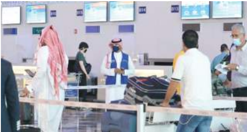
وبلغ إجمالي الحالات النشطة ٩٨٢٦ حالة، منها ١٣٣٥ حالة حرجة.

يشهد المنحى الوبائي لإصابات كورونا في السعودية مرحلة تذبذب مسجلاً ١٠٥٦ إصابة خلال الـ ٢٤ ساعة الماضية، بعد أن سجل خلال اليومين الماضيين ١٠٢٦ حالة و ١٠٦٢ حالة على التوالي. وأعلنت وزارة الصحة السعودية في بيان لها، يوم الجمعة، ارتفاع إجمالي الإصابات بفيروس "كورونا" المستجد، المسبب لمرض (كوفيد-١٩) في المملكة إلى ٤١٧ ألفاً و٣٦٣ حالة مؤكدة، بزيادة ١٠٥٦ إصابة عن المسجلة أمس والتي بلغت ١٠٢٦ حالة. وتم تسجيل ١٠٧١ حالة تعاف جديدة، لترتفع الحالات الإجمالية للتعافي إلى ٤٠٠ ألفاً و٥٨٠ حالة، (٩٦٪ من إجمالي الإصابات المسجلة). كما أعلنت الوزارة تسجيل ١١ حالة وفاة جديدة، ليصل عدد الوفيات الكلي إلى ٦٩٥٧ حالة وفاة.