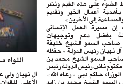
اللواء محمد أحمد المري

طوبى لثراه في تأسيس مسيرة العطاء الإنساني، الذي جعل لنا في مسيرته غير المسبوقة في العطاء إرثاً إنسانياً ونهج حياة نتعلم منه ترسيخ العمل الإنساني في الإمارات وخارجها، وتسليط الضوء على هذه القيم ونشر الوعي بأهمية أعمال الخير وتقديم العون والمساعدة إلى الآخرين». وأضاف إن مسيرة العمل الإنساني متواصلة بفضل دعم وتوجيهات ورعاية صاحب السمو الشيخ خليفة بن زايد آل نهيان رئيس الدولة "حفظه الله" وصاحب السمو الشيخ محمد بن راشد آل مكتوم نائب رئيس الدولة رئيس مجلس الوزراء حاكم دبي "رعاه الله" وصاحب السمو الشيخ محمد بن زايد