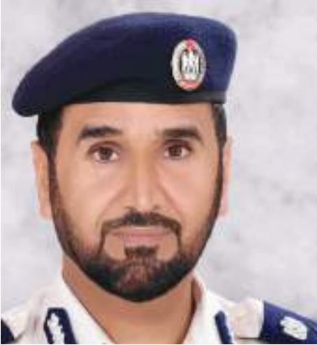
التي تم أبايها بالخير والعطاء والإنسانية لشعوب العالم كافة . من جانبه أكد سعادة

اللواء مكتوم علي الشريف مدير عام شرطة أبوظبي أن يوم زايد للعمل الإنساني الذي يصادف التاسع عشر من شهر رمضان من كل عام يرسخ قيم الخير في إمارات الخير ووطن العطاء . وقال إن التاريخ سيقف عند سيرة القائد المؤسس المغفور له الشيخ زايد بن سلطان آل نهيان "طيب الله ثراه" الذي العبرة والعظة والقودة من قائد أحب الناس وأحبوه ومنح الوطن وشعبه وأمتة الكثير فقد كان رحمه الله مدرسة حقيقية للعطاء والخير والتسامح تعلمنا منها العمل من أجل خير الإنسان والإنسانية. وأوضح أن الاحتفالية بهذه المناسبة العزيزة على قلوبنا جميعا تجسد قيم زايد الإنسانية الباقية في نفوسنا لتصبح مناهج عمل وقوافل خير وعطاء تواصل بها نهج زايد الخير الذي امتدت أياديه بالخير والعطاء والرفقة لشعوب العالم أجمع حتى أصبحت دولة الإمارات العربية المتحدة عنوانا للمحبة والتسامح والعطاء الإنساني من أجل الانسان أينما كان .