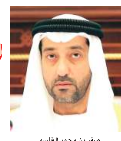
صقر بن محمد القاسمي

إنفاق ١٠٤ ملايين درهم خلال سنة ٢٠١٠ و ١٢٨,٦ مليون درهم خلال سنة ٢٠١١ فيما ارتفعت حصيلة المشاريع المنفذة خلال العام الماضي لتصل إلى ٢٦٦ مليون درهم. وقال الشيخ صقر القاسمي إن مشاريع الجمعية تنقسم إلى داخلية وخارجية وفي الحالتين تعمل الجمعية على تنفيذها ومتابعتها والإشراف عليها وجميعها تصب في جوهر العمل الإنساني والخيري ومن بين المشاريع الداخلية على سبيل المثال المساعدات الشهرية وحملة ومشروع الحج والعمرة والكفالات والأتام وتفريغ كرية وغيرها أما المشاريع الخارجية فمن بينها التعليم والعلاج والصحة وبناء المساجد وحفر الآبار وحملة رمضان وإفطار صائم خارج الدولة وتوزيع كسوة العيد وزكاة الفطر وقرى الشارقة الخيرية التي تهدف إلى إيواء الأسر الفقيرة وغيرها من المشاريع.