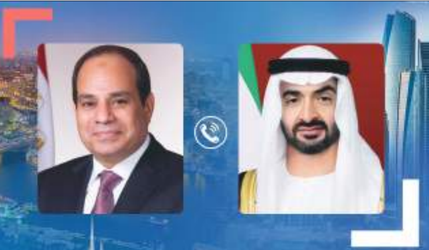
أبو ظبي-وام: أجرى صاحب السمو الشيخ محمد بن زايد آل نهيان ولي عهد أبوظبي نائب القائد الأعلى للقوات المسلحة اتصالا هاتفيا مع أخيه فخامة عبدالفتاح السيسي رئيس جمهورية مصر العربية الشقيقة، رحب خلاله بوقف إطلاق النار في غزة، وعبر سموه عن دعم دولة الإمارات للجهود المصرية الرامية لتحقيق الأمن والاستقرار في المنطقة. وأثنى سموه على الجهود المصرية التي أدت إلى وقف إطلاق النار في القطاع والدور الإنساني الهام الذي قام به فخامة الرئيس السيسي للتهنئة وحقق دماء المدنيين الأبرياء. «طالع ص ٢»