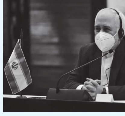
طهران - (د ب أ):

استبعدت الخارجية الإيرانية أمس الاثنين أن تكون جولة المفاوضات النووية، التي تستضيفها فيينا حالياً، هي الأخيرة، أو أن تسفر عن اتفاق لإعادة إحياء الاتفاق النووي. ونقلت وكالة أنباء الجمهورية الإسلامية الإيرانية (إرنا) عن المتحدث باسم الخارجية سعيد خطيب زاده القول إنه "لا تزال هناك بعض التفاصيل الفنية والقانونية والتنفيذية وما إلى ذلك" معتبراً أن هذه التفاصيل "لا تقل أهمية عن القضايا الرئيسية". وشدد على أنه "من الضروري أن تقدم الولايات المتحدة الضمانات اللازمة لعدم تكرار ما حدث من تصرفات في عهد الرئيس السابق دونالد ترامب". وأكد أن طريق المفاوضات ليس مسدوداً وأن المحادثات ماضية إلى الأمام في ظل جدية جميع الأطراف. وقال: "من المستبعد أن تكون هذه الجولة من محادثات فيينا هي الجولة الأخيرة، وسيتعين على الولايات المتحدة أن تتخذ قراراتها". وانطلقت يوم السبت الجولة السادسة من المفاوضات الرامية لإعادة إحياء الاتفاق الذي كان تم التوصل إليه عام 2015 وانسحبت الإدارة الأمريكية السابقة برئاسة ترامب عام 2018 منه بصورة أحادية. وكانت إيران تأمل في أن تسفر المفاوضات عن إعادة إحياء الاتفاق قبل الانتخابات الرئاسية المقررة الجمعة القادمة.