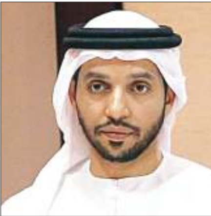
دبي- وام :

على الوضع الدولي، والرهان في الأساس سيكون على الناشئات للمستقبل، وخلال السنوات المقبلة نحن على ثقة باننا سنجني الثمار في المشاركات الدولية. وعن أجندة نشاط الموسم المحلي الداخلي وما إذا كان تم اعتمادها قال البحر: لم نضع حتى الآن أجندة الموسم القادم، لأنه لم تصلنا أي توجيهات من الهيئة العامة للرياضة بشأن المراحل السنية، ونحن نترقب حالياً قرار الهيئة العامة للرياضة لوضع الأجندة الكاملة والإعلان عنها مرة واحدة. وعلى مستوى تنظيم العمل الداخلي بالاتحاد بعد انتخاب مجلس الإدارة الجديد قال: "حالياً جاري العمل على إعادة صياغة النظام الأساسي للاتحاد وفقاً لنظام الحوكمة الجديد، الصادرة عن الهيئة العامة للرياضة واللجنة الأولمبية، ونظماً ورشة عمل تم خلالها إعداد مجموعة من المسودات للنظام الأساسي وعندنا ننهي من المناقشات، سيتم عقد اجتماع مع الهيئة العامة للرياضة واللجنة الأولمبية لقرار ما توصلنا إليه، قبل دعوة الجمعية العمومية للانعقاد خلال ٣ أشهر واعتماد النظام الأساسي الجديد". وعما إذا كانت هناك خطة لاستضافة بطولات دولية في المرحلة المقبلة قال البحر: "الإمارات سباقة في استضافة الأحداث والبطولات الكبرى، وسبق لنا أن استضفنا بطولة آسيا للرجال ٢٠١٨، و بطولة العالم للقطارات أفضل ١٦ لاعبا في العالم نسختي ٢٠١٥ و ٢٠١٧، بالإضافة إلى بطولة العالم ٢٠١٧، ونتوجه حالياً لاستضافة بطولة العالم ٢٠٢٢ لكرة الطاولة التي ستشارك فيها ١٢٨ دولة، وسوف نبحت ذلك مع الاتحاد الدولي على هامش بطولة العالم في هيوستين الأمريكية نوفمبر المقبل.