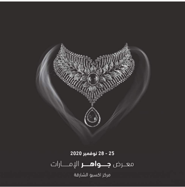
28 - 25 نوفمبر 2020 معرض جواهر الإمارات مركز إكسبو الشارقة

كواحد من أهم الأحداث التي أضيفت على أجندة الفعاليات التي ينظمها ويستضيفها المركز من خلال النجاح الذي حققه في تحفيز تجارة الذهب والفضة والمجوهرات ودعم الصناعات المحلية واستقطابه آلاف الزوار الذي قدم لهم فرصة مثالية لاقتناء العديد من المشغولات الذهبية والمجوهرات العصرية والتراثية وأحدث المصوغات وصيحات الموضة. وأشار إلى أن إكسبو الشارقة أصبح منصة رئيسية لتجارة الذهب والمجوهرات والساعات في منطقة الشرق الأوسط ومقصداً لأهم العلامات التجارية الشهيرة والتجار والمصممين والحرفيين الذين يتسابقون لتعزيز حضورهم في أسواق المنطقة خاصة في