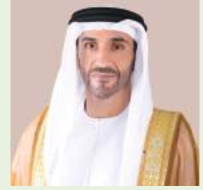
أبو ظبي- وام :

أصدر سمو الشيخ نهيان بن زايد آل نهيان رئيس مجلس أبوظبي الرياضي، قراراً بإعادة تشكيل مجلس إدارة أكاديمية فاطمة بنت مبارك للرياضة النسائية، برئاسة الشبيخة فاطمة بنت هزاع بن زايد آل نهيان. ويضم المجلس في عضويته كلا من الدكتورة أمينات محمد الهاجري نائبا للرئيس، ونورة خليفة السويدي، وناعمة عبدالرحمن المنصوري، ومريم عيد المهيري، وأمل عبدالقادر العفريقي، وطلال مصطفى الهاشمي، وشمسة سيف الهنائي، وسيف عمر ثابت. وتمتد فترة المجلس الجديد لثلاث سنوات من تاريخ صدور القرار.