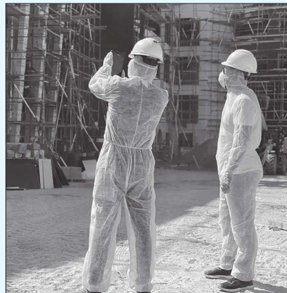
أبوظبي - وام:

نظمت بلدية مدينة أبوظبي، التابعة لدائرة البلديات والنقل، ورشة توعوية عن بعد للتعريف بمتطلبات نظام السلامة والصحة المهنية كإكانات قطاع البناء والإنشاء في إمارة أبوظبي. وتناولت الورشة العديد من المحاور، حيث دارت نقاشات حول الهيكل الإداري للإطار العام لنظام إمارة أبوظبي للسلامة والصحة المهنية، وأدوار ومسؤوليات البلدية تجاهها، وكذلك أدوار وواجبات الجهات الأخرى ذات الصلة، بالإضافة إلى التعريف بنظام الأداء الإكتروني لنظام إمارة أبوظبي للسلامة والصحة المهنية، كما تم في نهاية الورشة الإجابة على العديد من أسئلة واستفسارات الكيانات المشاركة.