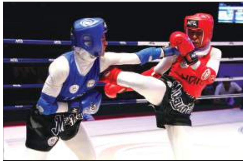
رئيس الاتحاد الإماراتي والعربي للمواي تاي والكيك بوكسينج نائب المهمة، التي تمثل نقلة نوعية هائلة