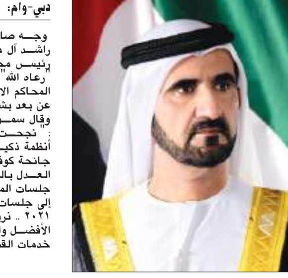
دبي - وام:

وجه صاحب السمو الشيخ محمد بن راشد آل مكتوم نائب رئيس الدولة رئيس مجلس الوزراء حاكم دبي رعاه الله ، بتحويل ٨٠٪ من جلسات المحاكم الاتحادية إلى جلسات تقاض عن بعد بشكل دائم، قبل نهاية ٢٠٢١، وقال سموه في تغريدة عبر " تويتتر " : نجحت دولة الإمارات في تبني أنظمة ذكية للتقاضي عن بعد خلال جائحة كوفيد ١٩ .. وجهنا اليوم وزارة العدل بالعمل على تحويل ٨٠٪ من جلسات المحاكم الاتحادية بشكل دائم إلى جلسات تقاض عن بعد قبل نهاية ٢٠٢١ .. نريد أن تكون دولة الإمارات الأفضل والأعدل والأسرع عالميا في خدمات القضاء .