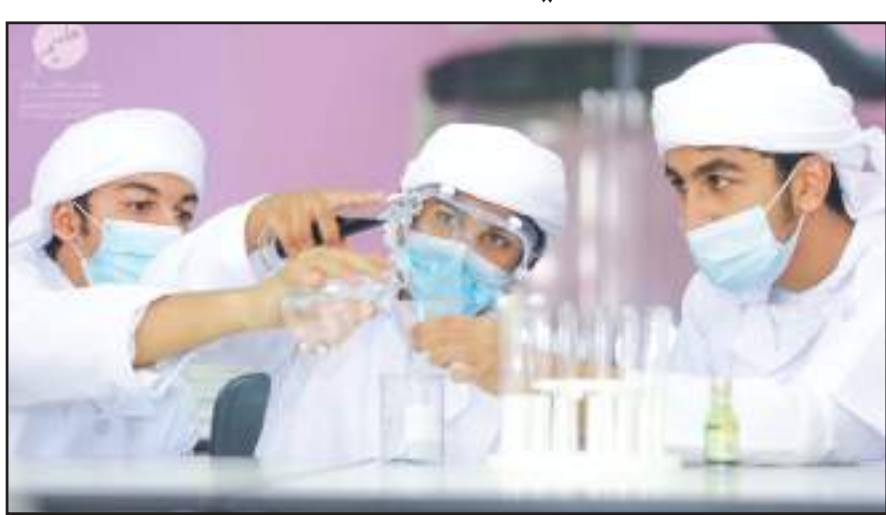
دبي - وام:

الاحترازية والوقائية، إذ سيتم اتخاذ كافة التدابير اللازمة وتطبيق أعلى المعايير بما يراعي سلامة الطلبة وكوادر الميدان التربوي من معلمين وإداريين. ولفقت المؤسسة إلى أنه سيتم وضع بروتوكول خاص بالعودة إلى المدارس بالتعاون مع وزارة التربية والتعليم والهيئة الوطنية لإدارة الطوارئ والأزمات والكوارث