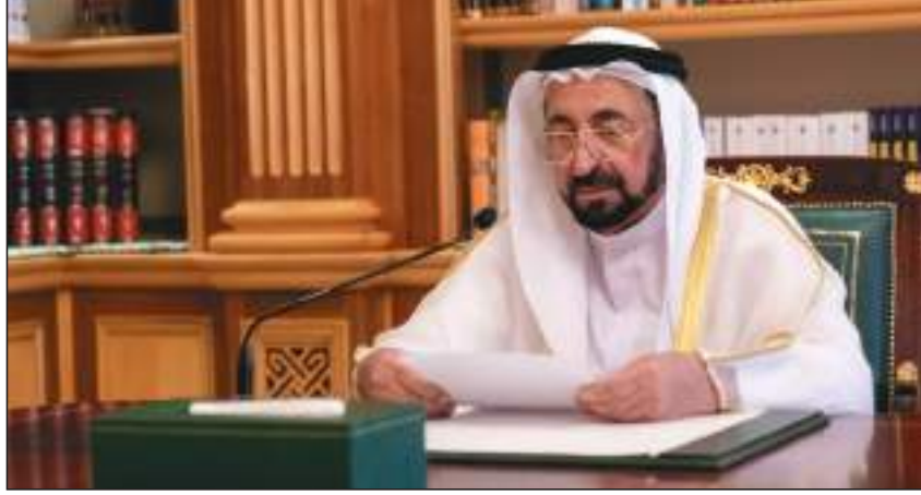
الشارقة - وام:

أكد صاحب السمو الشيخ الدكتور سلطان بن محمد القاسمي عضو المجلس الأعلى حاكم الشارقة التزام إمارة الشارقة بدعم اللاجئين ومد يد العون لهم عبر برامج مستدامة، وذلك بما ينسجم مع مشروعاتها الثقافي والحضاري، مشيراً إلى أهمية المؤسسات العاملة في المجال الإنساني، كونها استطاعت أن توحد الجهود والطاقات والقدرات وتحولها إلى مشاريع مستدامة غيرت حياة مئات الآلاف بل و الملايين من اللاجئين والمحتاجين حول العالم. جاء ذلك خلال كلمة سموه التي خاطب فيها المجتمع الدولي وقادة العمل الإنساني في حفل الإعلان عن الفائز بجائزة الشارقة الدولية لمناصرة ودعم اللاجئين بدورتها الخامسة