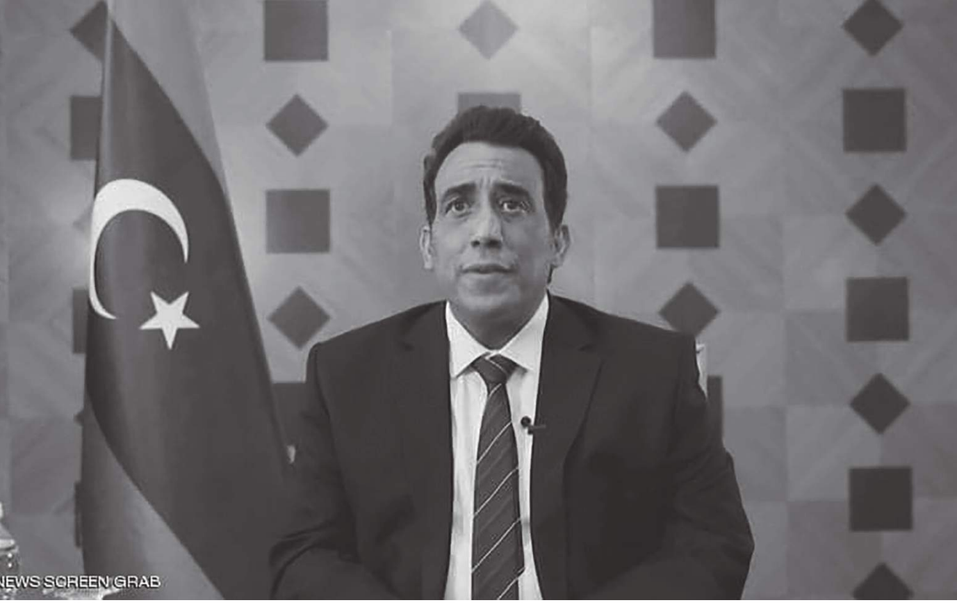
NEWS SCREEN GRAB

وإقال الناطق باسم القيادة العامة اللواء أحمد المسماري، في بيان نشره عبر صفحته على موقع التواصل الاجتماعي "فيسبوك"، إن هذه العملية تأتي رداً على تصعيد العصابات التكفيرية للعمليات الإرهابية في الجنوب الغربي، واستهدافها بسيارة مفخخة لموقع أمني وعسكري، وذلك بعد رصد تحركاتهم من