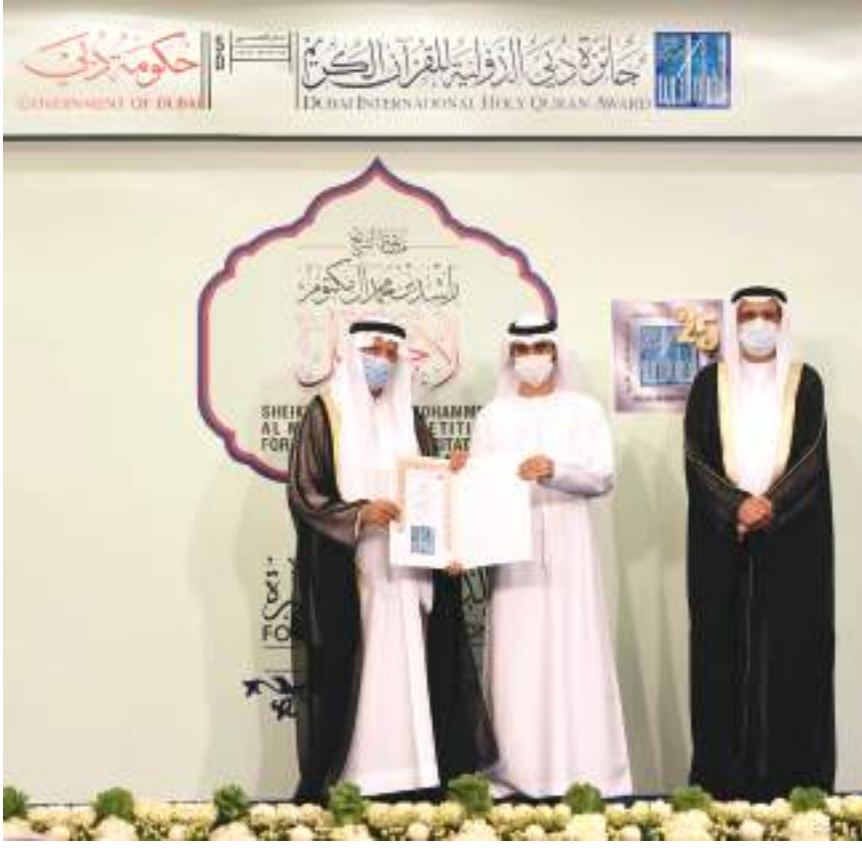
خلال حفل التكريم

ونوه ان المسابقة نقلت عبر موقع اليوتيوب إلى العالم كما تم تسجيلها تلفزيونيا لتبث على عدة قنوات في الايام القادمة ومنها قناة نور دبي الفضائية ، وتقدم بالتهنئة لجميع الفائزين والمشاركين متمنيا لهم التوفيق والنجاح ،كما تقد بالشكر بالشكر والدعاء لأعضاء لجان التحكيم في التصفيات الميدنية والنهائية وللقائمين على الامور التنظيمية والفنية والاعلامية في لجان الجائزة المختلفة ولجميع المشاركين في هذه المسابقة واولياء امورهم ومتابعي هذه المسابقة .