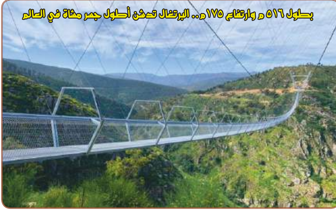
بطول ٥١٦ م وارتفاع ١٧٥ م.. البرتغال تدشن أطول جسر مائة في العالم

يومية .. سياسية .. مستقلة أسسها راشد بن عويضة سنة ١٩٧٣م