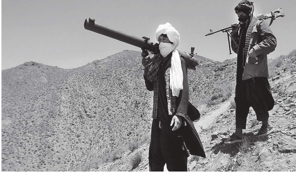
كابول