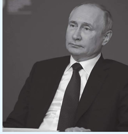
موسكو - (د ب أ) :

ذكر الرئيس الروسي، فلاديمير بوتين أن بلاده لا ترغب في وقف استخدام الدولار، فيما اتهم الولايات المتحدة باستغلال هيمنة العملة لفرض عقوبات. ونقلت وكالة بلومبرج للأنباء عن بوتين قوله في ساعة متأخرة ليلة أمس الجمعة، بالتوقيت المحلي، في سان بطرسبرج في مؤتمر عبر تقنية الفيديو كونفرانس مع ممثلين من منظمات إعلامية دولية إن روسيا يتعين أن تتبنى وسائل دفع أخرى نظرا لأن الولايات المتحدة تستخدم عملتها الوطنية لفرض أنواع مختلفة من العقوبات . وأضاف نحن لا نفعل ذلك عمدا، إننا مضطرون للقيام به . وتابع بوتين أن التسويات بالعملات الوطنية مع دول أخرى في مجالات، مثل مبيعات الدفاع وتقليص احتياطات النقد الأجنبي بالدولار، سيضر في نهاية المطاف بالولايات المتحدة، حيث تتراجع هيمنة الدولار. يشار إلى أن الولايات المتحدة تفرض عقوبات على روسيا على خلفية عدة قضايا منها ضم شبه جزيرة القرم من أوكرانيا وسجن المعارض الروسي اليكسي نافالني وخط نورد ستريم2 وتدخلها في الانتخابات الرئاسية الأمريكية عام 2020.