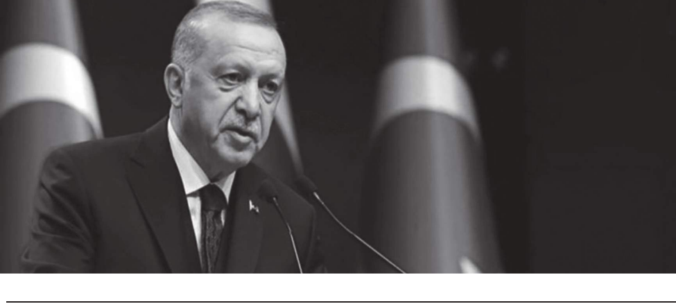
أنقرة - (د ب أ) :

أعلن الرئيس التركي رجب طيب أردوغان، أول أمس الجمعة، اكتشاف 135 مليار متر مكعب إضافي من الغاز الطبيعي قبالة سواحل بلاده في البحر الأسود. وأوضح أردوغان أنه مع الاكتشاف الجديد، بلغ إجمالي احتياطي الغاز المكتشف بالمنطقة 540 مليار متر مكعب، وفقا لوكالة أنباء الأناضول. وأكد أن أنشطة التنقيب في محيط موقع "أماسرا 1" مستمرة، ومنتظر لورود أخبار سارة جديدة من هذه المنطقة.