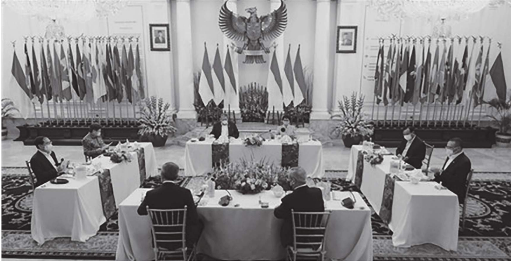
بكين - (د ب أ) :

سيجتمع وزراء خارجية من الصين ورابطة دول جنوب شرق آسيا (آسيان) الأسبوع المقبل وسيبحثون قضايا، بما فيها التعاون للقضاء على جائحة فيروس كورونا. وقالت وكالة "بلومبرج" للأنباء أمس السبت أن الاجتماع سيعقد في السابع من حزيران/يونيو في منطقة شونجتشينج جنوب غرب الصين، في إطار الذكرى الـ 30 لعلاقات الحوار بين آسيا والصين، طبقا لما ذكرته وزارة الشؤون الخارجية الماليزية في بيان أمس السبت. وأضافت الوزارة أنه إلى جانب تبادل الآراء والبحث عن سبل للتعاون للتعامل مع مرض كوفيد-19، سيبحث الوزراء أيضا قضايا إقليمية ودولية ذات اهتمام مشترك.