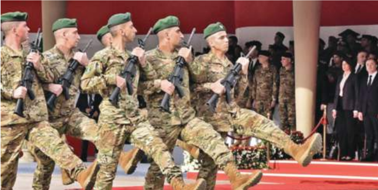
بيروت - وكالات

نفى الجيش اللبناني ما تردد حول لقاء بين قاضي التحقيق في جريمة انفجار ميناء بيروت القاضي طارق بطار وقائد الجيش العماد جوزاف عون في مقر الجيش بالبرزة. وأكد الجيش اللبناني أن المؤسسة العسكرية جاهزة في أي وقت للتعاون مع القضاء وتزويده بكل ما يطلبه من معلومات ومعطيات تساعد في التحقيق وكشف الحقيقة. وجدد الجيش اللبناني دعوته إلى وجوب توخي الدقة في نشر أخبار تتعلق بالمؤسسة العسكرية والعودة إلى المعنيين للاستفسار حول أي خبر قبل نشره، خصوصا أن جميع أخبار المؤسسة بما فيها استقبالات قائد الجيش تجمع عبر بيانات تصدر عن الجيش. عادت التحقيقات في جريمة انفجار ميناء بيروت إلى الواجهة بعدما اشترط مجلس النواب اللبناني أمس إفادته بأدلة الاتهام الواردة في التحقيق الخاص بانفجار ميناء بيروت وجميع المستندات والأوراق للتأكد من حيثيات الملاحقة، وذلك كشرط، وفقا للقانون، لنظر طلب رفع الحصانة وملاحقة الوزراء السابقين أعضاء المجلس نهاد المشنوق وعلي حسن خليل وغازي زعيتر من قبل قاضي التحقيق في حادث انفجار ميناء بيروت طارق بطار، وهو ما اعتبره البعض مراوغة في تحقيق العدالة. وكان قاضي التحقيق في قضية انفجار ميناء بيروت القاضي طارق بطار قد وجه خطابا إلى مجلس النواب اللبناني بواسطة النيابة العامة، طلب فيه رفع الحصانة النيابية عن وزير المالية السابق النائب علي حسن خليل، ووزير الأشغال الأسبق النائب غازي زعيتر، ووزير الداخلية الأسبق والنائب نهاد المشنوق، تمهيدا للدعاء عليهم وملاحقتهم في القضية. كما طلب القاضي بطار استجواب رئيس حكومة تصريف الأعمال اللبنانية حسان دياب كمدعى عليه (كمتهم) في القضية بالإضافة إلى