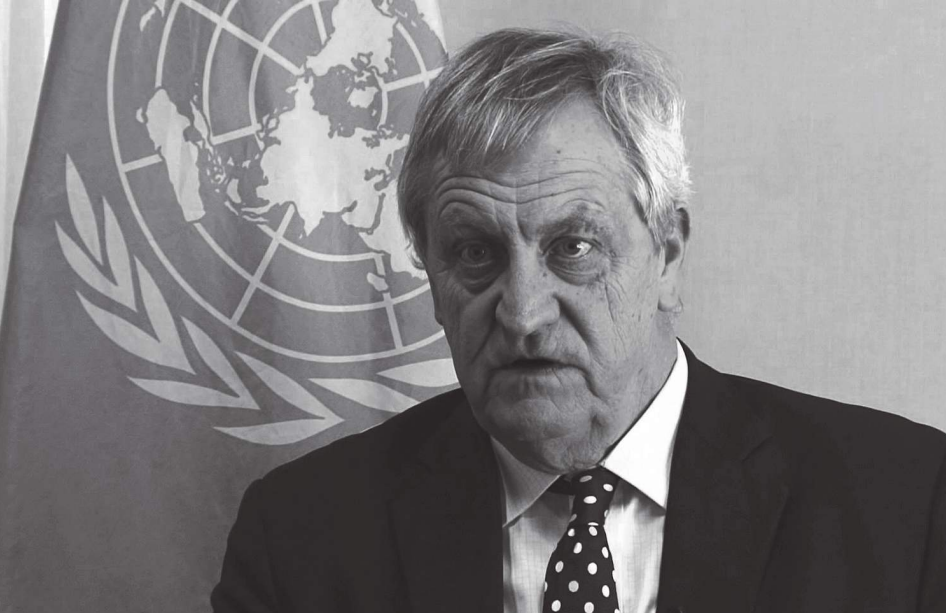
جنيف - وكالات

تأمين السلام المستدام اللازم لتمكين الانتعاش الكامل والتنمية، مشيرا إلى أن شعبي جنوب السودان كافح معاناة كبيرة لتأمين حياة أفضل لنفسه وللأجيال القادمة. وذكر بيان البعثة الأممية أنه تم إجران تقدم كبير منذ توقيع اتفاقية عام ٢٠١٨ للسلام، بما في ذلك تشكيل حكومة انتقالية، وإعادة تشكيل الهيئة التشريعية الوطنية، والدعوة إلى عملية صياغة الدستور، مشيرا إلى أن جنوب السودان لا يزال تواجه عقبات تحول دون تحقيق السلام المستدام. بدوره، أكد عرفات جمال ممثل