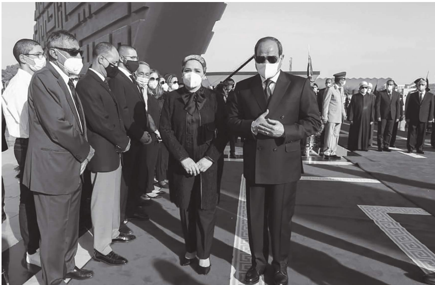
القاهرة