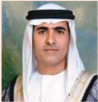
سالم بن سلطان بن صقر القاسمي الشارقة-والم:

أشاد المهندس الشيخ سالم بن سلطان بن صقر القاسمي عضو المجلس التنفيذي رئيس دائرة الطيران المدني برأس الخيمة بالرؤية الحكيمة للقيادة الرشيدة التي جعلت دولة الإمارات تتبوأ المراكز الأولى عالمياً في ترسيخ منظومة مستدامة للخير والعطاء ومد يد العون لشعوب العالم المحتاجة.