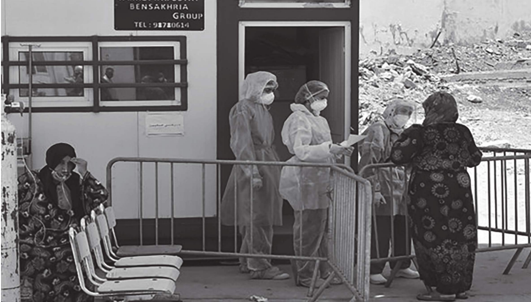
بغداد (د ب أ) -

أعلنت وزارة الصحة والبيئة في العراق يوم السبت أنه تم تسجيل ٣٩ حالة وفاة جديدة خلال الساعات الماضية جراء الإصابة بفيروس كورونا المستجد المسبب لمرض (كوفيد-١٩)، ليرتفع إجمالي حالات الإصابة في البلاد إلى ١٧ ألفا و٥١٥ حالة وفاة. وقالت الوزارة في تقريرها اليومي إنه تم رصد ٦٨٢١ إصابة جديدة بفيروس كورونا المستجد، ليرتفع العدد الكلي للإصابات في العراق إلى مليون و٤٢١ ألفا و٧٤٦ إصابة. وأشار التقرير إلى أنه تم تسجيل ٦١٠١ حالة شفأة جديدة من المصابين بالفيروس، ليرتفع العدد