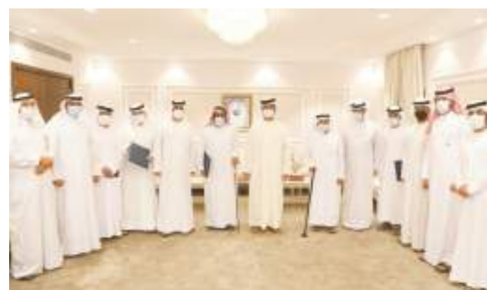
خلال تكريم الشعراء ومقدم الأمسية

والسحر عن جفنه وسواجيه إيهون وسحر اجفانه اعظم ترحد غيم الهم بييليه وحد أيزيدك هم عاهم يا مالك قلبي يا واليه يا اللي وليت اضعيف ارحم كل ثوب من يجدم اتخليه وثوب الهوى احسن يوم يجدم برح المحبة كم أداويه وكلما خلقت ادوا انصع دم كل هم صعب إيهون تاليه وهم المحبة ادميم يعظم ثم اختتم الأمسية الشعرية شاكرًا ومثمنا ومقدرا دور مجلس الحيرة الأدبي في دفع ودعم الشعر الشعبي والتراث إلى أفاق الظهور والبروز . ثم قام سعادة بطي المظلوم مدير مجلس الحيرة الأدبي بتكريم الشاعرين ومقدم الأمسية شاكرًا لهما حضورهما ومشاركتهما.