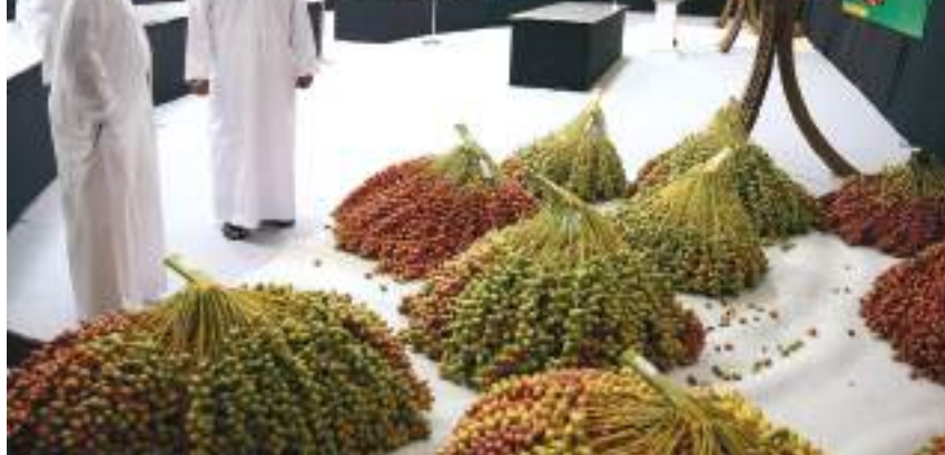
جولة اللواء فارس خلف المزروعى في أروقة المهرجانات

وأكد معاليه أن المهرجان يواصل تحقيق نجاحاته المتتالية بفضل توجيهات صاحب السمو الشيخ خليفة بن زايد آل نهيان رئيس الدولة "حفظه الله"، والدعم اللامحدود الذي يقدمه صاحب السمو الشيخ محمد بن زايد آل نهيان ولي عهد أبوظبي نائب القائد الأعلى للقوات المسلحة، لكافة المهرجانات والفعاليات التراثية، والمتابعة الحثيثة لسمو الشيخ حمدان بن زايد آل نهيان ممثل الحاكم في منطقة الظفرة، ورعاية سمو الشيخ منصور بن زايد آل نهيان نائب رئيس مجلس الوزراء وزير شؤون الرئاسة، للمهرجان والتي امتدت