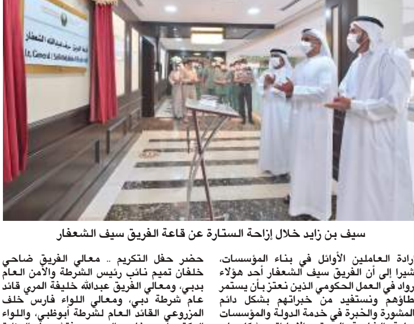
سيف بن زايد خلال إزاحة الستارة عن قاعة الفريق سيف الشعفار

وأضاف سموه " أن الوزارات الحكومية والمؤسسات الوطنية اعتمدت على ركائز وقدرات