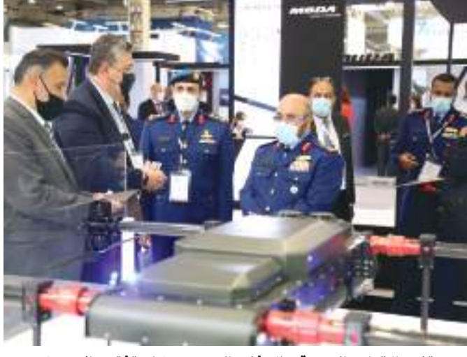
قائد القوات الجوية والدفاع الجوي خلال تفقده المعرض

قام وفد من وزارة الدفاع برئاسة سعادة اللواء الركن طيار إبراهيم ناصر محمد العلوي، قائد القوات الجوية والدفاع الجوي بزيارة المعرض الدولي للدفاع والأمن DEFEXA ٢٠٢١ في العاصمة اليونانية أثينا، والاطلاع على أحدث الأنظمة الدفاعية والأمنية التي تعرضها شركات الدفاع العالمية خلال فترة انعقاد المعرض الذي انطلق يوم الثلاثاء ويستمر حتى يوم الخميس ١٥ يوليو ٢٠٢١. وحضر الوفد فعاليات الافتتاح التي تمت تحت رعاية وزير الدفاع اليوناني معالي نيكولاس بانايوتوبولوس وبحضور سعادة سليمان حامد المزروعى سفير الدولة لدى جمهورية اليونان.