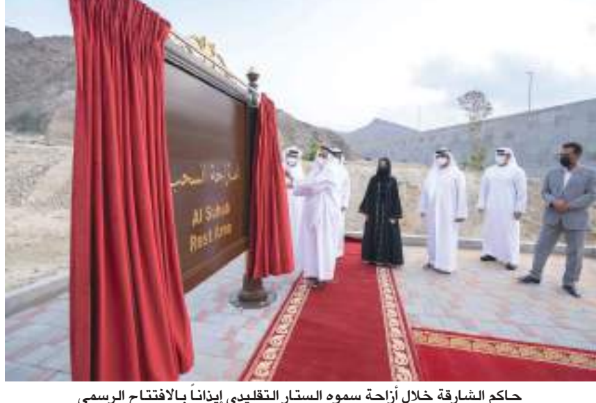
حاكم الشارقة خلال أزاحة سموه الستار التقليدي إيذاناً بالافتتاح الرسمي