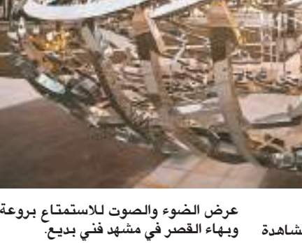
عرض الضوء والصوت للاستمتاع بروعة ولا تكتمل زيارة قصر الوطن دون مشاهدة الإسلامية والعربية التقليدية.