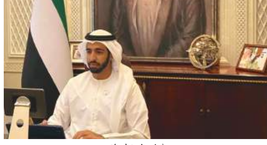
شخبوط بن نهيان

والتضامن الدوليين في فترة التعافي. وقال معالي الشيخ شخبوط بن نهيان بن مبارك آل نهيان في هذا الصدد: «إن هذه الجولة تعكس العلاقات الوطيدة التي تجمع دولة الإمارات مع الدول الأفريقية، مؤكدا حرص دولة الإمارات على تعزيز التعاون مع هذه الدول وأضاف معاليه: «ركزت هذه الجولة على تطلعاتنا المشتركة لتأمين مستقبل أفضل للجميع بغية تعزيز الجهود المبذولة لضمان الرفاهية لشعبينا من خلال التعاون والتضامن والشراكة والتي تعكس العلاقات الوطيدة التي تجمع دولة الإمارات مع الدول الأفريقية». وأكد معاليه أن دولة الإمارات تقدر عاليا شراكتها مع الدول الإفريقية في جميع المجالات، كما تعبر عن اعتزازها وفخرها بمواصلة العمل من أجل عالم أفضل للأجيال المقبلة من خلال الجهود المشتركة لتحقيق التنمية والازدهار في القارة الإفريقية.