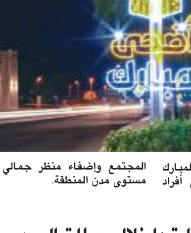
يهدف الإبتهاج بعيد الأضحية المبارك المجتمع واضفاء منظر جمالي على وادخال البهجة والسرور على أفراد مستوى مدن المنطقة.

وقد تم ابتكار وإجراء العديد من التغييرات أبرزها: برامج تحويل المساقات للتدريس بأسلوب التعليم الهجين، والأنشطة التطويرية الهنئية الأسبوعية لأعضاء هيئة التدريس، ومجتمعات الممارسة (COPS) مثل BLACKBOARDIANS، وأبطال التعلم الرقمي، مجتمع أعضاء الهيئة التدريسية، والكتب الدراسية الرقمية، ومنصة UAEUX على EDX، وأبحاث خاصة بالتعليم والتعلم (SOTL)، وغيرها من الأفكار والبرامج التي تعزز وتشجع الابتكار في التعليم والتعلم والتطوير.