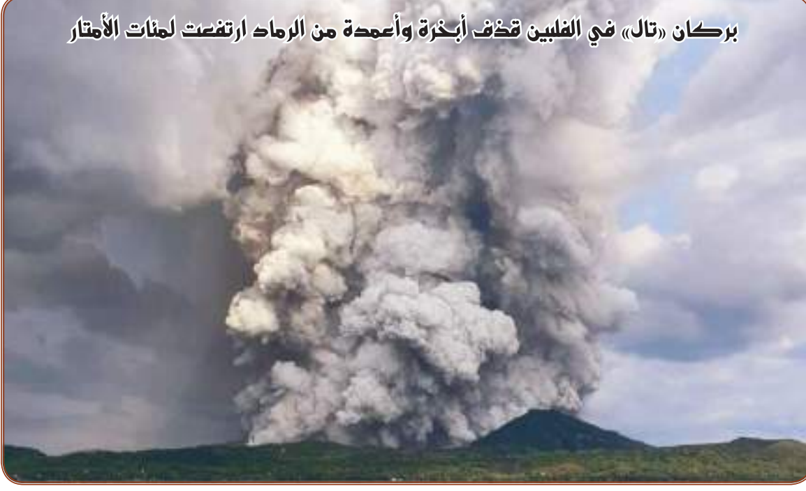
بركان «تال» في الفلبين تذف أبخرة وأعمدة من الرماد ارتفعت لسمات الأمتار

20 pages/one Dirham ٢٠ صفحة/ درهم واحد العدد ١٤٧٨٨ ٢٠٢١ يوليو ٦ الموافق ١٤٤٢ هـ