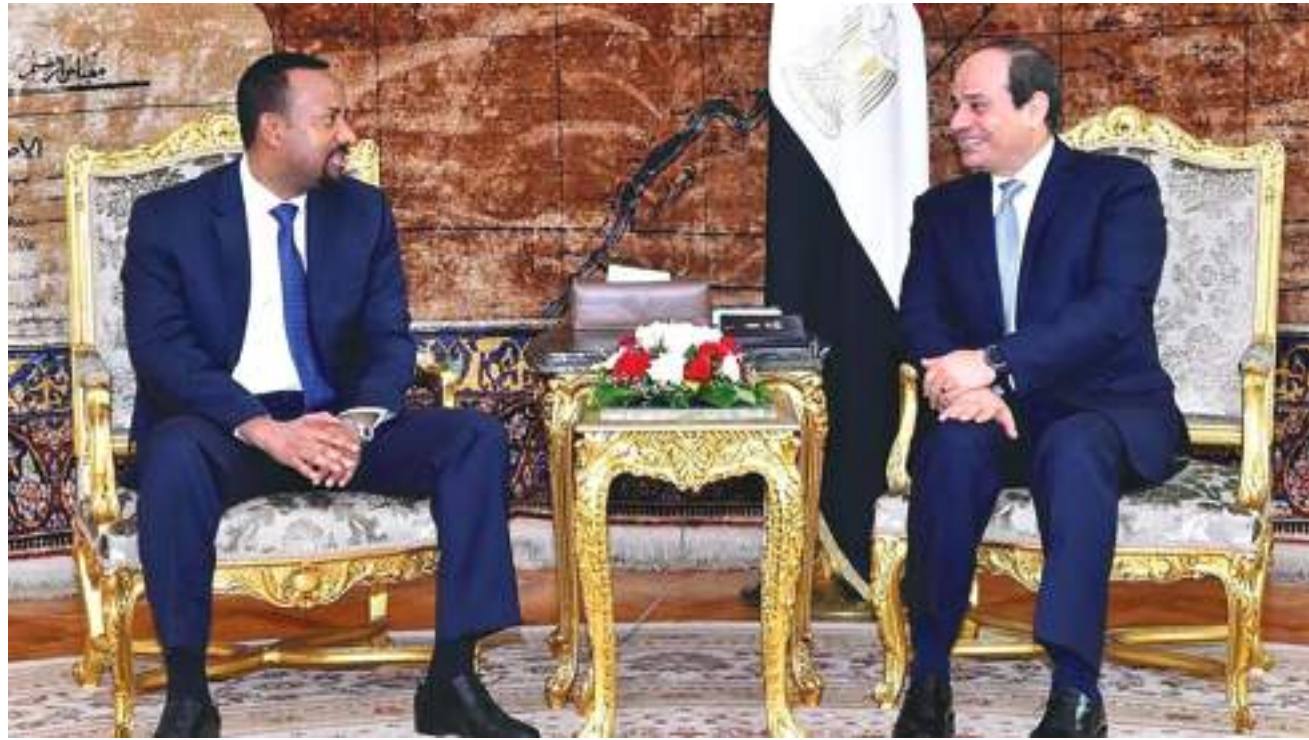
أن تدرك حقيقة أن إثيوبيا ليس لديها نية إيذاء الآخرين، بل تطمح بدلاً من ذلك إلى تنمية مشتركة بالتعاون. كما حث الدول على بذل الجهود لإيجاد حل دائم للقضية من أجل الشروع في مسار جديد للتنمية دون إضاعة الوقت.

دعا رئيس وزراء إثيوبيا أبي أحمد مختلف دول العالم إلى الاعتراف بالنية الحقيقية لبناء سد النهضة الإثيوبي الكبير. وقال رئيس الوزراء الإثيوبي خلال رده على الأسئلة التي طرحها أعضاء مجلس نواب الشعب حول مختلف القضايا الجارية في البلاد، إنه يدعو الدول إلى إدراك أن إثيوبيا ليس لديها نية لإيذاء الآخرين سوى تلبية احتياجاتها من الطاقة. وأوضح أن الشيء الوحيد الذي تريده إثيوبيا هو تلبية طلب البلاد على الكهرباء دون تشكيل تهديد على دول المصب، مشيراً إلى أن "مصلحة إثيوبيا هنا هي فقط تلبية طلب البلاد على الكهرباء وتقليل مخاوف السودان ومصر وتحقيق السلام الدائم والازدهار لمنطقتنا". وقال رئيس الوزراء إن زراعة مليارات الشتلات في إثيوبيا والسودان ومصر يمكن أن تكون سبباً للحصول على مياه أكثر مما تحصل عليه بالفعل. وأوضح أن "مبادرتنا الخضراء ستساعد على زيادة كمية الأمطار والمياه وكذلك تقليل الفاقد المائي الذي يمكن أن يضمن الأمن المائي لنا وللآخرين في المنطقة، ونريد فقط السلام والازدهار نحن على استعداد لريادة مسارات جديدة والعمل معاً". وفي هذا الصدد، قال أبي إن دول العالم يجب