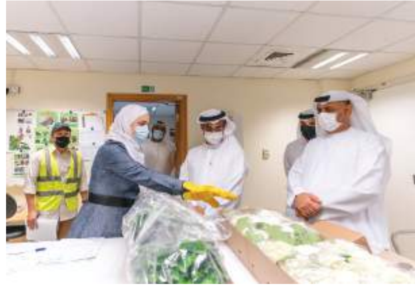
بلحيف النعيمي خلال تفقده الحجر الزراعي في مركز الزهور بمطار دبي