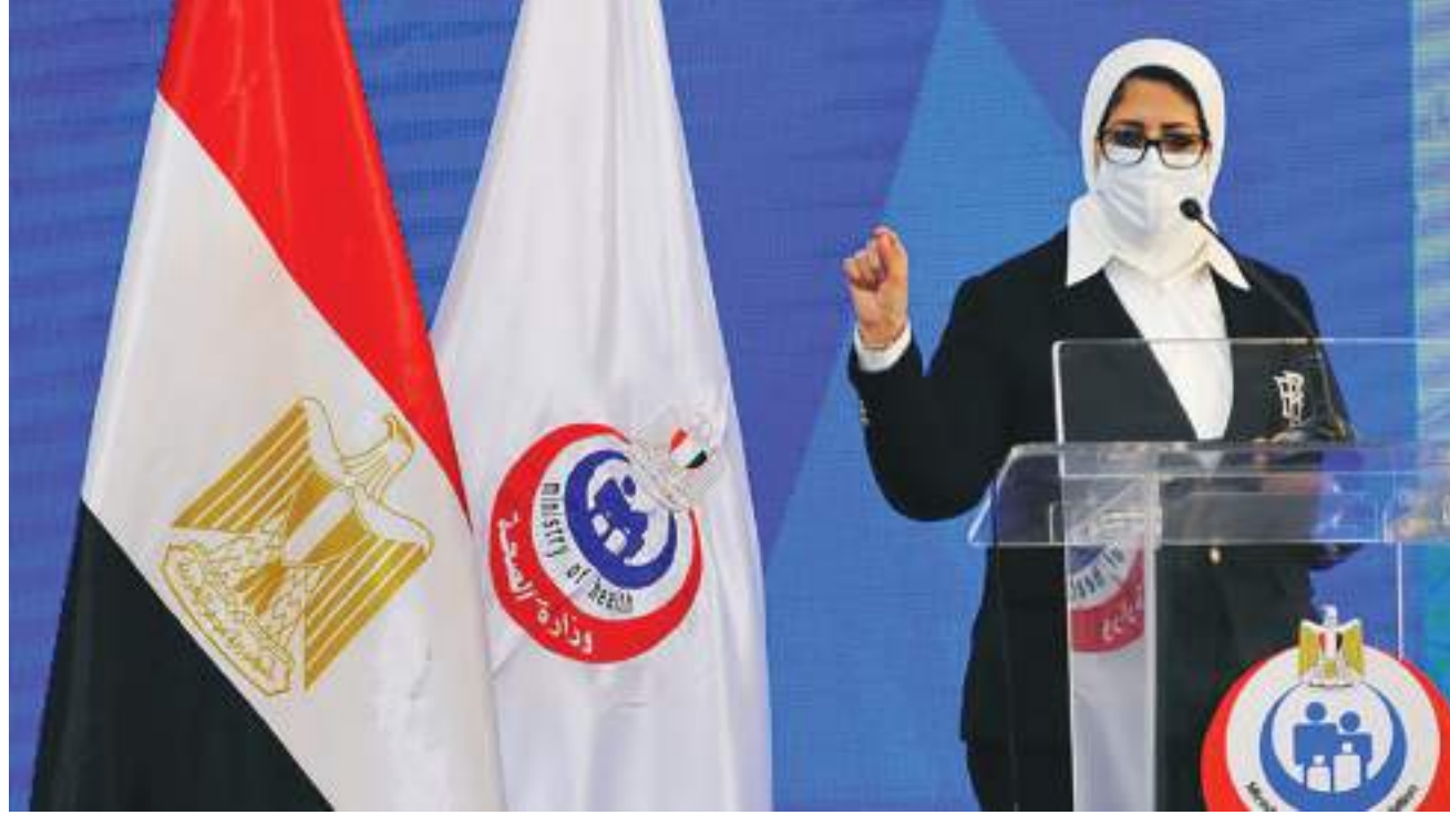
ولفتت إلى "ضرورة المداومة على غسل اليدين والحرس على التباعد الاجتماعي بمسافة لا تقل عن متر كلما أمكن" وفي إطار الاهتمام بالصحة النفسية، قالت وزارة الصحة إنه "لكن يتم تعزيز الصحة النفسية للمواطنين، لأبد من التعود على الاستيقاظ مبكراً، وكذلك النوم". موضحة "أهمية تناول وجبات صحية في أوقات منتظمة، وتخصيص وقت للقيام بالأشياء التي تحبها، وممارسة الرياضة بانتظام، والحفاظ على النظافة الشخصية". كما ناشدت "الصحة" المصرية، المواطنين،

أكدت وزارة الصحة التونسية دقة وخطورة الوضع الوبائي في تونس، بسبب ارتفاع غير مسبوق في عدد الإصابات والوفيات بفيروس كورونا. ووسط مخاوف من انهيار المنظومة الصحية، تطالب السلطات باحترام التدابير المتخذة لوقف تفشي الوباء، في ظل تراجُع في تطبيق الإجراءات. وتشكو المستشفيات التونسية نقصاً كبيراً في مادة الأكسجين وأسرة الإنعاش. من جهة أخرى أصدرت وزارة الصحة المصرية، روثنة وقائية يمكن اتباعها وفي منشور توعوي لها، أوضحت وزارة الصحة أن "هناك مجموعة من الفيتامينات التي تساعد في تقوية المناعة ضد فيروس كورونا"، وقالت: "الفيتامينات التي تساعد في تقوية المناعة ضد فيروس كورونا تتمثل في فيتامين سي، حيث يساعد في تقوية المناعة، وهو موجود في الكثير من المنتجات الطبيعية، مثل الخضار، كالفلفل الرومي، والفواكه، والجوافة، والبرتقال، واليوسفي، وشهدت الوزارة على أهمية فيتامين أ، الذي يعمل على تقوية مناعة الجسم، وهو موجود في الجزر، والقرع، والبطاطا، والطماطم، مؤكداً أهمية تقوية الجهاز المناعي لمواجهة فيروس كورونا باعتباره فيروساً تنفسياً". بالإضافة إلى ما سبق، أشارت الصحة المصرية إلى أهمية وضع الكمامات، مشددة على أنه لا بد من وضع الكمامات عند الخروج من المنزل لحماية نفسك ومن حولك من الإصابة بفيروس كورونا".