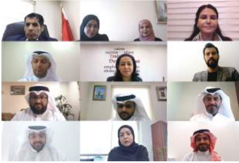
خلال اللقاء عن بعد