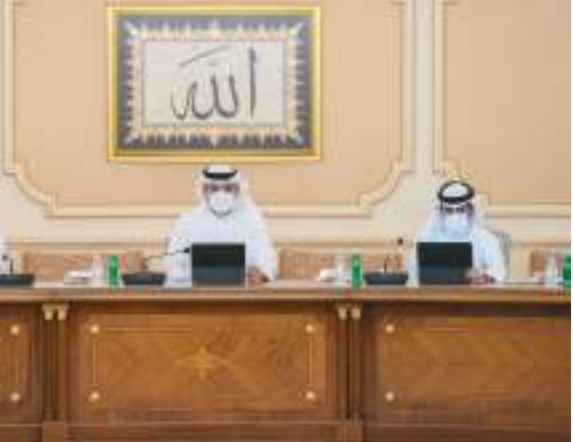
ولي عهد الشارقة خلال ترؤسه الاجتماع

وتهدف المذكرة إلى تنفيذ برامج التوعية الوقائية والتي تشمل الزيارات الميدانية للأعمال المنجزة في المنازل السكنية، والربط الالكتروني بين أنظمة الطرفين وبلديات الإمارة لتبسيط الإجراءات