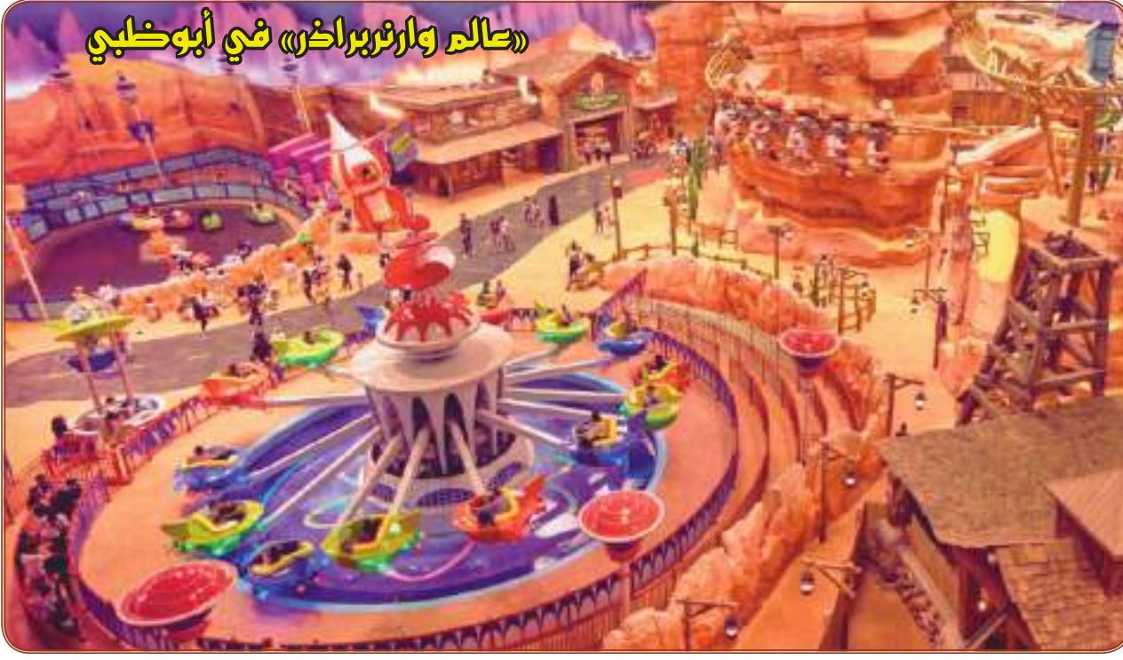
«عالم وارنر براذرز» في أبوظبي

يومية .. سياسية .. مستقلة أسسها راشد بن عويضة سنة ١٩٧٣م