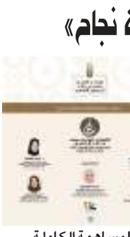
لتحقق المساهمة الكاملة.

واضافت ان الاحتفال بيوم المرأة الإماراتية هو تقديرلما تحمله من إرث تاريخي قدمت فيه للمجتمع الإماراتي عبر التاريخ من العطاء والخير حيث شاركت مسيرة الإنسان الإماراتي عبر كل بقعة مشيرة الى ان الاحتفال ليس مجرد ساعات تبادل فيها الكلمات وإنما تحققي للمرأة الإماراتية وعنا ميثاق كل طفلة ومع نجاح كل فتاة بدراستها ومع تمييز