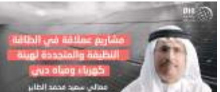
مجموع محمد بن راشد آل مكتوم الطاقة الضمنية