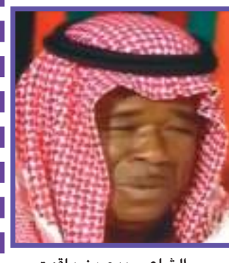
الشاعر ربيع بن ياقوت من معاصري الشاعر الخضر

من الهطال في صبح وروايح وهبت من نسايمها روايح خزاميها وقرنفلها وصنديل وقال ايضاً: سرك دفتنه يوم انا وبك ظلي فلا يدري بذلك عن كل نام وأفاك محروز لا يغتث بالك وقال ايضاً: في بحرهم مركبي مشبي والسواحل مايجاريها ابعد من الشمس لو قربي تقصير ايدي لو بمد ابها ان الشاعر راشد بن سالم راشد الخضر، يعد أحد الذين تركوا بصمة مهمة في ساحة الشعر الإماراتي.. كما اعتبر من قبل كثيرين، بمثابة بصمة متفردة سابقة لأوانها في ساح الأدب والشعر. ختاماً نقول لقد عرفت قصائده بأنها كانت تعبر عن البيئة المجتمعية والطبيعية التي كان يعيش فيها، محبسداً بذا، بشفاافية ودقة وطوال مشواره الإبداعي مقولة: إن الشاعر ابن بيئته. كما تفرد راشد الخضر بكونه كتب في الحقلين الشعريين: النبطي والفصيح.