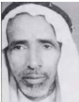
الشاعر الإماراتي راشد الخضر