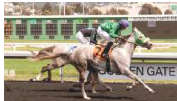
أبو ظبي - «الوحدة»:

في سبيل إنجاز مسابقاتنا الكروية. واختم قائلاً: نقدر تفاعلكم الإيجابي، وحرصكم على إظهار كرة القدم الإماراتية بالشكل الاحترافي الشامل، وتلبية متطلبات الشارع الرياضي من أجل إسعاده وتقديم مادة رياضية تليق بالطموحات. وشهدت الورشة عرض مستجدات التسويق والشؤون التجارية، سطر الضوء على تعديلات اللوائح والبنود الجديدة في لائحة التسويق والتي تستهدف جذب الجماهير، خلق أجواء مميزة في المباريات، تفعيل الدور المجتمعي للأندية وإشراك اللاعبين في ذلك، خطط ترسيخ التساو وتجربة يوم المباراة، بالاضافة إلى توفير خدمات للشعب تشمل: تأمين شبكة انترنت، نظام ترقيفي، تنفيذ مدارات وتطبيقات ذكية، إلى جانب استعراض توفير المرافق الخاصة بالمأكولات والمشروبات من خلال تزويد أكشاك البيع والباعه المتجولين بالعدد الكافي من الموظفين لتلبية احتياجات المشجعين قبل المباراة، وفي استراحة بين الشوطين وبعد المباراة، مع مراعاة تطبيق البروتوكول الصحي الخاص بجائحة كورونا وعلى صعيد مستجدات لوائح المسابقات، تقديم شرح مفصل لأبرز التعديلات، بدءاً بلائحة دوري أدنوك للمحترفين، حيث ينص البند ٢٨، من المادة (٨) الخاصة بقيود مشاركة اللاعبين في المسابقة على أنه يحق للنادي تسجيل عدد (٢٦) لاعب بحد أقصى من فئة مواطني الدولة وحملة جوازات الدولة وأبناء المواطنين على ألا يزيد عدد اللاعبين من فئة مواطني الدولة عن ٢٢ لاعبا، عسى أن يكونوا من مواليد ٢٠٠٥ وما قبل.