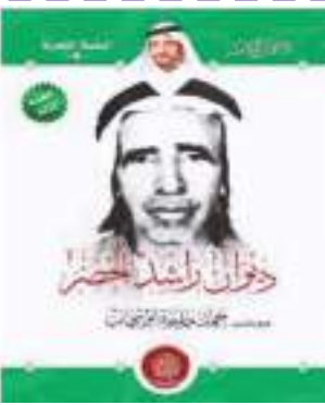
ديوان الشاعر الخضر أعده الشاعر حمد بو شهاب