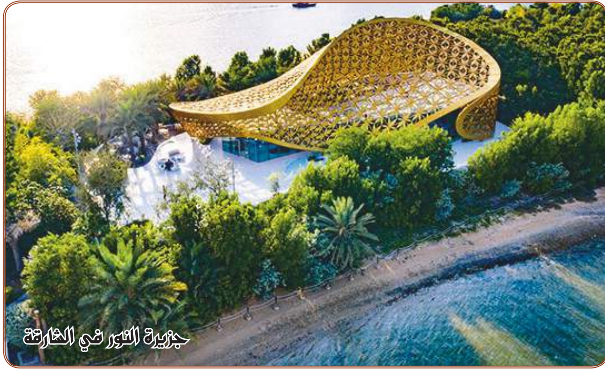
جزيرة التورثي الخارطة

يبحث مشروعون الصينيون مسودة تعديل قانون من شأنه أن يسمح لكل زوجين بإنجاب ثلاثة أطفال، وذلك في خطوة قانونية رئيسية لإلغاء الشرعية على سياسة جديدة لإنجاب ثلاثة أبناء، بحسب ما ذكرته وكالة أنباء الصين الجديدة (شينخوا). وقد تم أمس الثلاثاء، تقديم مسودة تعديل القانون المتعلقة بالسلوك وتنظيم الأسرة، إلى الدورة الثالثة للجنة الدائمة الثالثة عشرة للمجلس الوطني لنواب الشعب الصيني للمراجعة. وتلغي المسودة التدابير التقييدية ذات الصلة، بما فيها من غرامات يتم فرضها على الأزواج الذين ينتهكون القانون لإنجاب عدد أكثر مما هو مسموح به من الأطفال. كما تقترح المسودة اتخاذ تدابير داعمة لتغيير السياسة، تتضمن إقامة المزيد من مرافق الحضانات في المجتمعات السكنية والأماكن العامة وأماكن العمل. وتم سن القانون المتعلقة بالسلوك وتنظيم الأسرة في عام ٢٠١٥ وتم تنقيحه في عام ٢٠١٥، في حين تم تنفيذ سياسة الطفلين في الصين بشكل كامل.