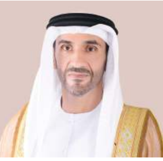
نهيان بن زايد

أكد سمو الشيخ نهيان بن زايد آل نهيان رئيس مجلس أمناء مؤسسة زايد بن سلطان آل نهيان للأعمال الخيرية والإنسانية رئيس مجلس أبوظبي الرياضي أن المرأة الإماراتية أصبحت حجر أساس في مسيرة التنمية والإنجازات بدولة الإمارات العربية المتحدة، وعنصرًا فاعلاً ورائداً في التنمية المستدامة، ونموذجاً مشرفاً في كل المحافل المحلية والإقليمية والدولية. وقال سموه - في كلمة بمناسبة يوم المرأة الإماراتية الذي يوافق ٢٨ أغسطس من كل عام - لقد حققت المرأة إنجازات فافت التوقعات، حيث لم تشكل التحديات إعاقة أمام طموحاتها، بل دللتها لتصل إلى مستويات جعلت العالم يقف إجلالاً واحتراماً لها، فتبوءت مختلف المناصب القيادية في شتى المجالات والقطاعات، وأصبحت شريكاً أساسياً في عملية البناء جنباً إلى جنب مع الرجل. وأضاف سموه أن المرأة الإماراتية أثبتت أنها على قدر التحدي في المجال الرياضي، حيث نجحت في ترجمة دعم