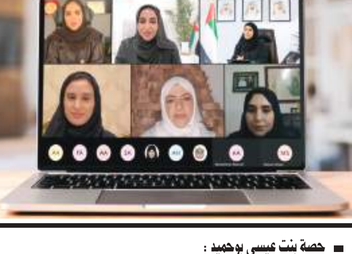
حصة بنت عيسى بوحميد

ورجحت معاليها بنخبة من سيدات الإمارات وصاحبات الأعمال المشاركات في الجلسة الحوارية من خضن تجارب لافتة وأصبحن قويات ناجحة في محيطهن المجتمعي داعية معاليها الأسر الإماراتية المنتجة المسجلة في مشروع "الصنعة" بالوزارة للاستفادة من الجلسة وانتقاء أفضل الممارسات لتطوير أعمالهن ومشاريعهن المنزلية متناهية الصغر وتحقيق أفضل النتائج التنافسية.