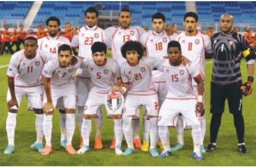
ديجا - وام:

عاشت رياضة الإمارات لحظات مجيدة عبر التاريخ، وحققت الكثير من الإنجازات منذ تأسيس دولة الاتحاد في عام ١٩٧١، بفضل دعم ورعاية قيادتها الرشيدة، وجهود الرياضيين المخلصين والمبدعين في مختلف الألعاب الرياضية، وتعد الإمارات واحدة من أسرع دول العالم في التأهل لمونديال كرة القدم، إن لم تكن أسرعها على الإطلاق، حيث لم يمض على تأسيسها أكثر من ١٨ عاماً لتضمن التأهل إلى كأس العالم عام ١٩٨٩، وتشارك فيه في إيطاليا عام ١٩٩٠، وكواحدة من دولتين فقط مثلتا القارة الآسيوية في هذا الحدث العالمي الكبير.