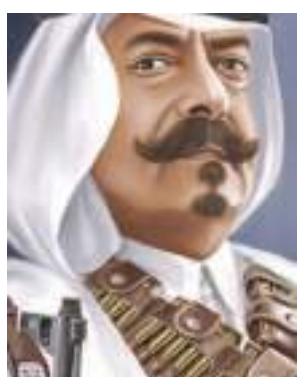
الأمير الشاعر محمد السديري