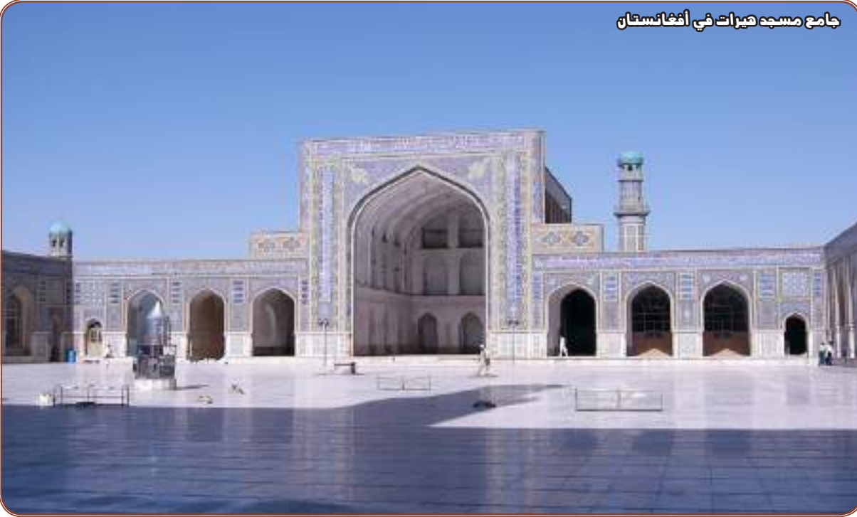
جامع مسجد هيرات في أفغانستان

الأحد ٥ صفر ١٤٤٣ هـ الموافق ١٢ سبتمبر ٢٠٢١ - العدد ١٤٨٤١ ١٦ صفحة/درهم واحد 16 pages/one Dirham السنة الثامنة والأربعون AL WAHDA SUNDAY 12 SEPTEMBER 2021 - Issue NO. 14841