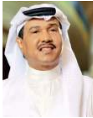
الفنان محمد عبد تغنى بقصائد السديري