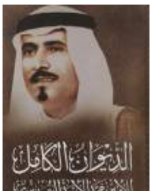
ديوان الشاعر السديري الأول في شبابه