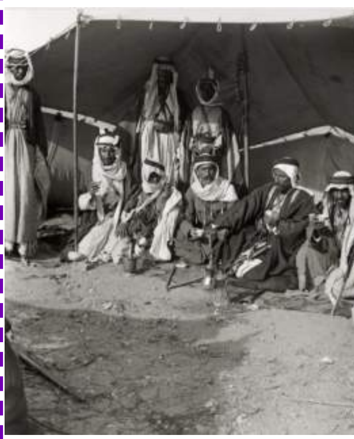
بادية نجد قديماً

ناجه ولاجل ارضاه وجه ركابيك وحلك لعلام السرابر دخيلي هو الذي ينحيك من كود صابيك ويذريك من كربات هول مهيلي وهو الذي في مافعلته يحاسبك وهو الذي برزاق عبده كفيلى