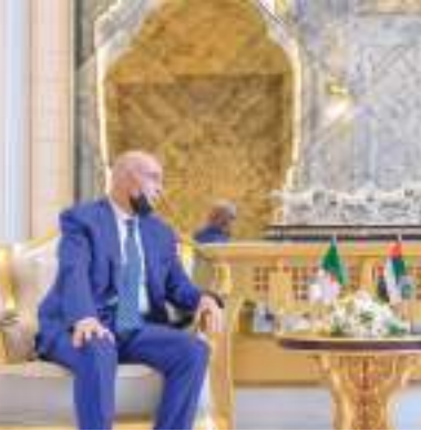
..وسموه خلال استقباله السفير الجزائري

استقبل سمو الشيخ عمار بن حميد النعيمي ولي عهد عجمان في ديوان الحاكم أمس الاثنين .. سعادة المعز بن عبد الستار بنميج سفير الجمهورية التونسية لدى الدولة. ورحب سموه بالسفير التونسي .. مؤكداً على تعزيز أواصر التعاون المشترك بين البلدين الشقيقين على مختلف المستويات. وجرى خلال اللقاء استعراض علاقات التعاون الثنائية القائمة بين الجانبين وتبادل الأحاديث التي من شأنها تقوية تلك العلاقة بين الشقيقتين في العديد من القطاعات وسبل توطيدها. وأشاد سعادة السفير التونسي بمكانة وعمق العلاقات الثنائية وبما تشهده