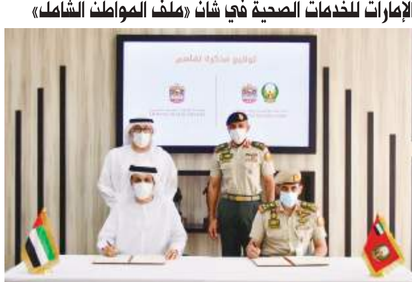
خلال التوقيع على مذكرة التفاهم