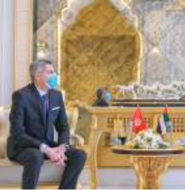
عمار النعيمي خلال استقباله السفير التونسي

دولة الإمارات عامة وعجمان خاصة من نهضة حضارية في الميادين كافة. حضر اللقاء الشيخ أحمد بن حميد