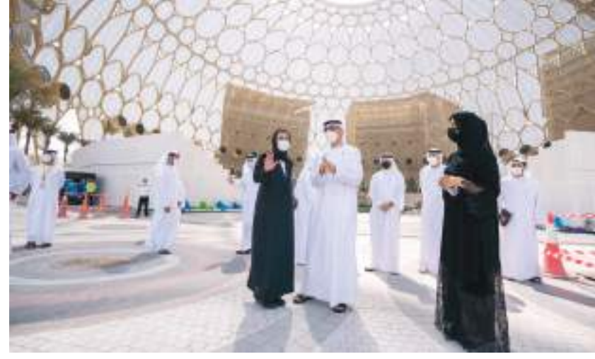
خالد بن محمد بن زايد خلال زيارته موقع إكسبو ٢٠٢٠ دبي وجناح الإمارات أبوظبي-وام :

الوطني، والوقوف على جاهزية الجناح الوطني لدولة الإمارات .. وقالت معاليها : مستعدون لإقامة نسخة غير مسبوقه من الحدث العالمي، واستقبال ضيوف الإمارات من حول العالم. مؤكدة أن الجناح الوطني لدولة الإمارات يتميز من حيث التجربة التي يقدمها للزوار، ليعكس تاريخ وثقافة وأصالة الإمارات وشعبها.