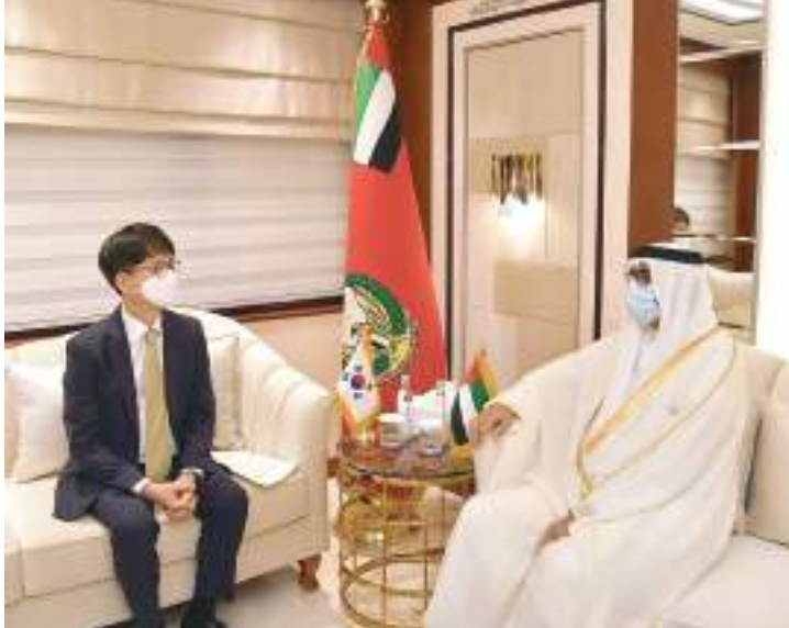
محمد بن احمد البواردي خلال استقباله براك جيه مين

وشدد على ضرورة استمرار الشراكة الاستراتيجية التي تعكس مدى التطور الإيجابي والنوعي ورغبة كلا البلدين في تطوير التعاون الدفاعي بالإضافة إلى رفع القدرات في مختلف المجالات التخصصية الأخرى بما يعود بالنفع على المصالح المشتركة للبلدين.