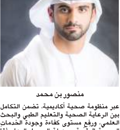
منصور بن محمد