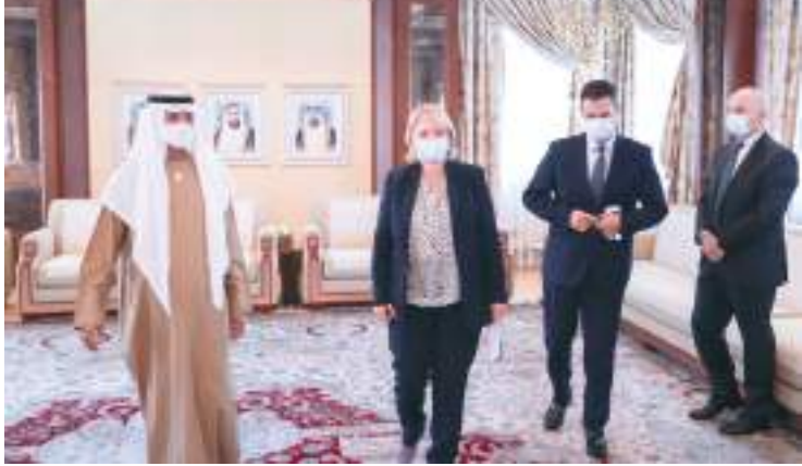
نهيان بن مبارك خلال استقباله ناتيا تورنافا

واحدة لخدمة الإنسانية جمعاء ومن جانبها أكدت وزيرة الاقتصاد والتنمية المستدامة في جمهورية جورجيا حرص بلادها على تعزيز التعاون مع دولة الإمارات بما يخدم المصالح المشتركة. مشيدة بدور الإمارات وجهودها الرائدة عالمياً في إرساء أسس السلام والتسامح والتعايش بما يعزز