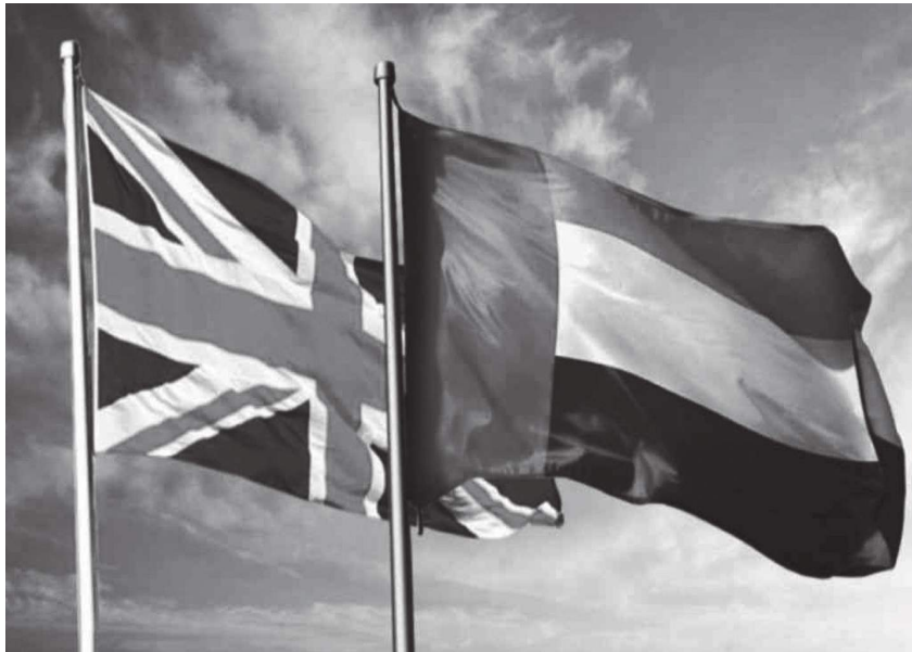
أبوظبي - (وام):

تمضي دولة الإمارات قدماً نحو تطوير علاقاتها الاقتصادية مع المملكة المتحدة واستكشاف مزيد من الفرص لتعزيز التعاون بين البلدين الصديقين وتوسيع آفاق الشراكة على المستويين الحكومي والخاص، ووضع أطر جديدة للعلاقات التعاون في كافة المجالات لخدمة خطط التنمية الشاملة التي يقودها البلدان.