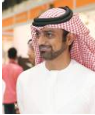
ولي عهد عجمان

واوضح الشيخ عبدالعزيز بن حميد النعيمي أن لدى الدائرة برامج وخطط متكاملة وشاملة ترمي إلى تعزيز الاستثمار الأجنبي المباشر بعجمان ونسعى من خلالها وبالتعاون والتنسيق مع شركاء استراتيجيين مهتمين بالقطاعات التسوقية السياحية والتجارية نقل المعرفة والتجارب الرائدة التي تثرى المجتمع