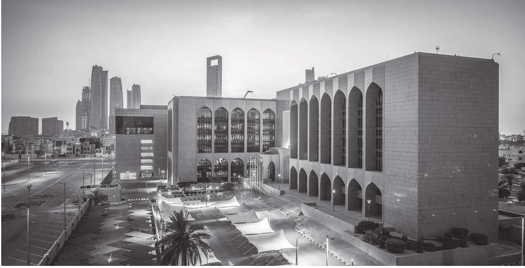
أبوظبي - (وام):

الإمارات العربية المتحدة المركزي : يأتي هذا التقرير في إطار الجهود المستمرة لمواجهة الاتجاهات والتطورات الخاصة بغسل الأموال وتمويل الإرهاب وأنماط المخاطر الناشئة في القطاع المالي في ظل جائحة كوفيد-19.