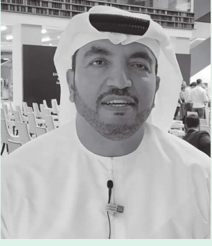
أبوظبي - (وام):

أكدت وزارة الصناعة والتكنولوجيا المتقدمة ومجلس أبوظبي للجودة والمطابقة أهمية دعم القدرات الإماراتية في منظومة البنية التحتية للجودة انطلاقاً من الأهداف الاستراتيجية الوطنية للصناعة والتكنولوجيا المتقدمة "مشروع 300 مليار" وأثرها على تعزيز تنافسية المنتجات الإماراتية إقليمياً وعالمياً، وتبني وتطبيق أحدث المواصفات واللوائح الفنية والأنظمة الداعمة لأعلى معايير الجودة في الإنتاج، بما يتماشى مع قدرات وما تملكه الدولة من أحدث المواصفات العالمية ذات العلاقة بالصناعة والتكنولوجيا المتقدمة.