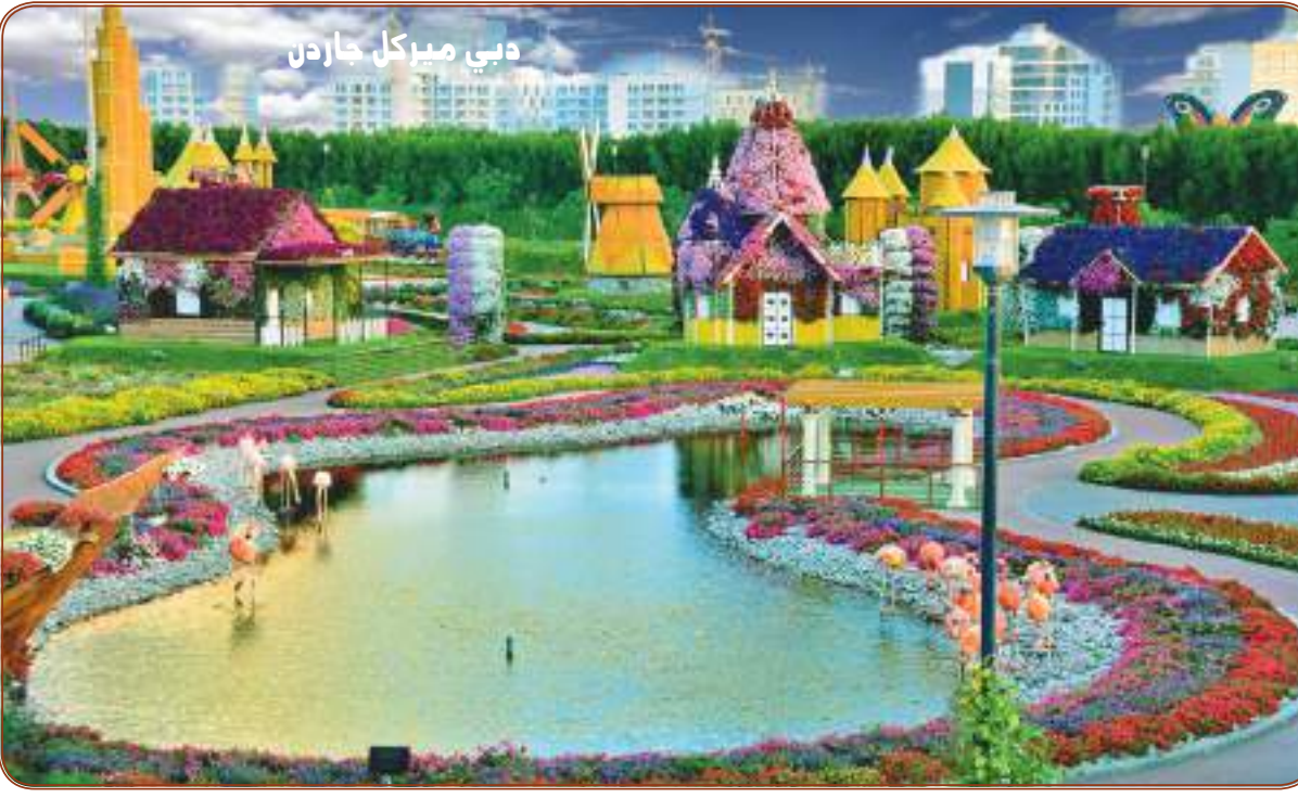
دي ميركل جاردن

ويقول العالم الروسي، تتجه أشعة الشمس بزاوية منخفضة جدا، لذلك فإن الخطورة من الثقوب الصغيرة التي يمكن أن تتشكل فوق بلدنا، وليس من ثقب الأوزون الكبير. بالإضافة إلى أننا في الخريف نرتدي ملابس مناسبة، لذلك فإن هذه الأشعة تؤثر فقط في الخدين والأنف. وبضئيف، تميز عام ٢٠٢٠ أيضا بثقب أوزون كبير جدا. ويرتبط كل عام منفصل باستقرار وقوة الدوامة القطبية فوق القارة القطبية الجنوبية، حيث تزداد خطورتها بزيادة حجمها. لأنها تصنع غيوما خاصة تضيف عاملا آخر لتدمير طبقة الأوزون.