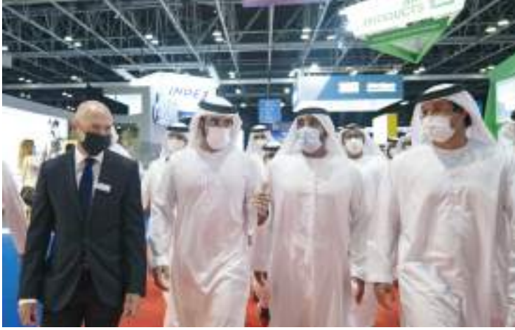
حمدان بن محمد خلال تفقده المعرض

بالاستفادة من موارد الطاقة المتجددة وفي مقدمتها الطاقة النووية السلمية والطاقة الشمسية، ما يعكس مدى حرص القيادة الرشيدة على تطبيق الحلول المستقبلية للطاقة لخدمة غايات التنمية المستدامة. وخلال حضور سموه حفل الافتتاح، الذي رافقه فيه سمو الشيخ أحمد بن سعيد آل مكتوم، رئيس المجلس الأعلى للطاقة في دبي، ومعالي سهيل بن محمد فرج فارس المزروعى وزير الطاقة والبنية التحتية، تابع سمو ولي عهد دبي كلمة مسجلة لمعالي الدكتور سلطان بن أحمد الجابر وزير الصناعة والتكنولوجيا المتقدمة والعضو المنتدب والرئيس التنفيذي لشركة بتروك أبوظبي الوطنية أدنوك ومجموعة شركاتها، تناول فيها الدور المهم الذي يلعبه الغاز الطبيعي في دعم مسيرة التنمية الاقتصادية في دولة الإمارات مع سعيها المستمر في ترسيخ مكانتها الريادية على مستوى المنطقة في هذا المجال، بما تنفذه من مشاريع نوعية تهدف من خلالها إلى تحقيق الأكتفاء الذاتي وتحقيق التوازن بين متطلبات التنمية الاقتصادية والحفاظ