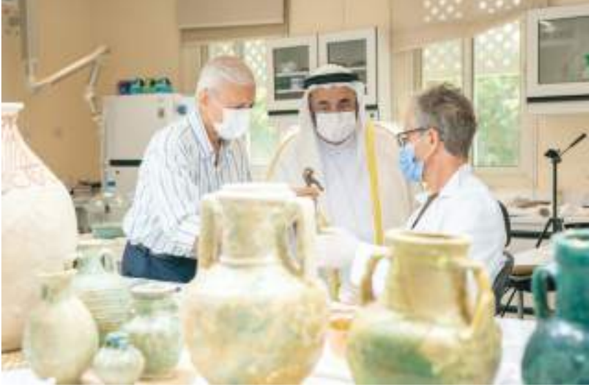
حاكم الشارقة يستمع إلى شرح مفصل من الدكتور صباح عبود جاسم حول مكونات الاكتشافات الجديدة «وام»