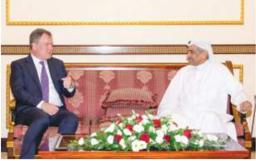
حاكم الفجيرة خلال استقباله الرئيس التنفيذي لشركة فيتول العالمية للبتروك