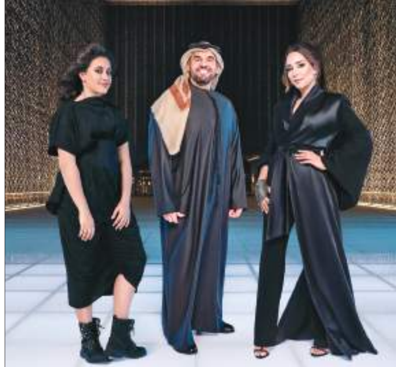
٢٠٢٠ دبي - التي تجمع بين الماضي والحاضر والمستقبل، وتلهم الجميع. في غضون أقل من ١٠ أيام، تنتقل إلى الترحيب بالعالم أجمع وصنع ذكريات

يقود الأغنية، النجم الإماراتي حسين الجسمي، سفير إكسبو ٢٠٢٠، ترافقه كل من المغنية وكاتبة الأغاني الإماراتية أماس، البالغ عمرها ٢١ عاماً، والتي أدرجتها منصة سبوتيفاي في قائمتها لأفضل المواهب النسائية في الشرق الأوسط، إلى جانب المغنية وكاتبة الأغاني اللبنانية الأمريكية المرشحة لنيل جائزة الغرامي، ميسا قرعة، وهي أيضاً المدير الفني لاوركسترا الفردوس النسائية في إكسبو وبيركلي أبوظبي. وقالت مرجان فريدوني، الرئيس التنفيذي لتجربة الزائر في إكسبو ٢٠٢٠ دبي: تعمل معارض إكسبو الدولية على جمع الناس معاً، ويشرفنا أن نرحب بمجموعة من المواهب الرائعة لتسندوا بالأغنية الرسمية لإكسبو