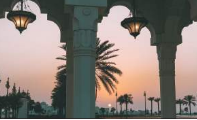
وعند الاقتراب من القصر، سي شاهد الزوار العاملين الفنيين القضاة « طاقة الكلام» وسط الحدائق الخارجية للقصر، إذ تتلألأ أشعة الشمس على أسطحها العاكسة، لتبرز مجموعة من الكلمات

تبدأ ملامح الفخامة والجمال قبل الوصول إلى البوابة الرئيسية لقصر الوطن، وتحديدًا من مركز الزوار والانتقال عبر الحدائق الفريدة التي تأسر الأنظار بجمال ورودها وأشجارها المتواجدة عبر الممرات الخارجية للمجمع الرئاسي إلى حين الوصول إلى البوابة الرئيسية.