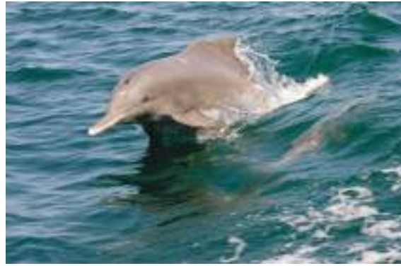
أبوظبي - وام :

«إكسبو ٢٠٢٠ دبي» يسخر أحدث التقنيات والذكاء الاصطناعي والروبوتات لخدمة البشرية