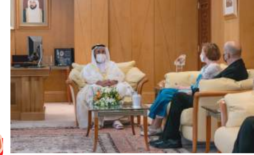
حاكم الشارقة خلال لقائه مع مديرة الجامعة الأميركية الجديدة