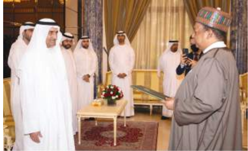
حاكم الفجيرة خلال استقباله وزير النفط النيجيري وأمين عام أوبك

العالمية المطبقة في جميع مراحل المشروع، والتي تدعم ركائز التنمية في الدولة وتعزز اقتصادها المستدام.