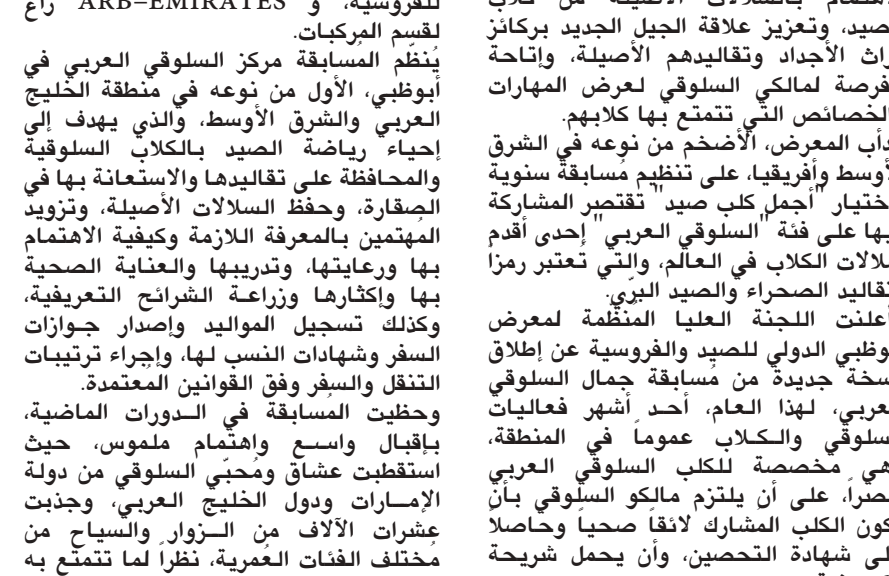
معرض أبوظبي للصيد والفروسية، الذي يفتتحه صاحب السمو الشيخ محمد بن زايد آل نهيان، في منطقة الظفرة، خلال الفترة من 27 سبتمبر الجاري ولغاية 3 أكتوبر المقبل، تحت

وحظيت المسابقة في الدورات الماضية، بإقبال واسع وإهتمام ملموس، حيث استقطبت عشاق ومحبي السلوقي من دولة الإمارات ودول الخليج العربي، وجذبت عشرات الآلاف من الزوار والسياح من مختلف الفئات العمرية، نظراً لما تتمتع به من قوة وذكاء وولاء ومهارات عالية، خاصة وأن المسابقة تختلف عن مسابقات الكلاب الأخرى في العالم، والتي تركز فقط على المظهر الخارجي، إذ تهتم مسابقة معرض أبوظبي للصيد أكثر بشخصية كلب الصيد ومهاراته وردود فعله واستجابته الحسية.