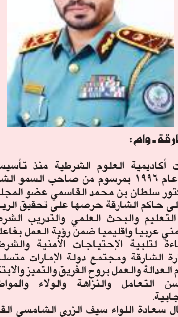
الشارقة - وام:

أكدت أكاديمية العلوم الشرطية منذ تأسيسها في عام ١٩٩٦ بمرسوم من صاحب السمو الشيخ الدكتور سلطان بن محمد القاسمي عضو المجلس الأعلى حاكم الشارقة حرصاً على تحقيق الريادة في التعليم والبحث العلمي والتدريب الشرطي والأمني عربياً وإقليمياً ضمن رؤية العمل بفاعلية وكفاءة لتلبية الاحتياجات الأمنية والشرطية لإمارة الشارقة ومجتمع دولة الإمارات متسلحة بقيم العدالة والعمل بروح الفريق والتميز والابتكار وحسن التعامل والنزاهة والولاء والمواطنة الإيجابية.