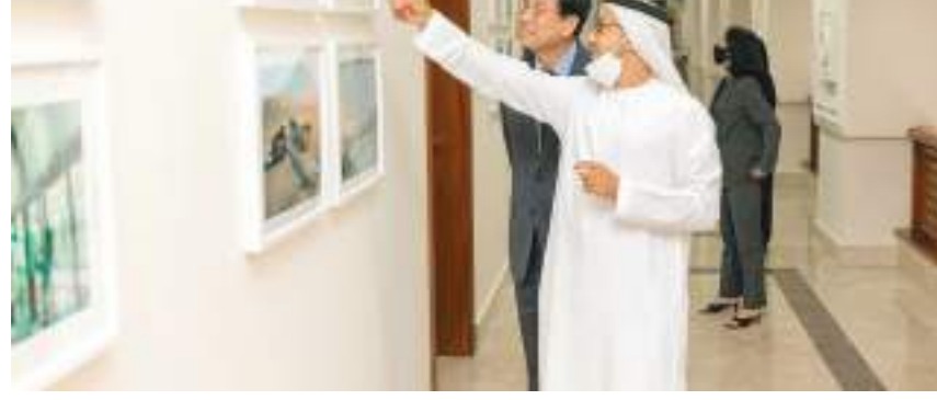
الشارقة - وام:

مشارك في قطاع الصناعات الإبداعية ستعكس نتائجها على مجمل القطاعات الإستثمارية بين الجانبين. من جهته أشاد مون بيونغ جون بدور إمارة الشارقة الثقافي وما تمثله على مستوى دولة الإمارات والمنطقة من ريادة في تبني رسالة المعرفة والفن والارتقاء بوغي الإنسان واعتبر أن هذا التوجه يميز الشارقة ويساعدها لتكون وجهة جاذبة للسياحة والاستثمار لتكثرت العلاقات بين مدن كوريا الجنوبية وإمارة الشارقة راسخة ومبشرة بالمزيد من التعاون في المستقبل.