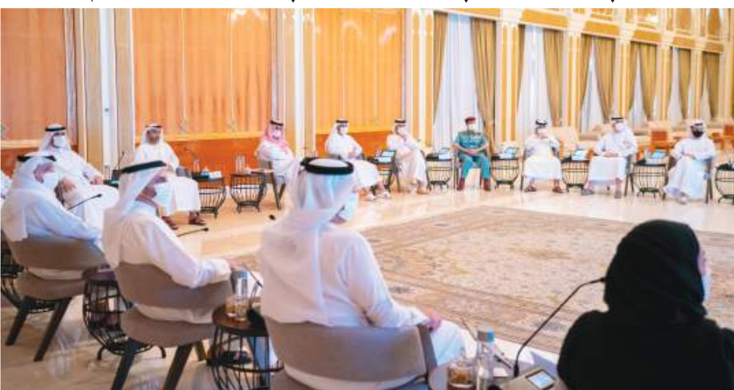
عمار النعيمي خلال ترؤسه الجلسة الثامنة للمجلس التنفيذي للعام ٢٠٢١