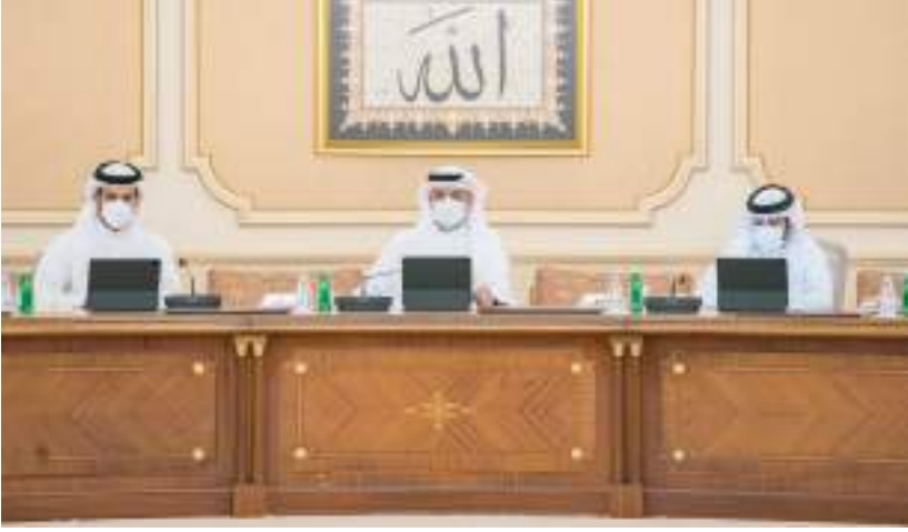
ولي عهد الشارقة خلال ترؤسه الاجتماع