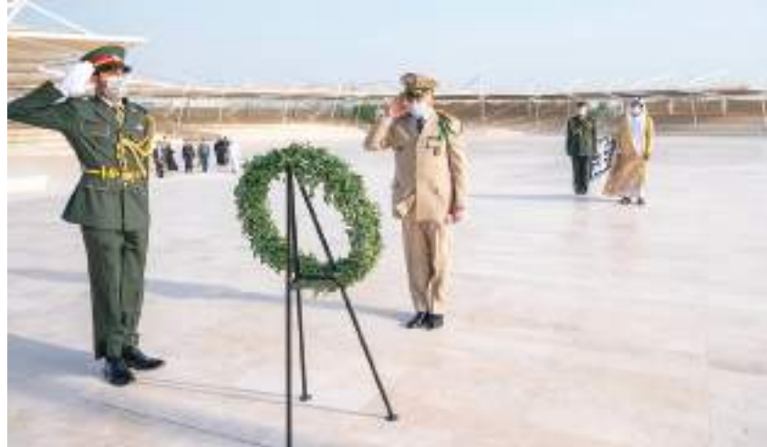
خليفة بن طحنون خلال استقباله المفتش العام للجيش المغربي في واحة الكرامة