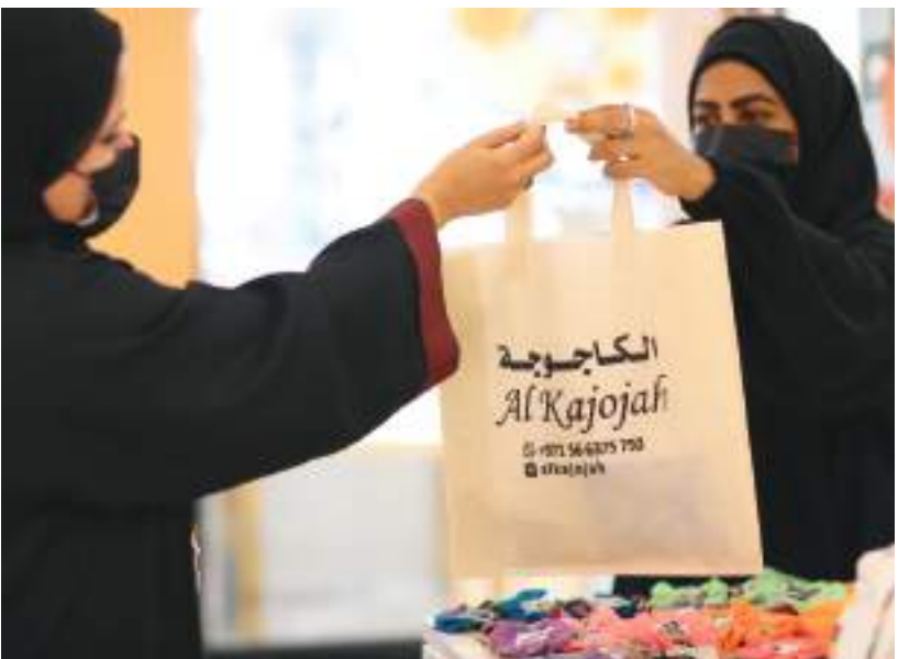
دجيا - وام :