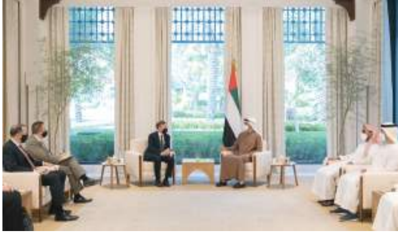
محمد بن زايد خلال مباحثاته مع مستشار الأمن القومي الأميركي