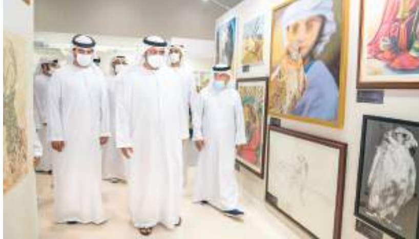
ولي عهد الفجيرة خلال زيارته معرض الصيد والفروسية