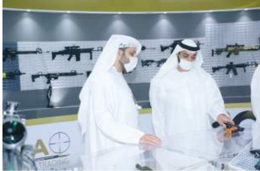
خالد بن سلطان بن زايد خلال زيارته أجنحة معرض الصيد والفروسية