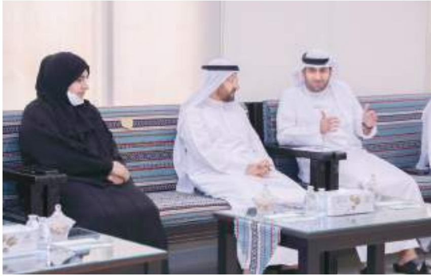
الشارقة - وام :

المشروع الأول الذي يحتوي الأطفال المعنفين جسدياً أو جنسياً في مكان آمن يجمع جهود عدة مؤسسات لعلاج هذه الحالات بما يضمن عودة الطفل سالماً إلى بيته. وأضافت الدكتورة حصة الغزال المدير التنفيذي لمكتب الشارقة صديقة للطفل: "بأن إمارة الشارقة بعد حصولها على اللقب العالمي مدينة صديقة للطفل تطلب منا جهود كبيرة لدعم الطفل و الأم مثل حملة دعم الرضاعة الطبيعية واعتماد المراسيم في مؤسسات العمل بتخصيص غرف رضاعة للامهات العاملات أو حضانات للأطفال في مقر العمل ، ولكننا نحتاج إلى منظومة شاملة تعكس إنجازات الإمارة على مستوى الدولة والمنطقة وعالمياً باعتبارها نموذجاً يحتذى به ." وأكدت إيمان راشد مدير إدارة التثقيف الصحي على دور الجمعيات التابعة لإدارتها والدعم الصحي الذي يمكن تقديمه من خلال مشاركة الجمعيات في الدور التوعوي والصحي في فعاليات مجالس الضواري والمهرجانات بالإضافة للمحاضرات والورش الصحية المختلفة لأهالي الضواري.