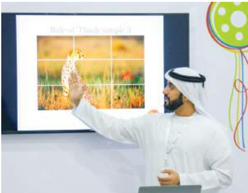
الشارقة - وام :

والدرب على رسم شخصية كرتونية متحركة إلى جانب تعلم تقنيات الإنتاج والإخراج السينمائي والتصوير وكيفية استخدام كاميرا الهاتف لإنتاج مقاطع فيديو. أما ورش العمل التي يخصصها المهرجان لفئة الشباب فتستهدف تنمية مهاراتهم حول موضوعات سينمائية وفنية متنوعة حيث يقدم أحد خبراء الرسوم المتحركة الأكثر رواجاً توماس كوتشيرا ورشة عمل حول استخدام برنامج ٣D MAYA بعنوان "اصنع عالمك ثلاثي الأبعاد". وتتناول الورش فن الإخراج الأفلام من مخرجين ومصورين عرب وإجانب في ٣٠ ورشة عمل تدريبية متنوعة تعقد خلال الفترة من ١٠ إلى ١٥ أكتوبر المقبل تحت شعار فكر سينما. وتتناول الورش التي تقام بالتعاون مع عدة شركاء ومؤسسات فنية محاور وموضوعات سينمائية متخصصة، تعالج مختلف الفنون والتقنيات المتعلقة بصناعة الأفلام وأشكال التصوير السينمائي وكتابة السيناريو وتستهدف الأطفال الشباب وتقدم بنسختين الأولى بالعربية والثانية بالإنجليزية على الفترتين الصباحية والمسائية ولمدة ٥٠ دقيقة لكل ورشة.