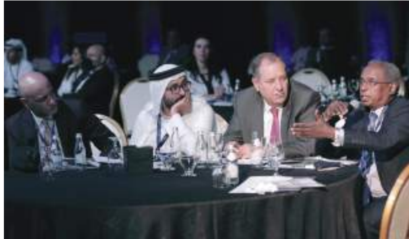
خلال فعاليات المؤتمر