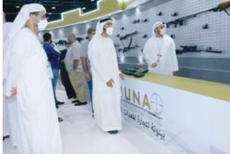
نهيان بن زايد خلال زيارته معرض الصيد والفروسية