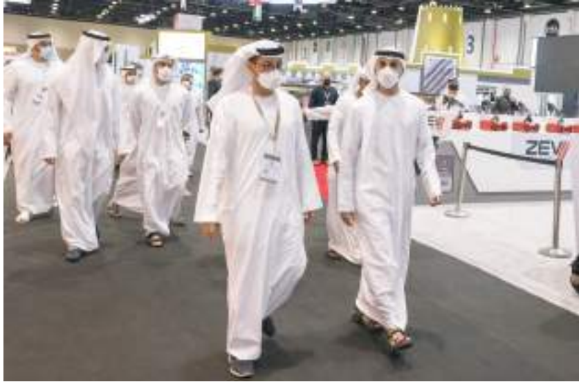
خالد بن محمد بن زايد خلال تفقده معرض أبوظبي للصيد والفروسية