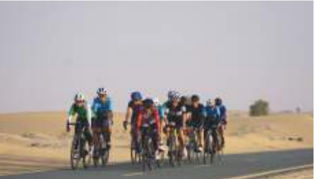
أبو ظبي - الوحدة:

بعد النجاح الكبير والمشاركة الواسعة في النسخة الأولى يعود سباق «تحدي المرموم للدراجات الهوائية للسيدات»، إلى محمية المرموم الصحراوية الذي تنظمه شركة «فت جروب مي» بالتعاون مع مجلس دبي الرياضي وتحت رعاية موانئ دبي العالمية، وتقام منافساته في مضمار القدرة للدراجات الهوائية يوم الجمعة ٨ أكتوبر ٢٠٢١.