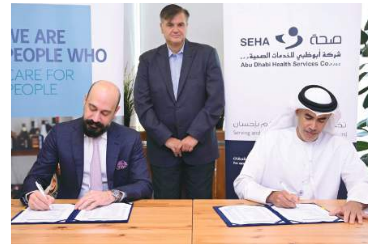
أبوظبي - الوحدة:

علنت شركة أبوظبي للخدمات الصحية «صحة»، أكبر شبكة للرعاية الصحية في دولة الإمارات العربية المتحدة، ومدينة الشيخ شخبوط الطبية، إحدى أكبر مستشفيات دولة الإمارات العربية المتحدة في تقديم خدمات الرعاية الصحية للحالات الحرجة والمعقدة والمشروع المشترك بين «صحة» و«مايو كلينك»، عن توقيع مذكرة تفاهم مع «نكستكير»، إحدى شركات أليانز بالرتنرز، مختصة في تقديم إدارة شاملة لخدمات التأمين الصحي لشركات التأمين وبرامج تأمين، لتقديم خدمات الرعاية الصحية لأعضاء شبكة «نكستكير» في منشآت «صحة» ومدينة الشيخ شخبوط الطبية.