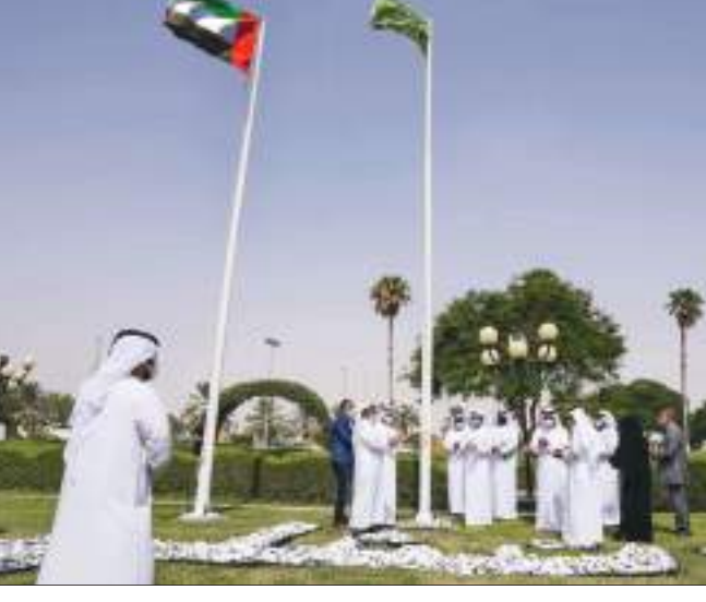
الظفرة - الوحدة:

فازت بلدية منطقة الظفرة بخمسة أعلام خضراء في جائزة العلم الأخضر الدولية وحصولها على الشارة الدولية الأرفع في إدارة الحدائق والمساحات الخضراء الأحياء وهي راية العلم الأخضر، وبحضور مدير عام بلدية منطقة الظفرة احتفلت البلدية برفع أول علم أخضر على مستوى الدولة خلال العام ٢٠٢١ في حديقة مدينة السلع.