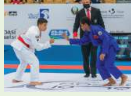
أبو ظبي - الوحدة: