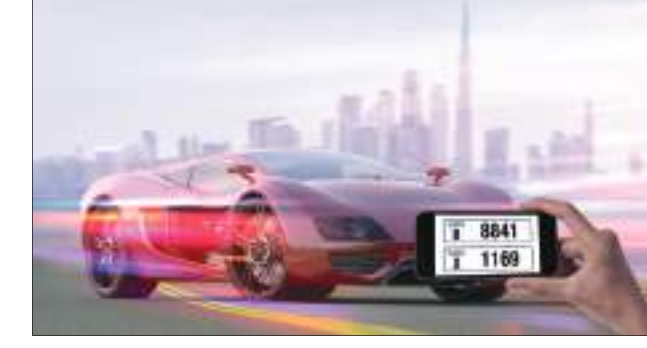
دبي - وام:

تطرح هيئة الطرق والمواصلات في دبي / ٣٥٠ / رقماً ثلاثياً ورباعياً وخماسياً مميّزاً للوحات الدراجات النارية والمركبات النارية والكلاسيكية من الفئات المختلفة في مزاد إلكتروني يحمل الرقم ٦٥ في سلسلة مزاداتها الإلكترونية للارقام المميزة للوحات المركبات والدراجات النارية حيث سينطلق المزاد يوم الأحد الموافق ١٧ أكتوبر في الساعة الثامنة صباحاً ويستمر ٥ أيام. وقد بدأ التسجيل فعلياً في المزاد الإلكتروني يوم أمس وسيخضع بيع الأرقام في هذا المزاد لتطبيق ضريبة القيمة المضافة البالغة ٥٪ وتشترط عملية المشاركة في المزاد أن يكون للمتعامل ملف وديرة كما يمكن الدفع عن طريق