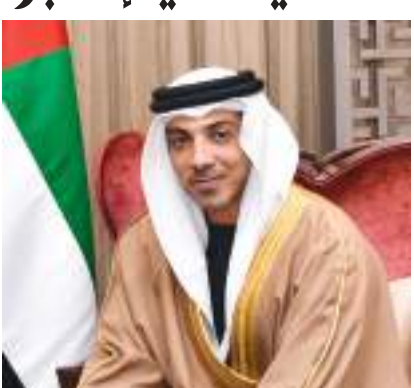
منصور بن زايد

وقال معالي خالد محمد سالم بالعمى التميمي محافظ مصرف الإمارات العربية المتحدة المركزي - خلال كلمته - إن دولة الإمارات شهدت هذا العام، الانطلاقة التاريخية لصياغة معالم مستقبلها للخمسين عاما المقبلة. وتم من خلالها وضع رؤية بعيدة المدى تقوم على عشرة مبادئ استراتيجية، وترتكز أهم توجهاتها الاقتصادية والتنموية على بناء الاقتصاد الأفضل في العالم، يضاف إلى ذلك الاستثمار في رأس المال البشري، والاعتماد على التفوق في مختلف المجالات الرقمية والتقنية والعلمية. وأضاف أنه وتماشياً مع رؤية الدولة للخمسين عاما المقبلة، عمل مصرف الإمارات المركزي على تطوير خريطة طريق للعقود الخمسة المقبلة. وحرص على إدراج ثلاثة عناصر مهمة، وهي: تبني استخدام الذكاء الاصطناعي، وتحليل البيانات الضخمة في قطاعي البنوك والتأمين، واستخدام التكنولوجيا في الأنظمة