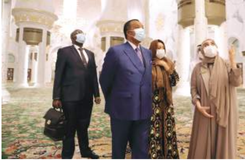
رئيس الكونغو خلال زيارته جامع الشيخ زايد الكبير في أبوظبي