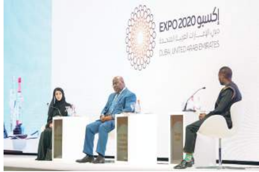
حمدان بن محمد خلال حضوره «المنتدى العالمي الأفريقي للأعمال»