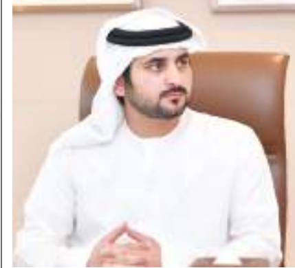
مكتوم بن محمد

من جانبه أوضح معالي محمد بن هادي الحسيني وزير الدولة للشؤون المالية، أنه تم إعداد مشروع الميزانية العامة للاتحاد لسنوات الخطة ٢٠٢٢-٢٠٢٦، استناداً لأحكام المرسوم بقانون اتحادي رقم ٢٦ لسنة ٢٠١٩ بشأن المالية العامة، وفقاً لأفضل الممارسات العالمية، وذلك بهدف رفع كفاءة الإنفاق الحكومي وتوجيهه، لتمكين الجهات الاتحادية