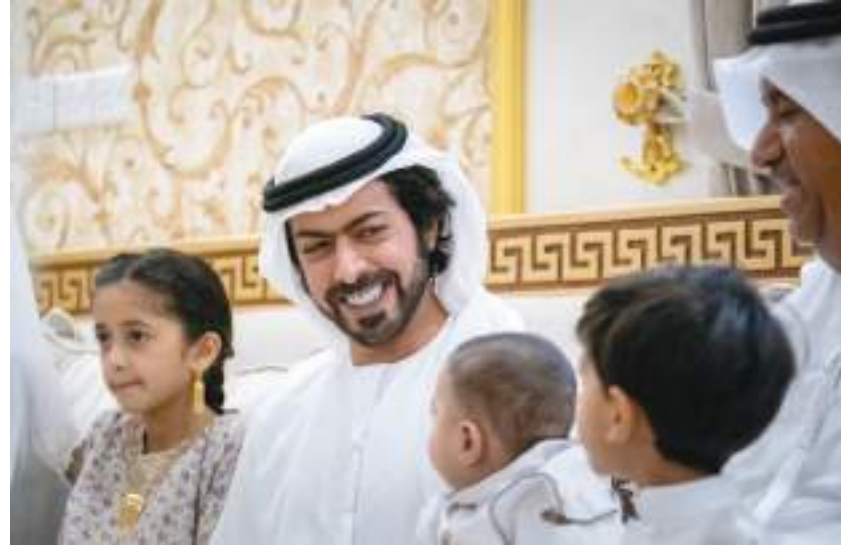
خليفة بن طحون خلال زيارته لإحدى أسر الشهداء

والعافية، مؤكداً لهم أن تضحيات الشهداء ودمانهم الزكية التي سالت في سبيل الوطن وأمنه ستظل خالدة في وجدان الأمة وبإقية في ضمير كل إماراتي تستنير بضيائها الأجيال المقبلة لتواصل العمل والبناء وتحافظ على مكتسبات الوطن ومنجزاته في ظل قيادتنا الرشيدة.