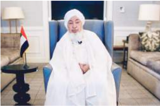
الشيخ عبدالله بن بيه

العليا وفي جانبية المقاصد والنصوص الشرعية. مشيراً إلى أن مستقبل التمويل الإسلامي يكمن في التركيز على ثلاثة عوامل هي الموائمة والملائمة والإبتكار ومن خلال ذلك يمكن للاقتصاد الإسلامي تلبية الحاجات الحقيقية للاقتصاد والتعامل مع الواقع الجديد للحركة الاقتصادية. وأكد ابن بيه أنه من الضروري التعامل مع المذاهب الإسلامية جميعاً كمجموعة واحدة وبالتالي الاستفادة من الثروة الفقهية الكبيرة التي تزخر بها هذه المذاهب وتطرق إلى مقترح لتطوير معيار التوازن والتوسط الذي يقوم على الموائمة بين الثبات والتغير. ودعا معالي الشيخ بن بيه الهيئات الشرعية بالمؤسسات المالية إلى الانفتاح على الأقوال في المذاهب الإسلامية المتنوعة، والوعي بالحاجة الملحة لنظرة جديدة ورؤية متجددة في المعاملات الاقتصادية المعاصرة، والعمل على تحديث الأدوات الاجتهادية والمعايير التنظيمية في الاقتصاد الإسلامي بما يراعي الحفاظ على قيمه الأساسية التي منها الانضباط والشفافية وصيانة حقوق المتعاملين.