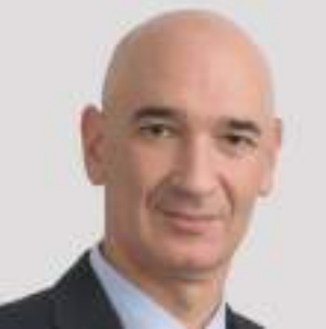
دبي - (الوحد):

تستعد شركة «مايكروسوفت» لعرض ابتكاراتها التكنولوجية في أسبوع «جيتكس للتقنية» الحادي والأربعين، الذي يقام في الفترة من ١٧ إلى ٢١ أكتوبر/تشرين الأول في مركز دبي التجاري العالمي، حيث سيرعرض جناح «مايكروسوفت»، تحت شعار «معاً نخلق مستقبلًا رقمياً أكثر ازدهاراً»، أحدث الابتكارات في مجالات المدن الذكية المستدامة، وأبرز التقنيات التي تمكن المنظمات من التكيف والازدهار في ظل بيئة العالم الهجينة.