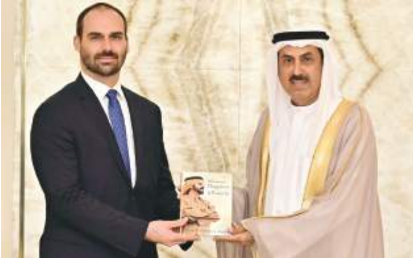
صقر غباش خلال استقباله رئيس مجموعة الصداقة البرلمانية الإماراتية البرازيلية