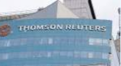
تورونتو - (وكالات):