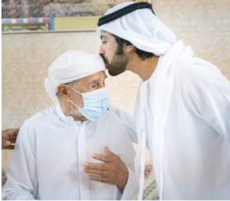
خليفة بن طحنون خلال زيارته لأسر وذوي الشهداء في دبي ورأس الخيمة والفجيرة

وفي بحر عمان الموج خفيف.. ويحدث المد الأول عند ١٧:٤٩ والمد الثاني عند ٠٦:٥٩ والجزر الأول عند الساعة ١٢:٢٠ والجزر الثاني عند الساعة ٠٠:٠٦.