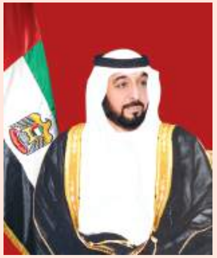
رئيس الدولة ونائبه ومحمد بن زايد يهنئون مستشار النمسا أبوظبي-وام:

بعث صاحب السمو الشيخ خليفة بن زايد آل نهيان رئيس الدولة "حفظه الله" بريقة تهنئة إلى معالي الكسندر شالنبرج بمناسبة أداؤه اليمين الدستورية مستشاراً اتحادياً لجمهورية النمسا. كما بعث صاحب السمو الشيخ محمد بن راشد آل مكتوم نائب رئيس الدولة رئيس مجلس الوزراء حاكم دبي رعاه الله و صاحب السمو الشيخ محمد بن زايد آل نهيان ولي عهد أبوظبي نائب القائد الأعلى للقوات المسلحة بريقيته تهنئة مماثلتين إلى معالي الكسندر شالنبرج.