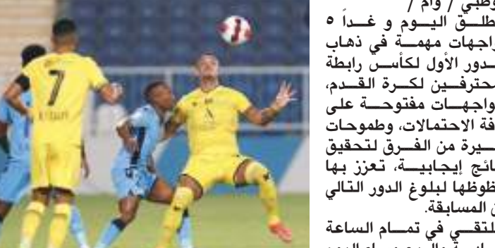
أبو ظبي / وام :

تنطلق اليوم وغداً ه مواجهات مهمة في ذهاب الدور الأول لكأس رابطة المحترفين لكرة القدم، بمواجهات مفتوحة على كافة الاحتمالات، وطموحات كبيرة من الفرق لتحقيق نتائج إيجابية، تعزز بها حظوظها بلوغ الدور التالي من المسابقة. ويلتقي في تمام الساعة السادسة والربع مساء اليوم الجمعة، العين مع فريق الإمارات، على ستاد هزاع بن زايد، وسبق للمحترفين أن التقيا مطلع الموسم الجاري في دوري "أندوك للمحترفين، وحقق العين الفوز بهدفين مقابل لا شيء خلال الجولة الثانية من بطولة الدوري.. وفي التوقيت نفسه يلتقي اتحاد كلباء مع العروبة، على ستاد اتحاد كلباء. تختتم مواجهات اليوم الجمعة بقاء تنطلق في الساعة الثامنة والنصف