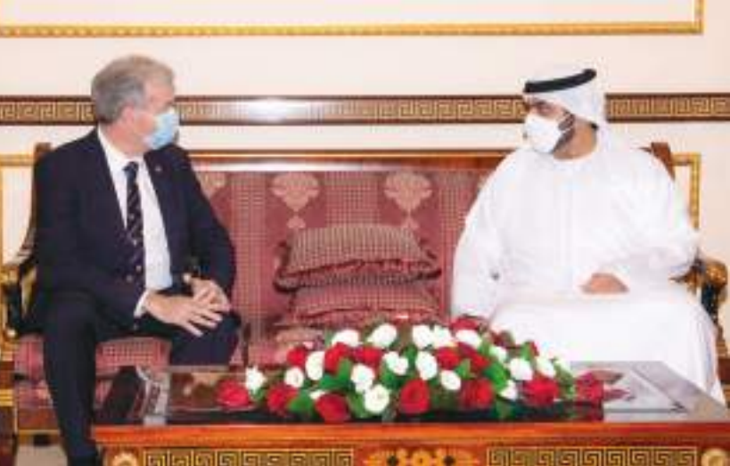
محمد بن حمد الشرقي خلال استقباله رئيس وزراء جزيرة جبرسي

وفي بداية اللقاء رحب معالي صقر غباش برئيس مجموعة الصداقة البرلمانية البرازيلية المتينة بين دولة الإمارات العربية المتحدة وجمهورية البرازيل على مختلف المستويات. كما أشاد معاليه بالتطور الملحوظ في العلاقات الثنائية بين البلدين، خاصة بعد زيارة فخامة جايبير بولسونارو الرئيس البرازيلي لدولة الإمارات في أكتوبر ٢٠١٩ والتي توجت بالتوقيع على مذكرة تفاهم بشأن الشراكة الاستراتيجية بين دولة الإمارات العربية المتحدة وجمهورية البرازيل الاتحادية. وأكد الجانبان على أهمية التواصل والتنسيق البرلماني بين الجانبين بما يسهم في إثراء العلاقات المتميزة بين البلدين والشعبين الصديقين مما يعزز ويجسد عمق وخصوصية هذه العلاقات وتعزيز الروابط المشتركة التي ترتكز على تلاقي الرؤى ووحدة المواقف والشراكة المتنامية في المجالات كافة وبما يترجم توجهات قيادتي البلدين الحريصتين على تطوير هذه العلاقات وتدعيمها في مختلف المجالات. وتقدم يد العون والمساعدة للبلدان المتضررة من هذا الوباء باختلاف أبنائها وأعرافها وتوجهاتها، وجعلت إغاثة الإنسان حيثما كان هي البوصلة والهدف الأسمى لجهودها، مجسدة بذلك التضامن والتعاون الذي تدعو إليه كل الأديان والمذاهب الفلسفية والأخلاق النبيلة. وتحدث عن النظام المالي من المنظور الفكري والشري وأن أهم العوامل المؤثرة في مستقبل النظام المالي