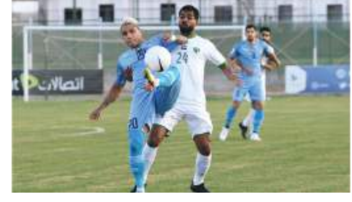
رأس الخيمة / وام :

وفي المباراة الثانية استطاع نادي الحميرة الفوز على ضيفه نادي التعاون بثلاثة أهداف دون رد..وعلى ملعب مسافني تعادل أصحاب الأرض إيجابيا مع نادي دبا الحصن بهدف..وفي المباراة الرابعة سيطر التعادل السلبي بدون أهداف على المباراة التي جمعت نادي الفجيرة مع ضيفه نادي البطائح.