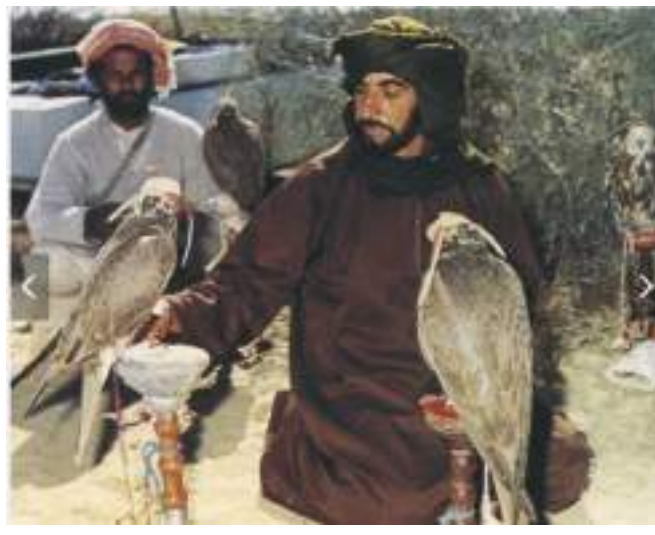
معاينة الصقور قبل رحلة القنص