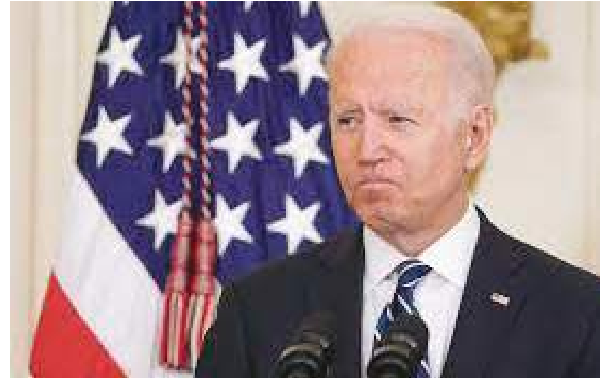
واشنطن (د ب أ) -