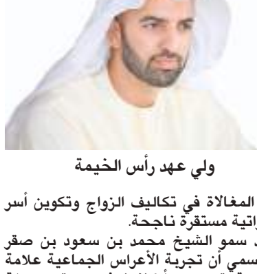
ولي عهد رأس الخيمة

عن المغالاة في تكاليف الزواج وتكوين أسر إماراتية مستقرة ناجحة. وأكد سمو الشيخ محمد بن سعود بن صقر القاسمي أن تجربة الأعراس الجماعية علامة مضيئة ترسخ أركانها في مجتمع دولة الإمارات وصارت مظهراً حضارياً يعتز بها أبناء الوطن وعمقت بدورها في نفوس الجميع قيم الأباة والأجداد التي تقوم على التكافل والتعاون والتلاقي من أجل صالح أبناء الوطن جميعهم.