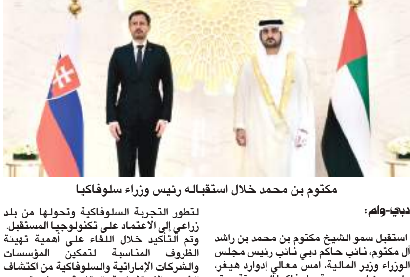
مكتوم بن محمد خلال استقباله رئيس وزراء سلوفاكيا