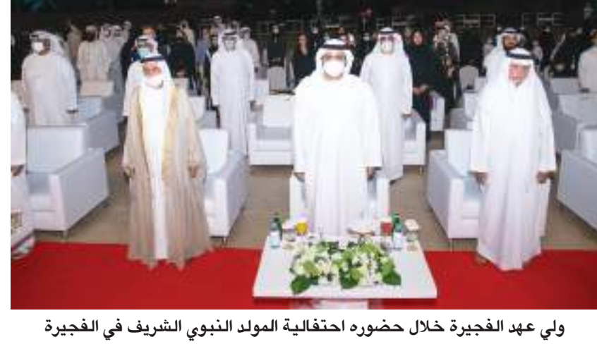
ولي عهد الفجيرة خلال حضوره احتفالية المولد النبوي الشريف في الفجيرة