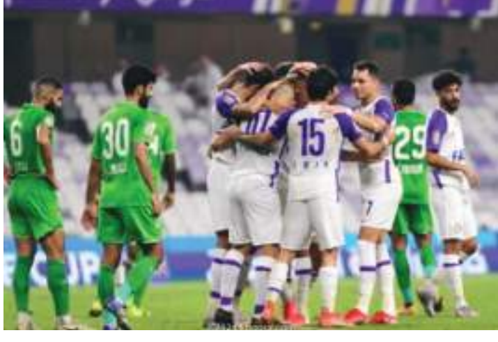
اتحاد كلباء X العروبة