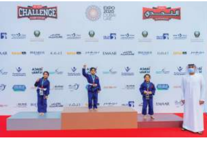
أبوظبي / وام :

تحقق عامما بعد آخر نجاحا لافتا في استقطاب أعداد أكبر من المشاركين، في مشهد يعكس زيادة الوعي بأهمية هذه الرياضة في المجتمع الإماراتي، وتجسد الدور الكبير للأسر في دفع أبنائها نحو اتخاذ هذه الرياضة كاسلوب حياة يعود بالمنفعة على الصحة البدنية والذهنية للجيل الناشئ.