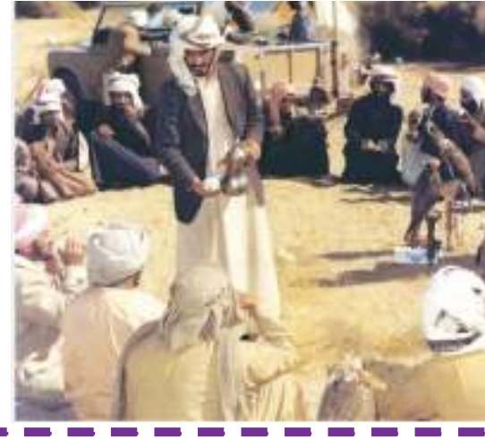
مرافقو الشيخ زايد من الصقارين في جلسة صباحية والتشاور حول القنص