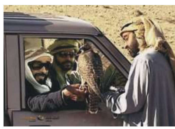
صاحب السمو الشيخ محمد بن زايد يعرض صقراً على والده المغفور له الشيخ زايد

وعليك ماظنيه بادي وخل الهبوب تروح وتيبب ريش شعيع عقب المصادي واللي سبق طيره بلاطيب بيتيم في حزنه ينادي عند اخويانا والاصحاب كلن بخبره بايسادي وان ماضوي ودوله الجيب ترهاب والطبخه عنادي قصيدة فيها وصفاً كاملاً لرحلة القنص ومزايا الطير وصفاته وطريقة صيده للحباري . كتاب الشيخ زايد عن الصيد بالصقور استضافت أبوظبي في العام ١٩٧٦ مهرجان الصيد بالصفور ووفد إليه جميع صقاري العالم وصدر كتاب توثيقي في ميدان الصيد بالصقور من تأليف المغفور له بإذن الله،