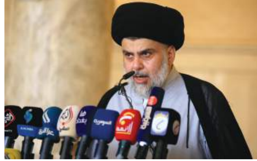
القاهرة (د ب أ) -

نفسه بالنسبة لتحالف قوى الدولة الوطنية بزعامة كل من رئيس تيسار الحكمة" عمار الحكيم ورئيس الوزراء الأسبق حيدر العبادي، الذي لم يحصد سوى ٤ مقاعد، بواقع مقعدين لكل منهما. علما بأن تيار "الحكمة" كان له ١٦ مقعدا وكان للعبادي مثلهم تقريبا. وخلف التيار الصدري، باتسي ائتلاف "دولة القانون" بزعامة رئيس الوزراء الأسبق نوري المالكي، الذي رفع عدد مقاعده في البرلمان في هذه الانتخابات، من ٢٥ مقعدا إلى ٣٧، وهو ما يعني أن الصدر والمالكي هما من ظفرا بقصبة السبق على الساحة الشيعية. ومن هنا يكتبس الحديث عن شكل الحكومة المقبلة، التي جرى العرف أن يكون رئيسها شيعيا، زحما يوما بعد يوم. ومن خلال النتائج المعلنة، هناك ٣ تحالفات أو كتل سياسية شيعية، سيكون دورها محوريا في تحديد المسارات المقبلة، وهي التيار الصدري وائتلاف "دولة القانون" وتحالف "الفتح". ويرى مراقبون أن حصول التيار الصدري على المركز الأول لا يعني أن الطريق أمامه ستكون مهدة، فهو يحتاج إلى التوصل لتوافقا مع شركائه في المكون الشيعي قبل أن ينخرط في مشاوراته مع المكونين السنة والكردي.