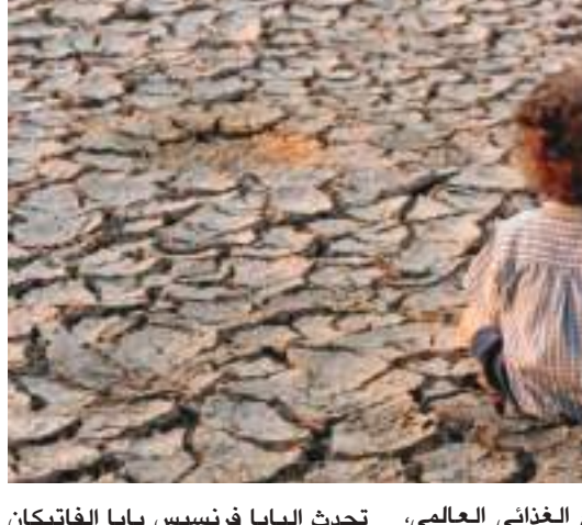
روما (د ب أ) -

دعت الأمم المتحدة إلى اتخاذ مزيد من الإجراءات ضد الجوع وأزمة المناخ قبيل يوم الأغذية العالمي. وقال المدير العام لمنظمة الأمم المتحدة للغذاء والزراعة (فاو) شو دونيو في مراسم الافتتاح يوم الجمعة أن الجوع أثر على ٨١١ مليون شخص في العالم في العام الماضي، على الرغم من أن العالم ينتج أغذية تكفي الجميع و"هنا لا يمكن تصوره وغير مقبول". وحذر شو من أن المخاطر أكبر ما تكون بالنسبة للشباب، وقال إنه في الأعوام المقبلة، يجب التخفيف من آثار تغير المناخ لمحاربة الجوع والفقر. وللقيام بذلك، قال إنه يجب أن يصبح إنتاج الغذاء العالمي أكثر كفاءة واستدامة، مشيرا إلى أنه يمكن للمستهلكين أيضا المساهمة بسلوكهم. من جانب، قال الأمين العام للأمم المتحدة أنطونيو جوتيريش في رسالة بالفيديو أن يوم الأغذية العالمي اليوم السبت هو دعوة لتحقيق الأمن الغذائي العالمي. وقال إن وبياء فيروس كورونا تسبب