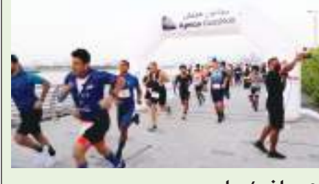
عجمان / وام :

اختتمت أمس بنجاح فعاليات النسخة الثانية من سباق «دواثلون عجمان» الذي نظمته دائرة التنمية السياحية بعجمان بالتعاون مع مؤسسة القدرة للخدمات الرياضية ضمن الأجندة الرياضية الخاصة بالإمارة بمشاركة عدد كبير من المتسابقين والمتسابقات.