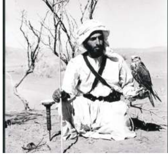
الشيخ زايد في شباب خلال رحلة قنص

يقلم /أنور بن حمدان الأعيبي - كاتب وشاعر اماراتي