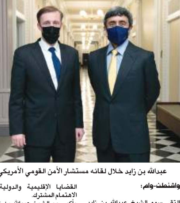
عبدالله بن زايد خلال لقائه مستشار الأمن القومي الأمريكي