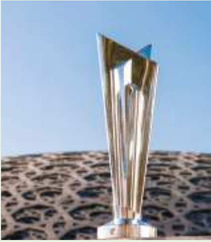
أبو ظبي / وام :

شهد متحف اللوفر بالعاصمة الإماراتية أبو ظبي عرض « كأس العالم للكريكت » وذلك في مبادرة بالتعاون بين دائرة الثقافة والسياحة بأبو ظبي والمجلس الدولي للكريكت ICC ونادي أبو ظبي للكريكت عضبة انطلاق بطولة كأس العالم للكريكت T٢٠ للرجال ٢٠٢١ التي تستضيفها الإمارات. جاء عرض الكأس المصممة للبطولة في المتحف الذي يتمتع بسبعة عالمية ضمن الحملة الترويجية للبطولة قبل انطلاق المنافسات التي يتوقع أن تحظى بمتابعة الملايين حول العالم.