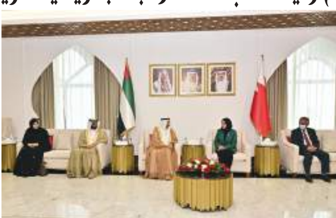
صقر غباش خلال مباحثاته مع رئيسة مجلس النواب البحريني