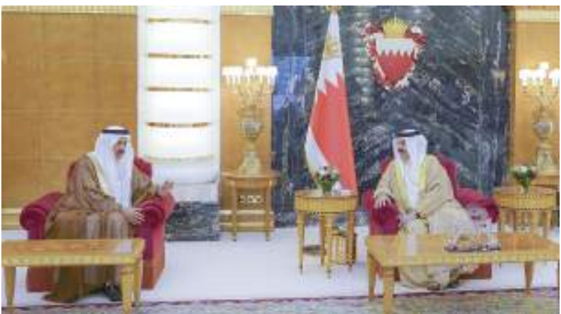
ملك البحرين خلال استقباله صقر غباش