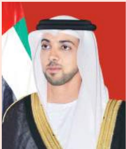
منصور بن زايد