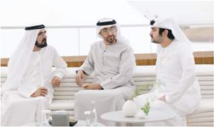
محمد بن راشد يلتقي أخاه محمد بن زايد في «إكسبو ٢٠٢٠ دبي»

حضارات العالم شرقاً وغرباً وما يتبعه من أثر يتجسد في تحقيق مزيد من التقارب الفكري والثقافي بين الشعوب وهو ما يشكل أساساً صلباً للشراكات الناجحة فيما بينها وبما يخدم تطلعاتها حول المستقبل.