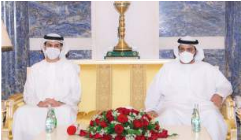
ولي عهد الفجيرة خلال حضور سموه الجلسة