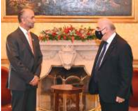
رئيس مالطا خلال استقباله الجروان

استقبل فخامة الدكتور جورج فيلا رئيس جمهورية مالطا، معالي أحمد بن محمد الجروان رئيس المجلس العالمي للتسامح والسلام في قصر الجمهورية بالعاصمة فاليتا. وأشاد فخامة الرئيس المالطي خلال اللقاء بجهود المجلس العالمي للتسامح والسلام، مؤكداً دعم بلاده المستمر للمجلس وتوجهاته الرامية لتعزيز ونشر قيم التسامح والسلام حول العالم.