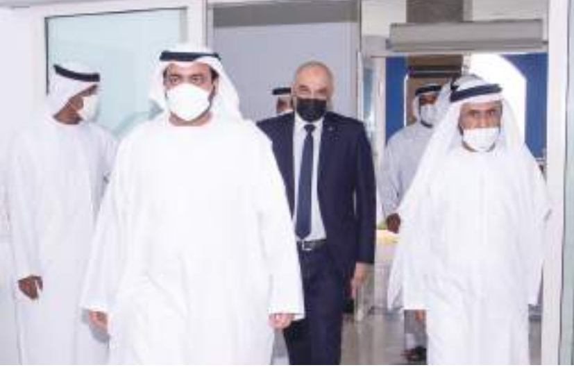
ولي عهد الفجيرة خلال ترؤسه الاجتماع