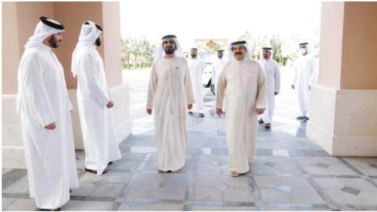
محمد بن راشد خلال لقائه ملك البحرين

وأكد صاحب السمو الشيخ محمد بن راشد آل مكتوم توافق الرؤى بين الإمارات والبحرين حول كافة القضايا محل الاهتمام المشترك على الساحتين الإقليمية والدولية، كذلك اتفاق وجهات النظر حول أهمية تعزيز العمل الخيري المشترك ومضافة الجهود والأفكار من يكفل ترسيخ دعائم الأمن والاستقرار الإقليمي، ويضمن المستقبل