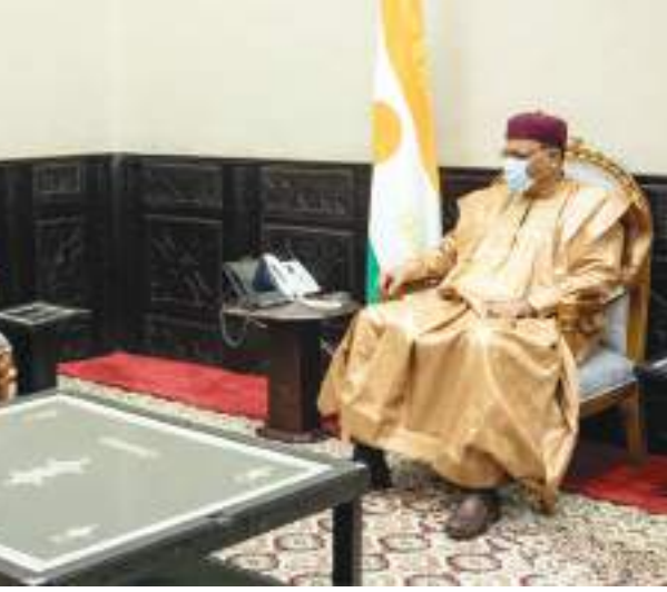
شخبوط بن نهيان آل نهيان خلال لقائه رئيس النيجر