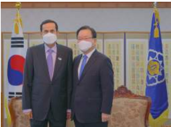
رئيس الوزراء الكوري خلال استقباله صقر غباش

نائب القائد الأعلى للقوات المسلحة عبرا عن تهنئته لدولة الإمارات بمرور «٥٠» عاما على تأسيسها وقال « إننا نستطيع معرفة رؤية دولة الإمارات المستقبلية من خلال علاقات الصداقة المتينة بيننا على مختلف الصعد».