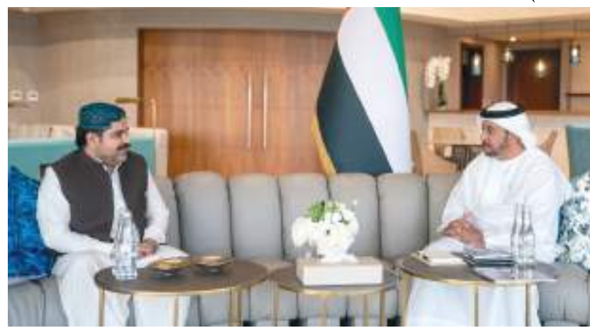
حمدان بن زايد خلال استقباله وزير البلديات في حكومة إقليم السند