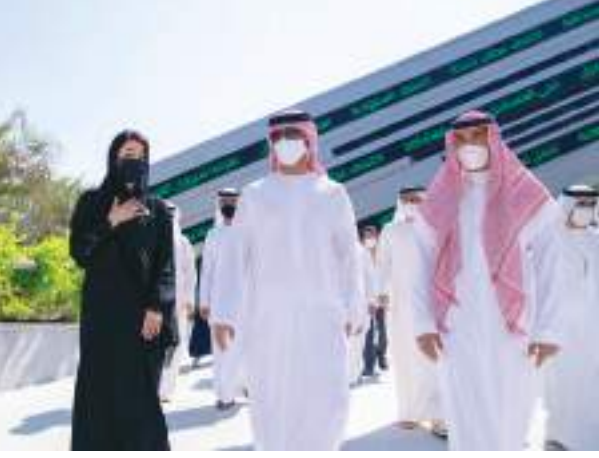
ولي عهد عجمان خلال زيارته جناحي الإمارات والسعودية في «إكسبو»