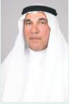
أبو ظبي - (الوحدة):