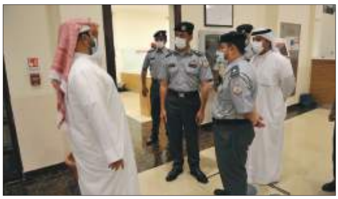
وأكد مدير قطاع المالية والخدمات بشرطة أبوظبي الحرص على تنفيذ توجيهات القيادة الرشيدة للارتقاء بالخدمات المقدمة للجمهور وفق أفضل المعايير المتطورة.

واستمع إلى ملاحظات المتعاملين والية إسعادهم أثناء حصولهم على الخدمات المقدمة من شرطة أبوظبي كما تعترف إلى المقترحات