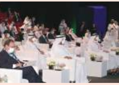
أحمد بن سعيد خلال حضوره الفعاليات دبيها

برعاية صاحب السمو الشيخ محمد بن راشد آل مكتوم، نائب رئيس الدولة رئيس مجلس الوزراء حاكم دبي، رعاه الله، افتتح سمو الشيخ أحمد بن سعيد آل مكتوم، رئيس المجلس الأعلى للطاقة في دبي، أم فعاليات الدورة السابعة من القمة العالمية للاقتصاد الأخضر في دبي، والتي تنطلقها هيئة كهرباء ومياه دبي والمنظمة العالمية للاقتصاد الأخضر في مركز دبي للمعارض، في إكسبو ٢٠٢٠ دبي على مدى يومين، بحضور عدد من أصحاب المعالي الوزراء وكبار المسؤولين الحكوميين من مختلف أنحاء العالم.