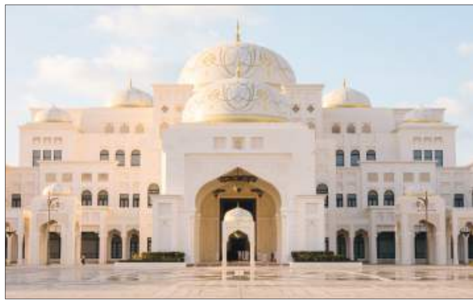
قصر الوطن جولات إرشادية لغة مألوفة وسهلة في نسخة مبسطة من التجربة المخصصة للبالغين لضمان تمكن الأطفال خاصة بالأطفال تستخدم من المتابعة وفهم الأوصاف

ويهدف توفير تجربة مميزة تضمن المشاركة الثقافية للأطفال وتمكينهم من استكشاف الملامح المختلفة للقصر، أطلق