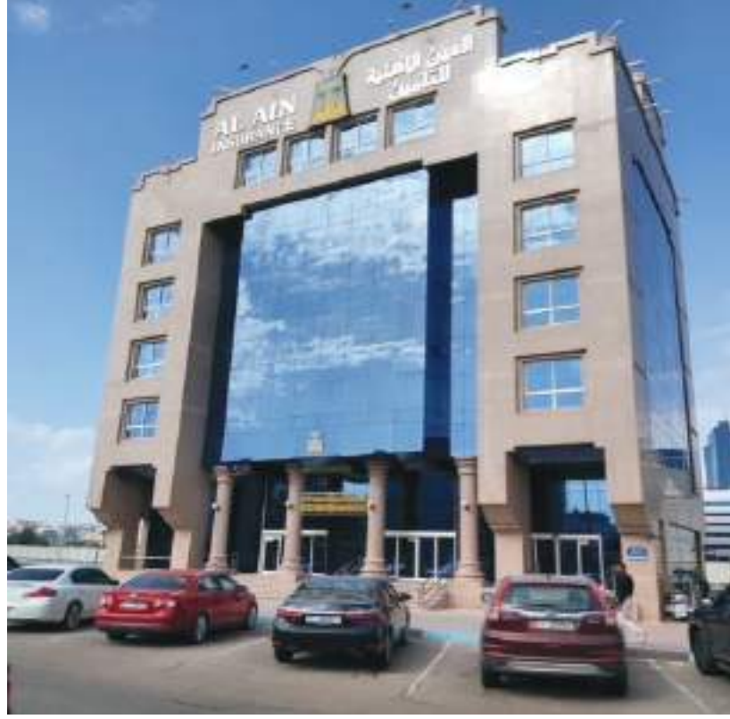
أبوظبي - الوحدة:

أعلنت وكالة "إس أند بّي جلوبال" للتصنيفات الائتمانية مؤخراً عن منح تصنيف القوة المالية لشركة العين الأهلية للتأمين في الفئة A- مع نظرة مستقرة. ويأتي منح شركة العين الأهلية هذا التصنيف في ظل الأداء الإيجابي الذي حققته الشركة، وتركيزها على تحقيق قيمة أعلى للمساهمين. وقامت وكالة موديز الدولية مؤخراً بتصنيف الشركة في الفئة A٣ مع نظرة مستقرة. وتعكس هذه التصنيفات الائتمانية الدولية ومكانة شركة العين الأهلية للتأمين السوقيّة وعلامتها التجارية، كونها تعد رابع أكبر شركة