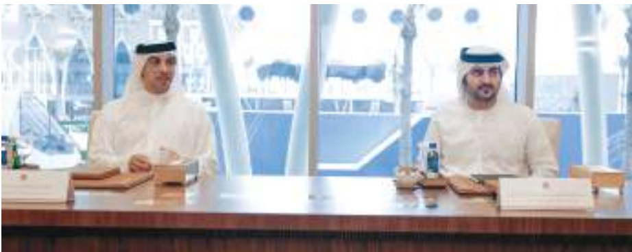
مكتوم بن محمد خلال ترؤسه الاجتماع بحضور منصور بن زايد