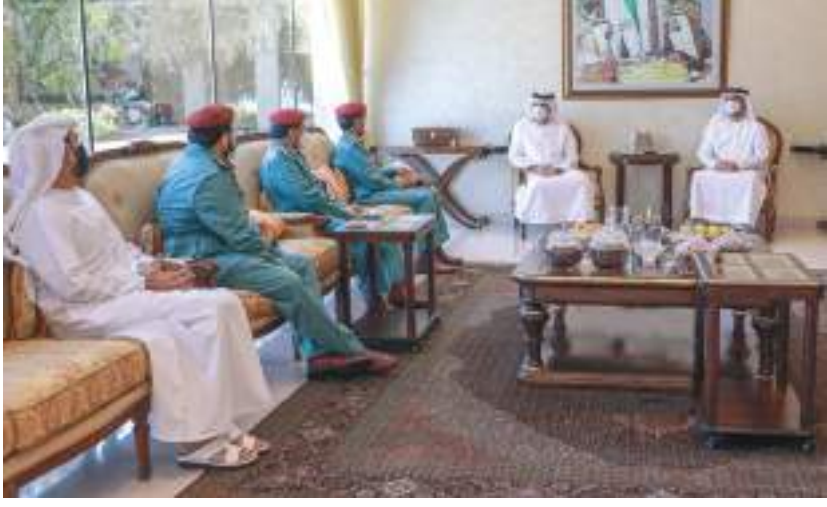
حاكم رأس الخيمة خلال استقباله اللواء الركن خليفة حارب الخييلي