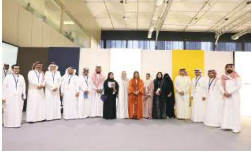
الرياض - وام:

قوية للترجمة وبناء الشراكات العالمية يسهم بالاستثمار في إمكانات قطاع النشر العربي وتحولها إلى إنجازات عملية.. لافتة إلى أن ذلك يدعم جهود الوصول إلى نهضة جديدة في الثقافة العربية. وفي حديثها عن الفرص التاريخية التي قدمتها جائحة كورونا للارتقاء بصناعة النشر.. دعت الشبيخة بدور القاسمي الناشرين العرب إلى تبني نهج استشاري يتكامل مع نماذج الأعمال المستدامة لتمكينهم من تطوير أفكارهم ورواهم ومشاريعهم وتعزيز جهودهم لتوسيع نطاق أعمالهم إلى الأسواق العالمية كما دعت الشركاء وأصحاب المصلحة في قطاع النشر إلى تقديم محتوى معرفي مبتكر والمساهمة في دعم الحوار الثقافي بين الشرق والغرب من خلال