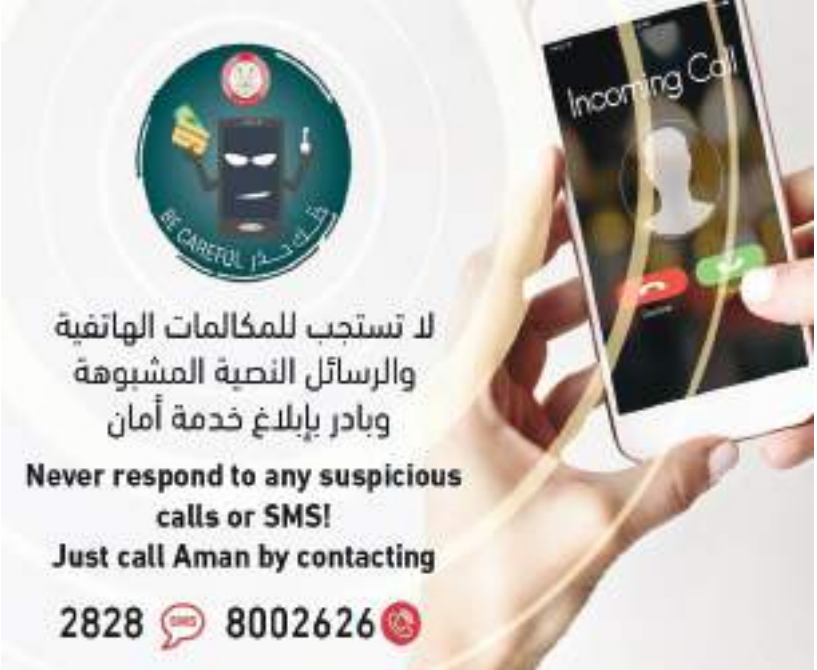
أبوظبي - الوحدة:

دعت شرطة أبوظبي الجمهور إلى عدم الرد على المكالمات المجهولة أو رسائل البريد الإلكتروني أو الرسائل العادية المشبوهة. وحثت عملاء البثوك على التواصل مع البنوك (التي تقدم الخدمات المصرفية لهم) مباشرة عبر أرقام هواتفهم على مواقعها الإلكترونية لافتة إلى أن المحتالين يرسلون روابط إلكترونية أو يتواصلون مع الضحايا هاتفياً ويطلبون منهم تزويدهم ببياناتهم البنكية، متحججين بعدة أسباب منها: عدم حظر بطاقة الصراف الآلي، أو بحجة تحديث البيانات، أو (الادعاء بفوز العميل) بجائزة فاز بها في مسابقة لم يشترك بها من الأساس!! وأوضحت أن أساليبهم الاحتيالية تصل إلى درجة الادعاء بأنهم من ضمن المكرمين